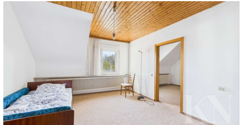
OG Schlafzimmer 1