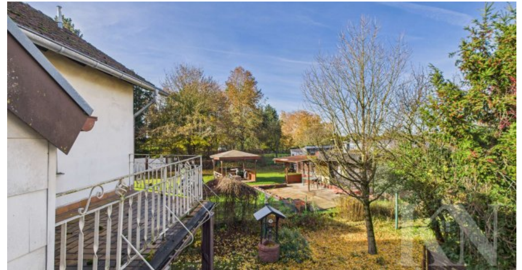
OG Aussicht Balkon