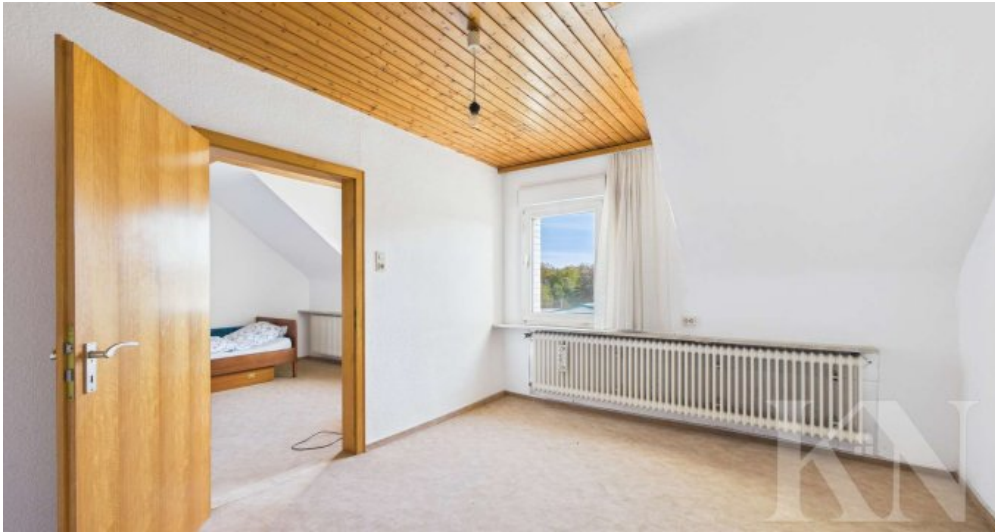
OG Schlafzimmer 2