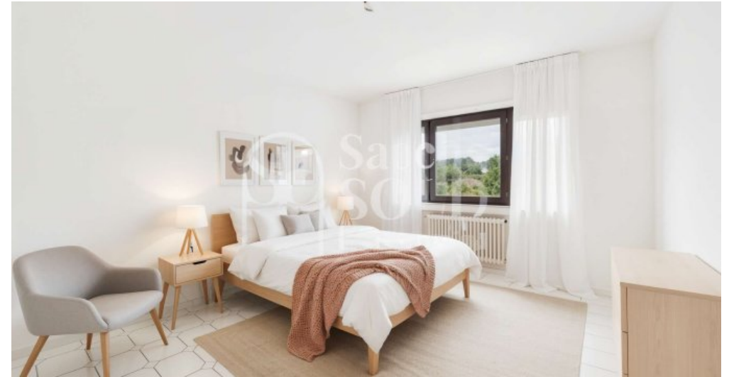
Schlafzimmer 1 - (Einrichtungsbeispiel))