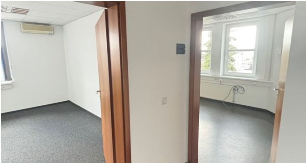
Zugang zu Büros