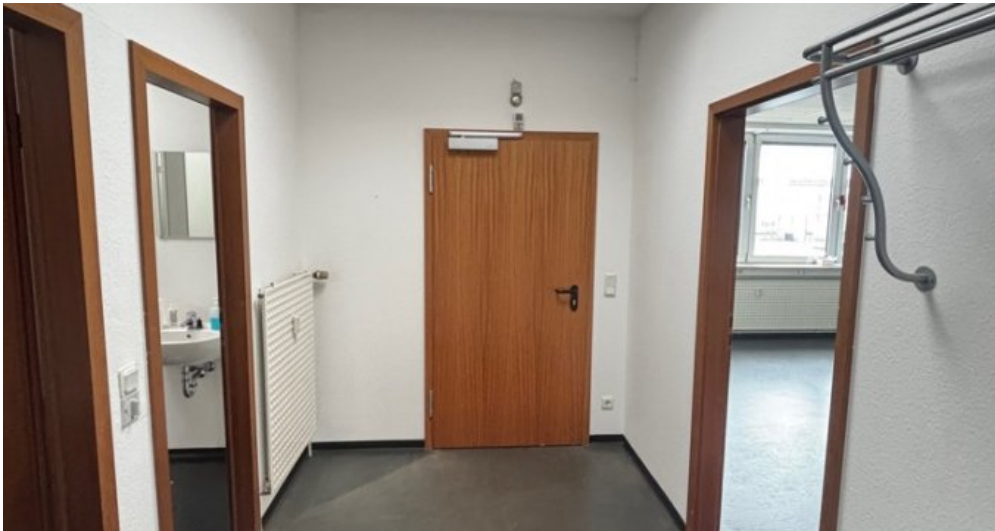
Zugang zu hinterem Treppenhaus