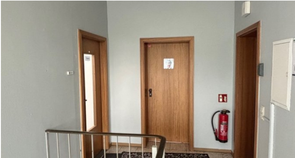
Zugang im 1. OG