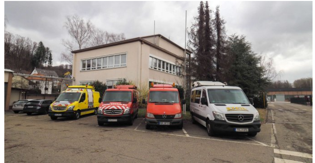
Parkflächen am Gebäude