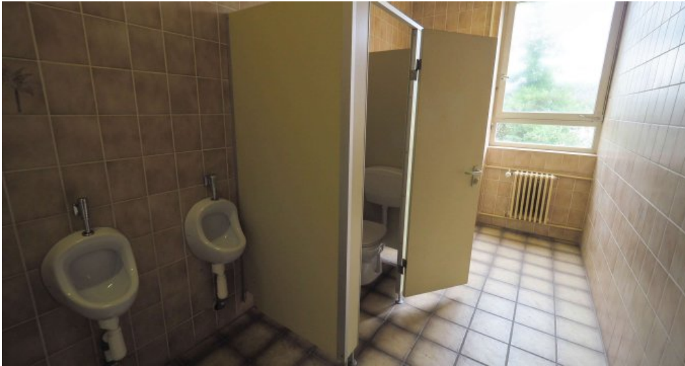
Bürogebäude 2 OG