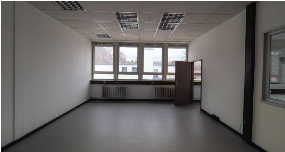
Bürogebäude 2 OG