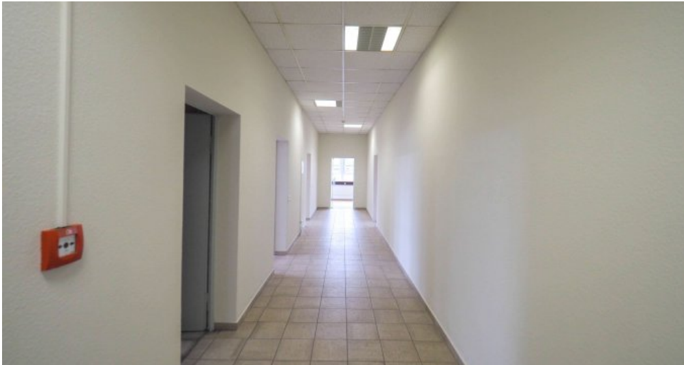
Bürogebäude 2 OG