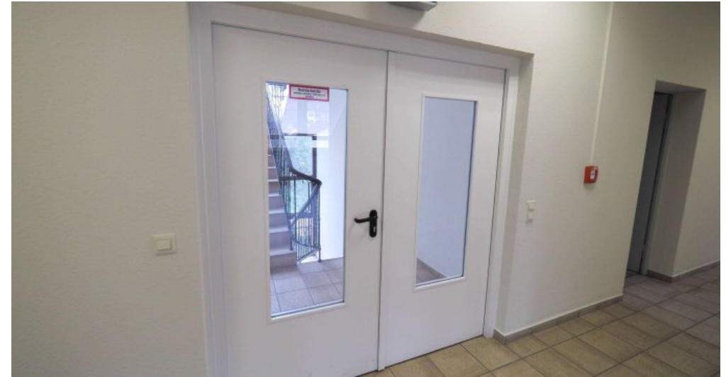
Bürogebäude 2 OG