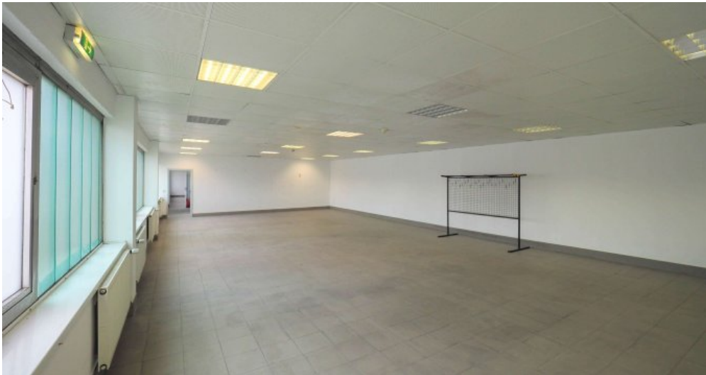
Bürogebäude 1 OG