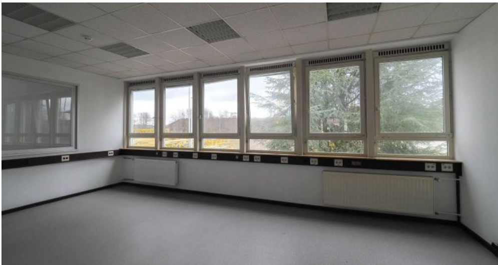
Bürogebäude 2 OG