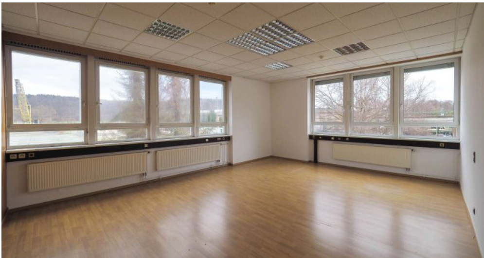
Bürogebäude 2 OG