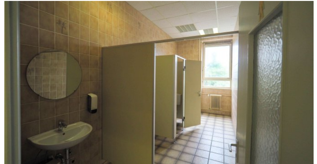
Bürogebäude 2 OG