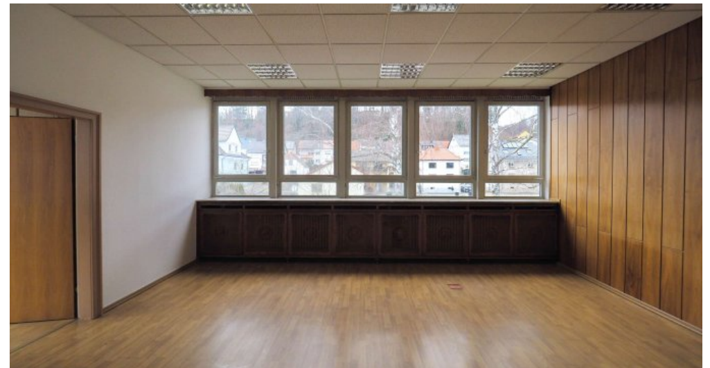
Bürogebäude 2 OG