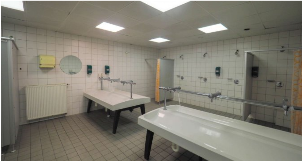
Waschräume Bürogebäude 1 OG