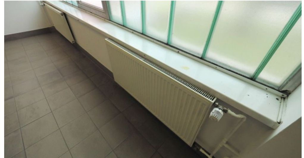
Bürogebäude 1 OG