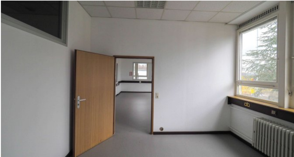
Bürogebäude 2 OG