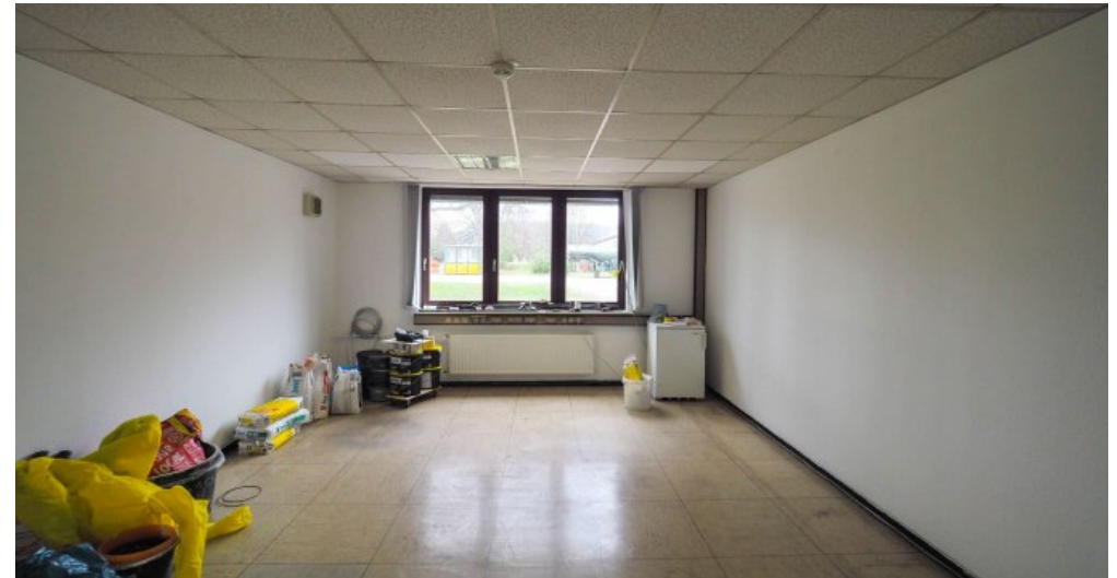
Bürogebäude 1 EG