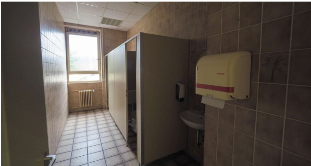
Bürogebäude 2 OG