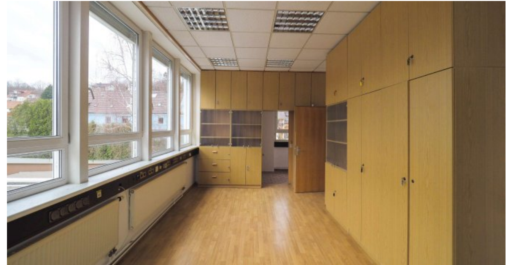
Bürogebäude 2 OG