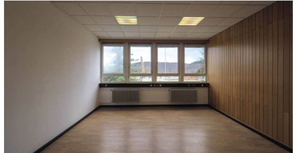
Bürogebäude 2 OG