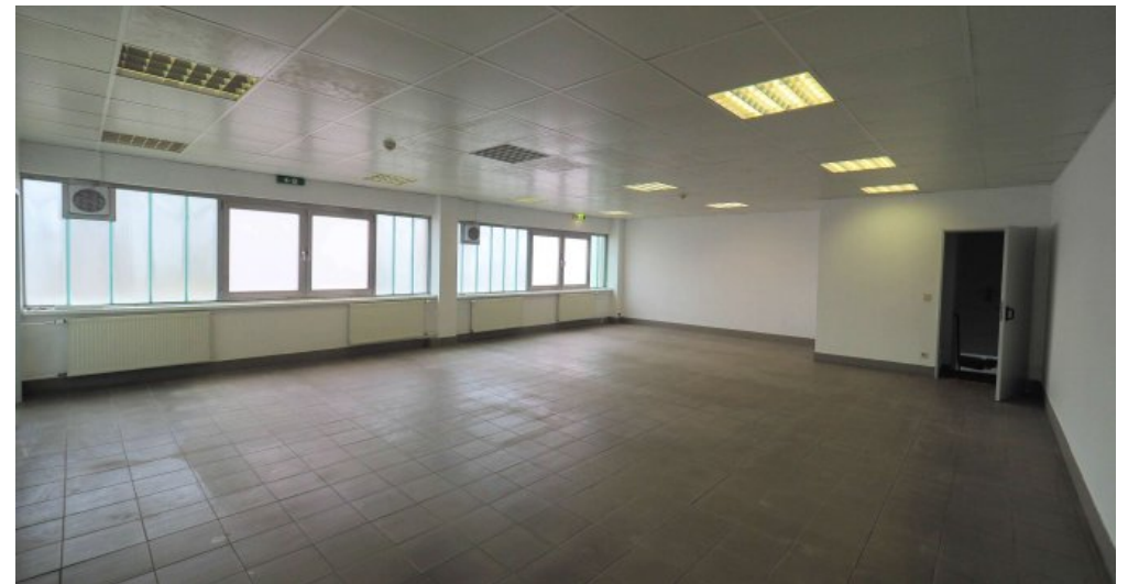
Bürogebäude 1 OG