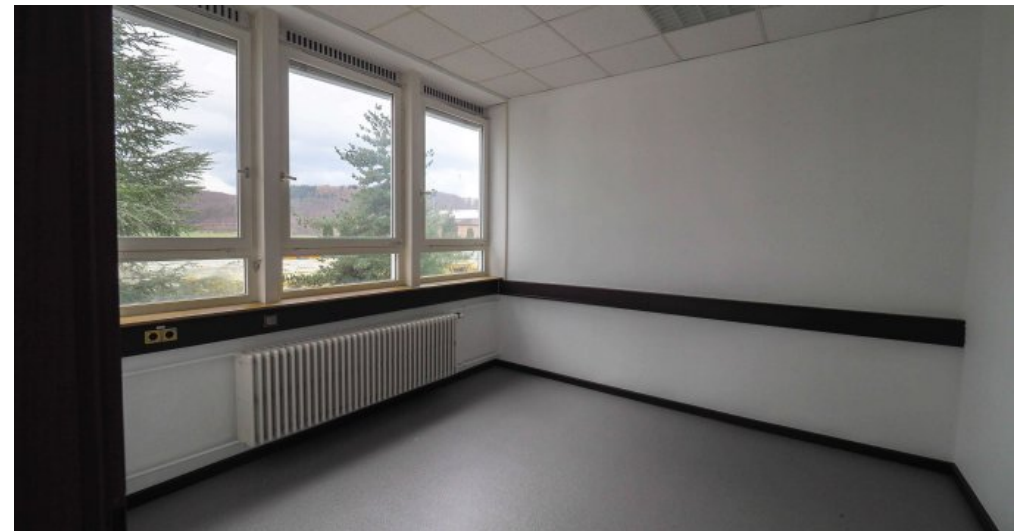
Bürogebäude 2 OG