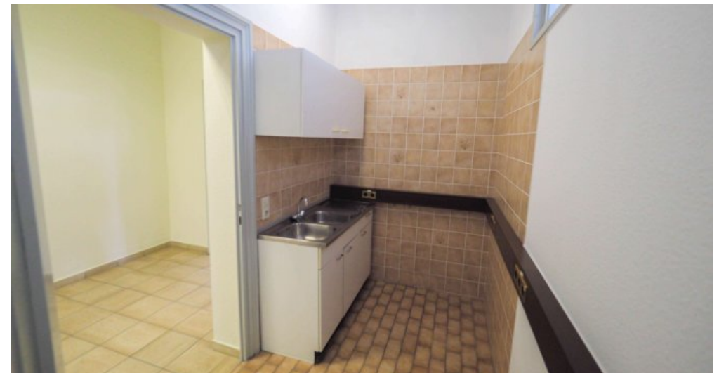
Bürogebäude 2 OG