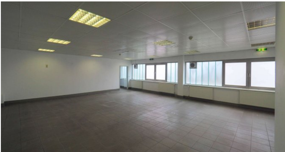
Bürogebäude 1 OG