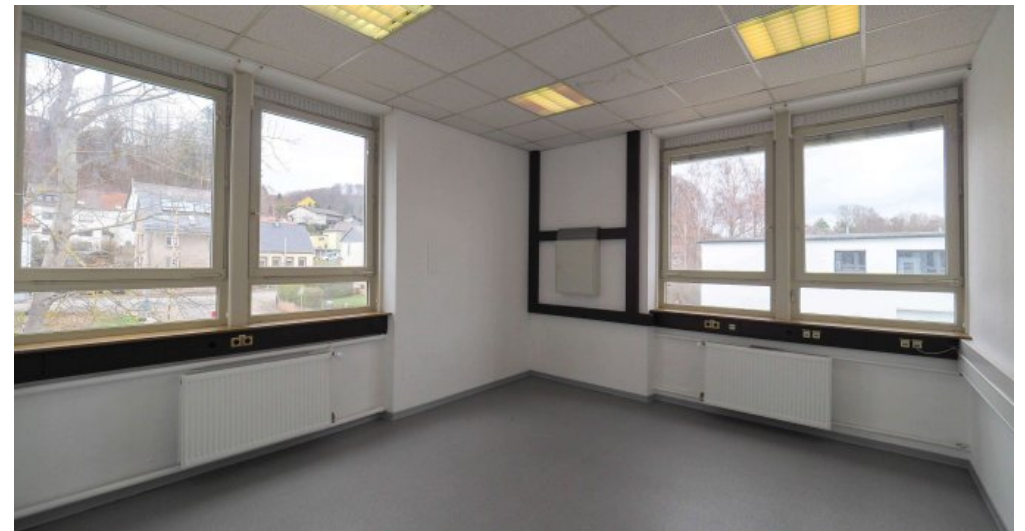
Bürogebäude 2 OG