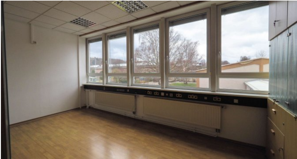
Bürogebäude 2 OG