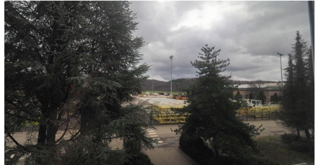
Bürogebäude 2 OG