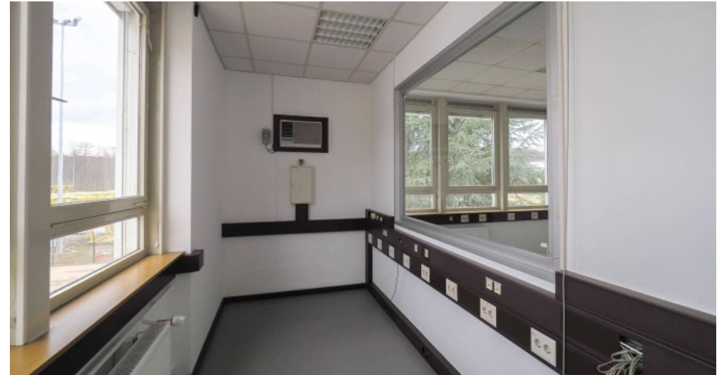
Bürogebäude 2 OG