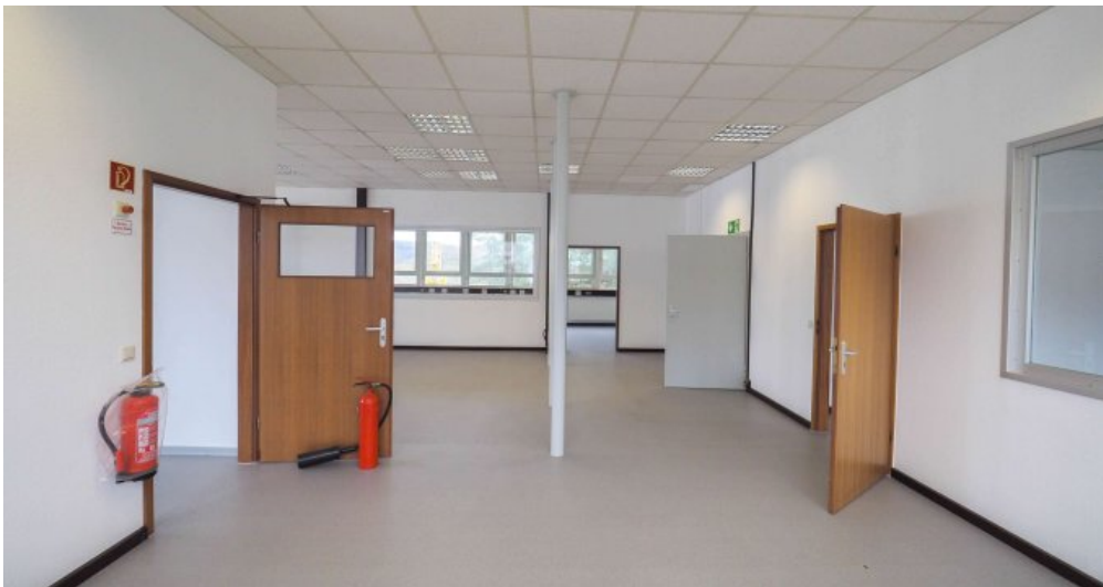
Bürogebäude 2 OG