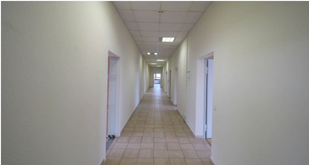
Bürogebäude 2 OG