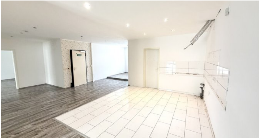
OG Wohn-oder Gewerbefläche