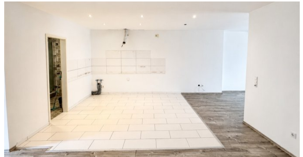
OG Wohn-oder Gewerbefläche