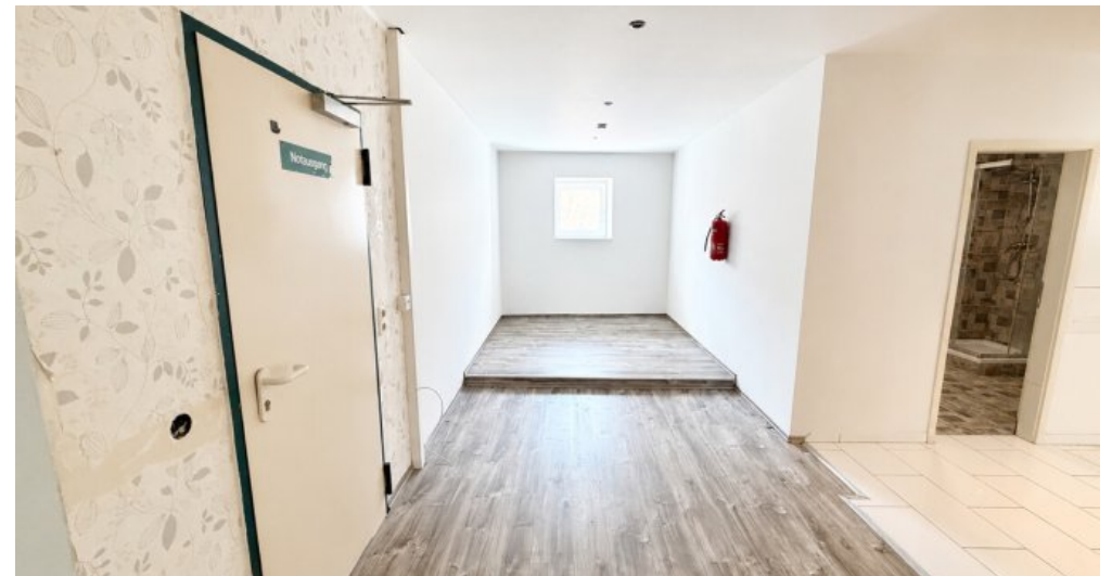
OG Wohn-oder Gewerbefläche