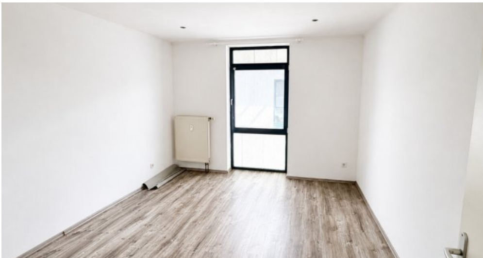
OG Wohn-oder Gewerbefläche