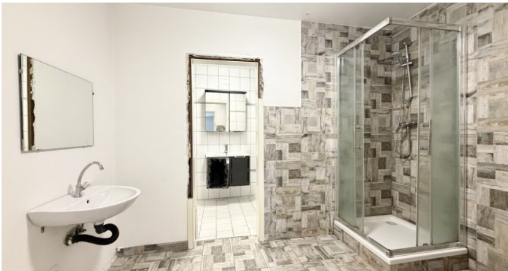
OG Wohn-oder Gewerbefläche