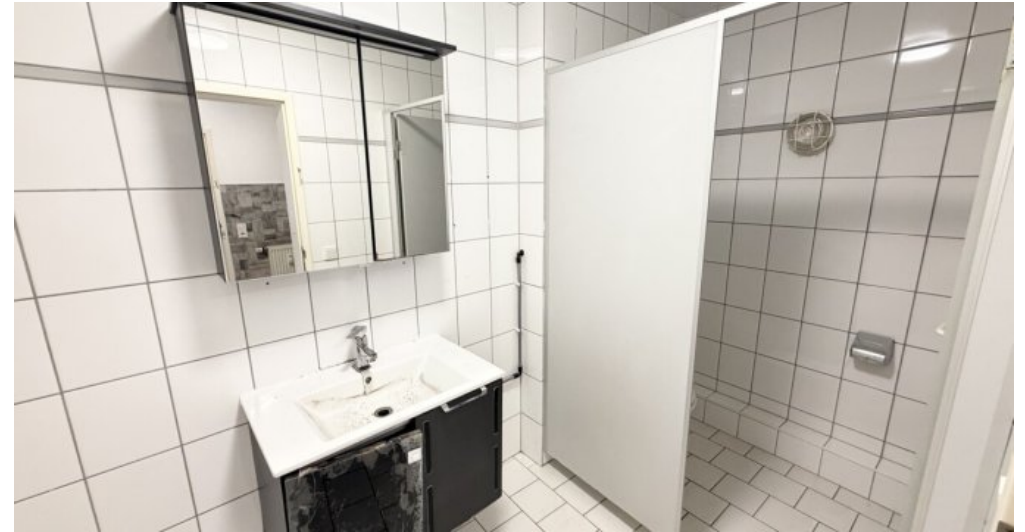
OG Wohn-oder Gewerbefläche