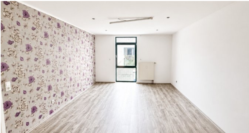
OG Wohn-oder Gewerbefläche