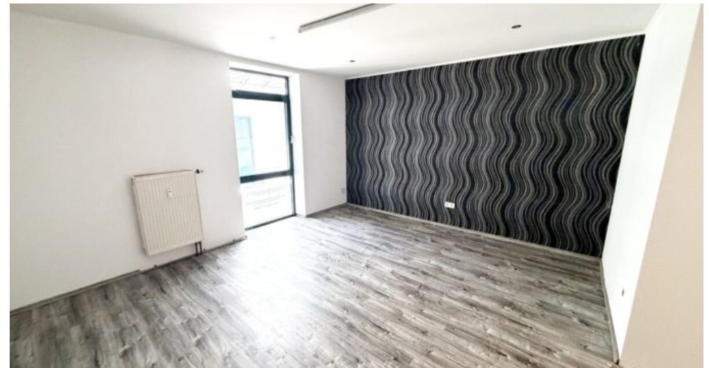
OG Wohn-oder Gewerbefläche