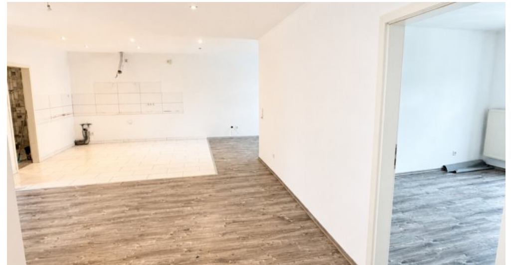
OG Wohn-oder Gewerbefläche