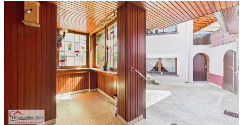
Zugang zum Wohnhaus