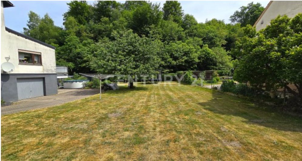
Frontbreite des Grundstücks ca. 14m