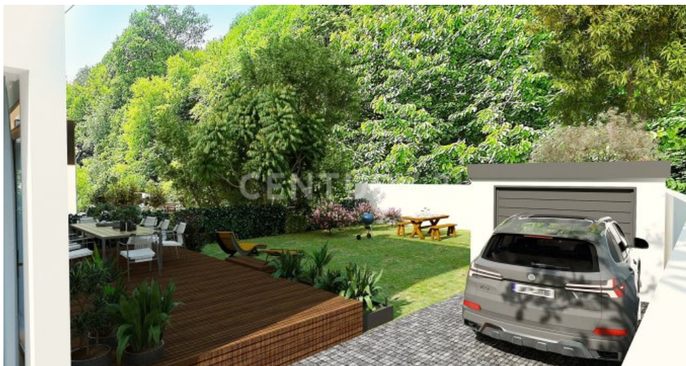
Auch eine attraktive Garage ist im hinter dem Haus möglich