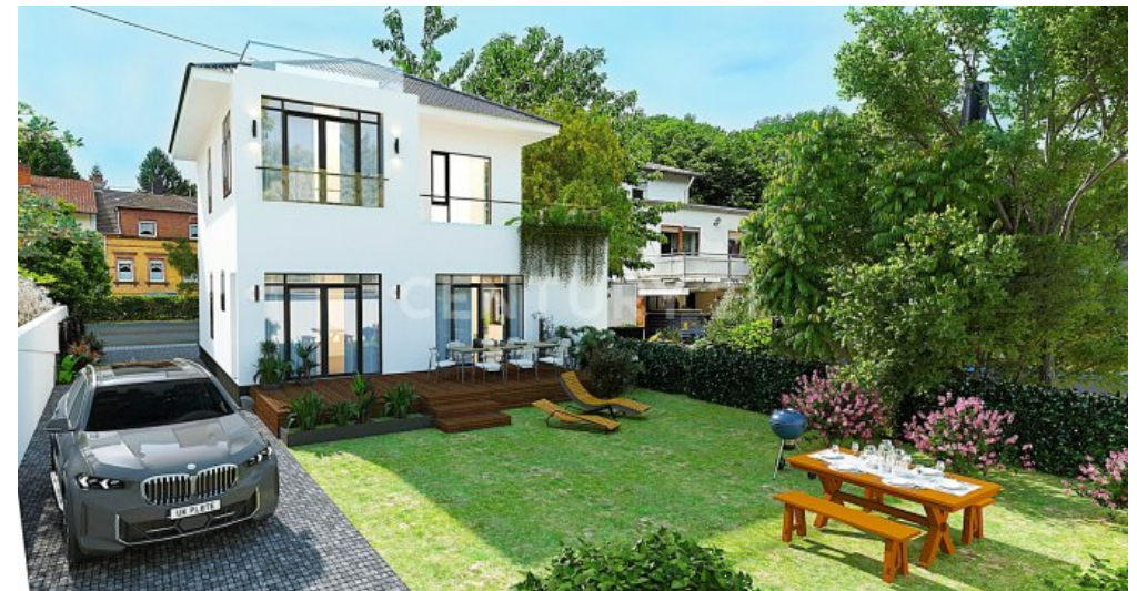
So schön könnte der Gartenbereich hinter dem Haus aussehen