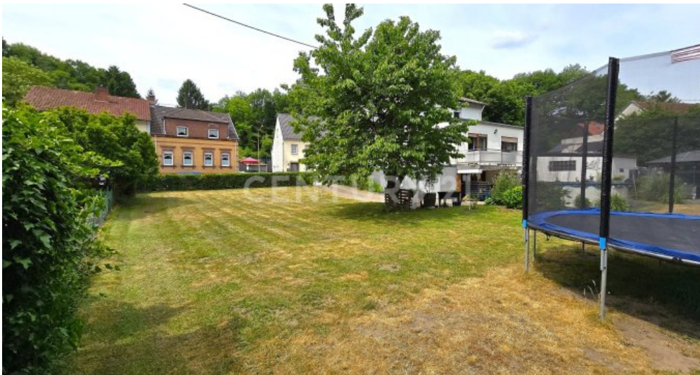
Gartenbereich des Grundstücks