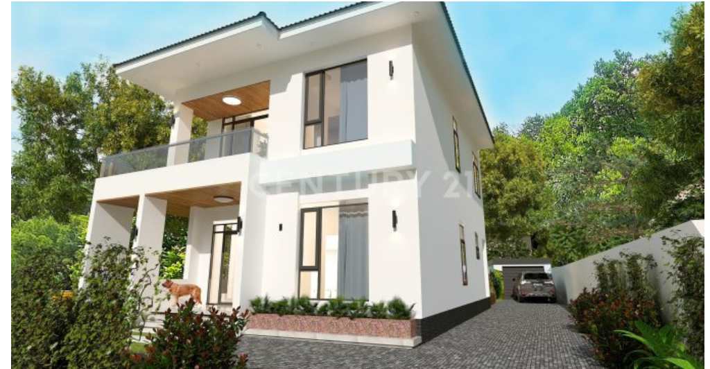
Hausbreite inkl. 3m Einfahrt möglich