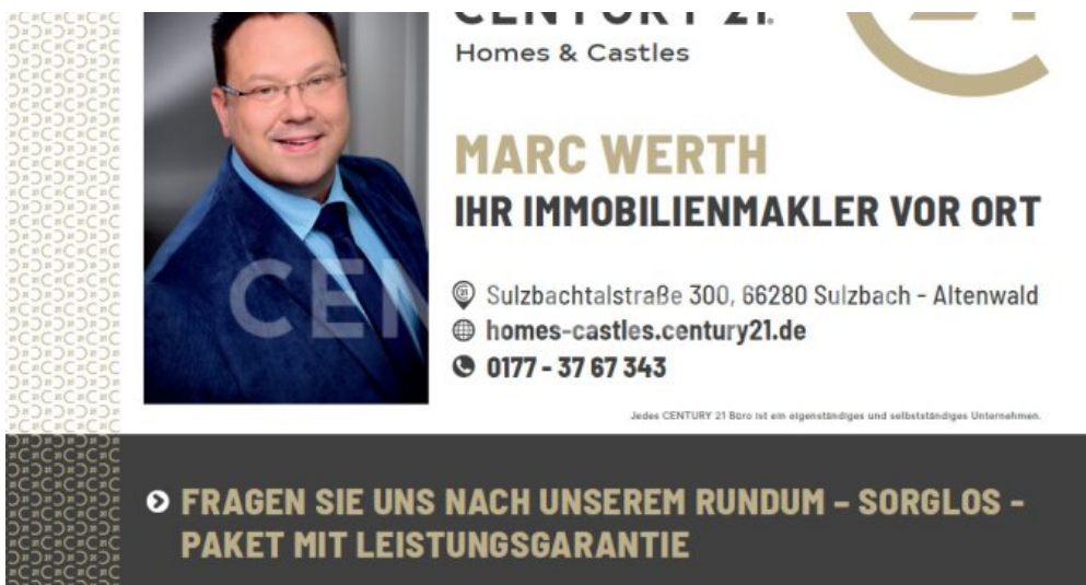
Herr Werth ist Ihr Ansprechpartner für dieses Grundstück