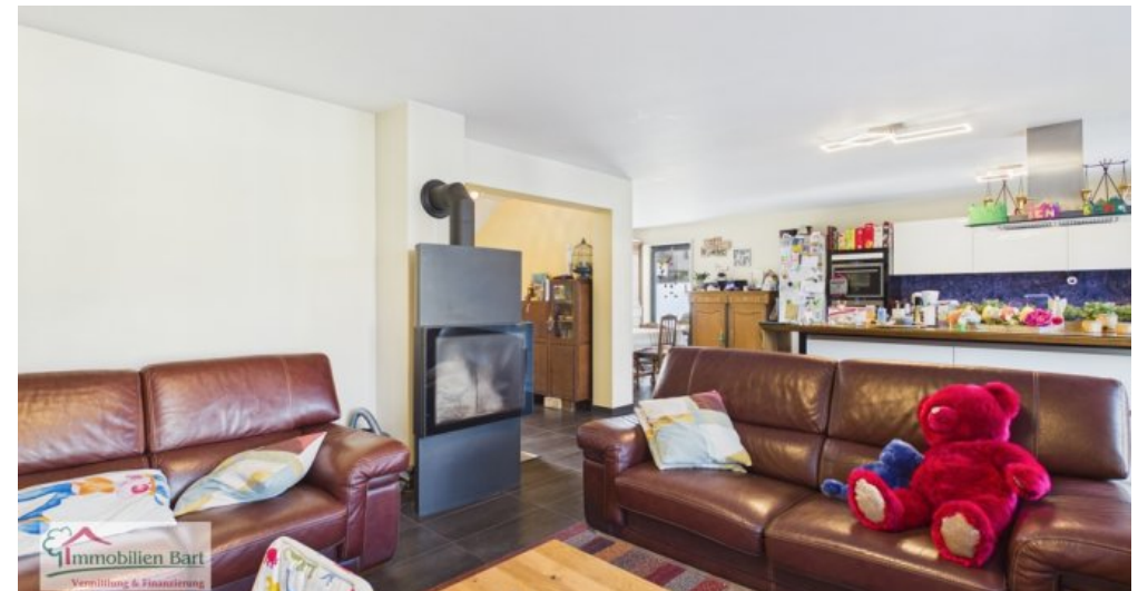
Wohnzimmer mit Kaminofen