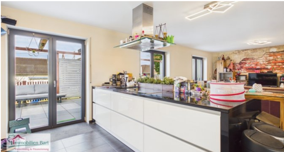
Küche mit Zugang zur Terrasse