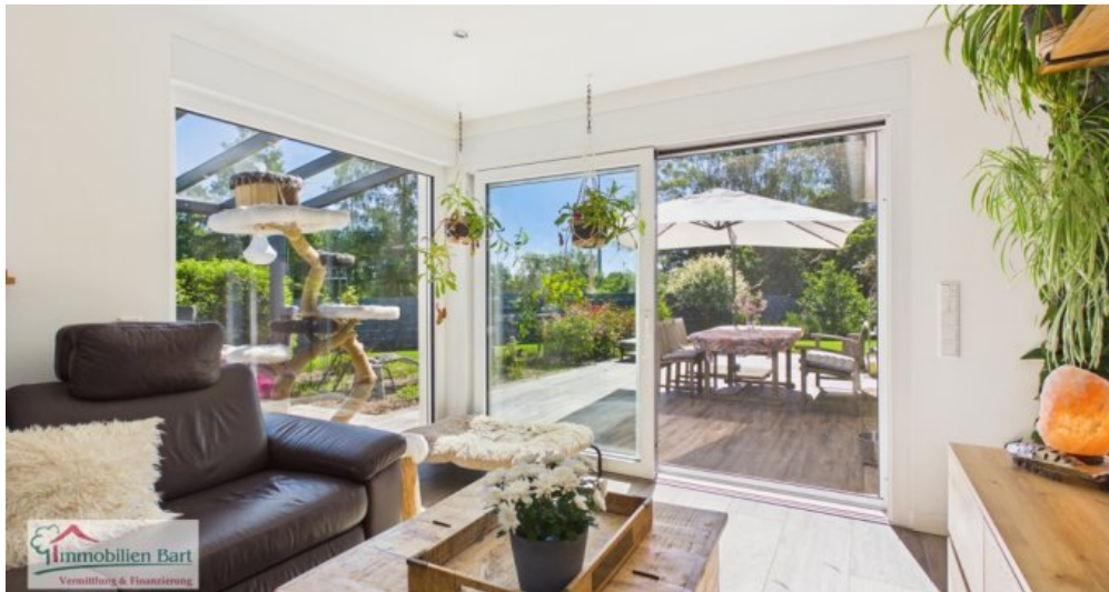
Wohnbereich mit Ausgang zur Terrasse