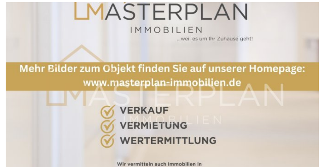
Mehr Bilder auf Website Kopie