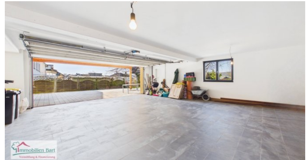
Doppelgarage im Untergeschoss