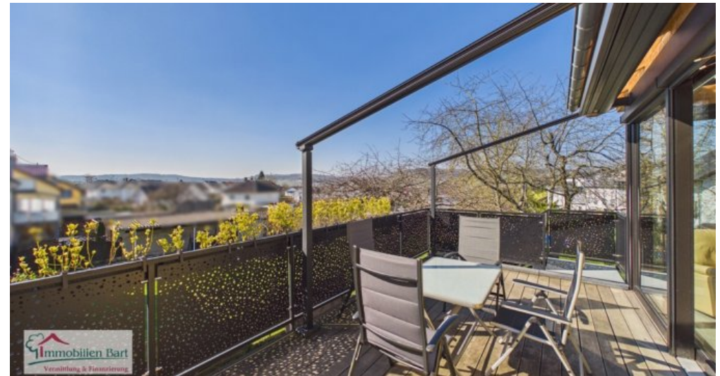
sonniger Balkon mit Blick auf die Luxemburgischen Weinberge