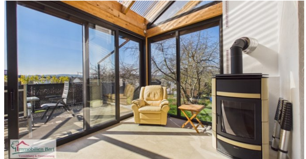
Wintergarten mit Kaminofen