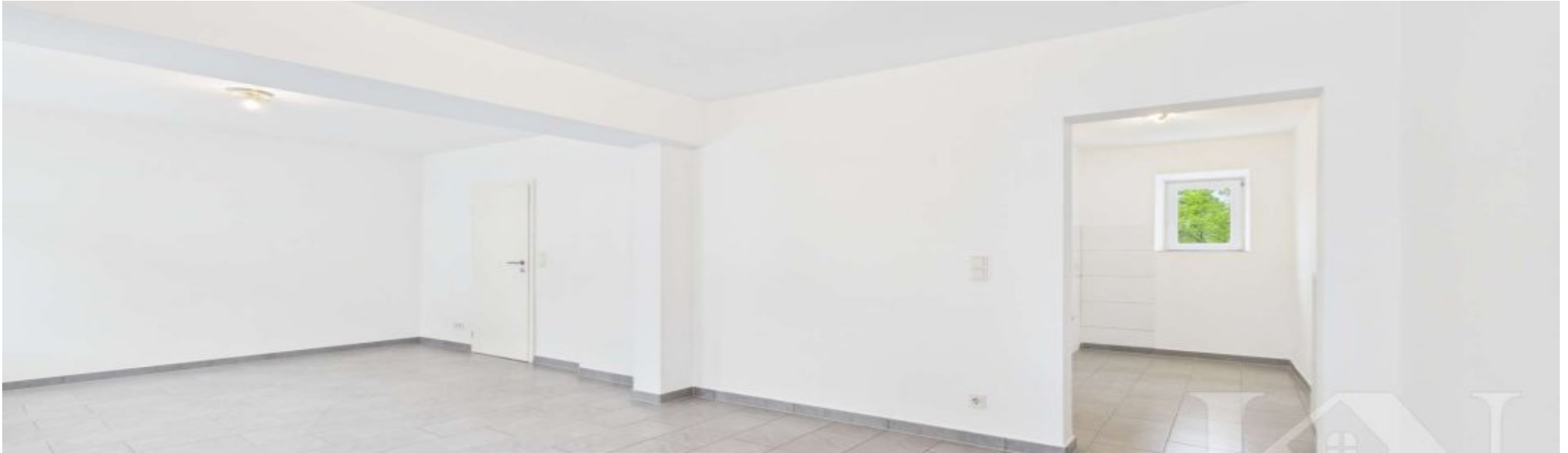
Fußböden im EG, Decken, Wände und Türen 2015 erneuert.