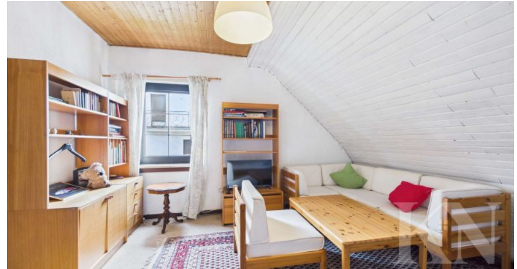
Gästezimmer / Schlafzimmer