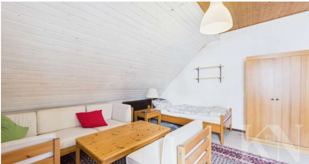
Gästezimmer / Schlafzimmer