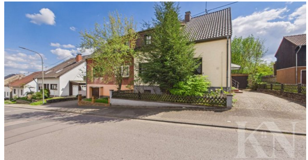
Haus Ansicht Front