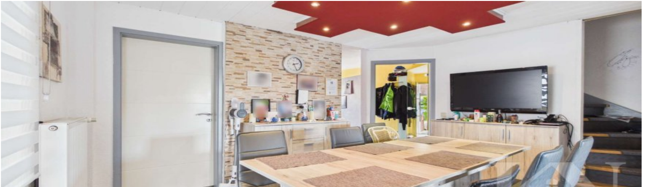
2015, Fußböden Venylböden, Laminat vor ca. 10 Jahren. Wände und Decken vor ca. 10 Jahren.