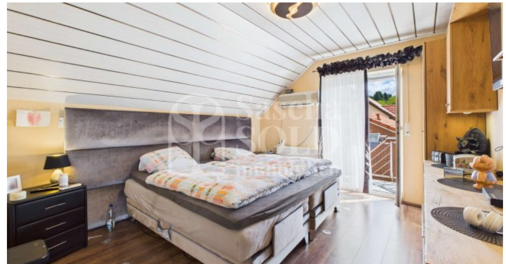
DG - Schlafzimmer