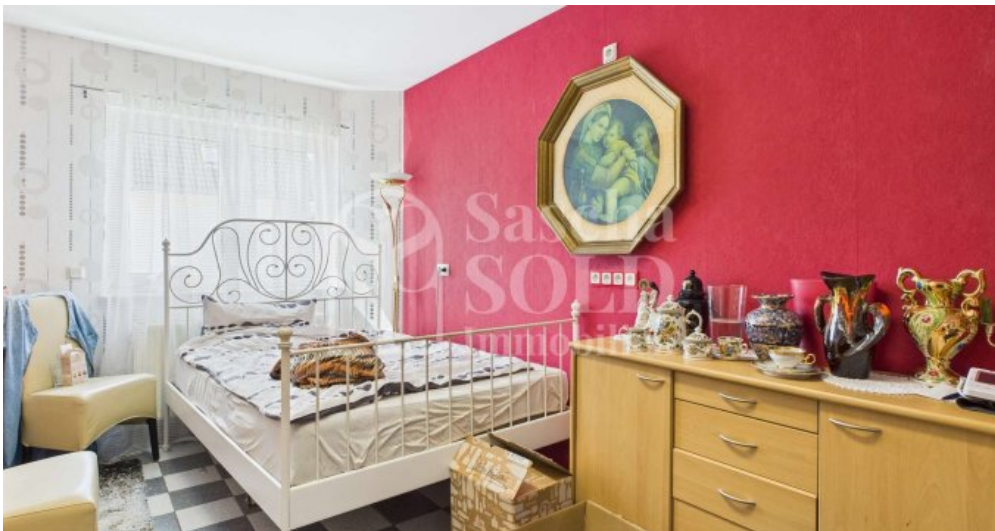
UG - Gäste-Zimmer