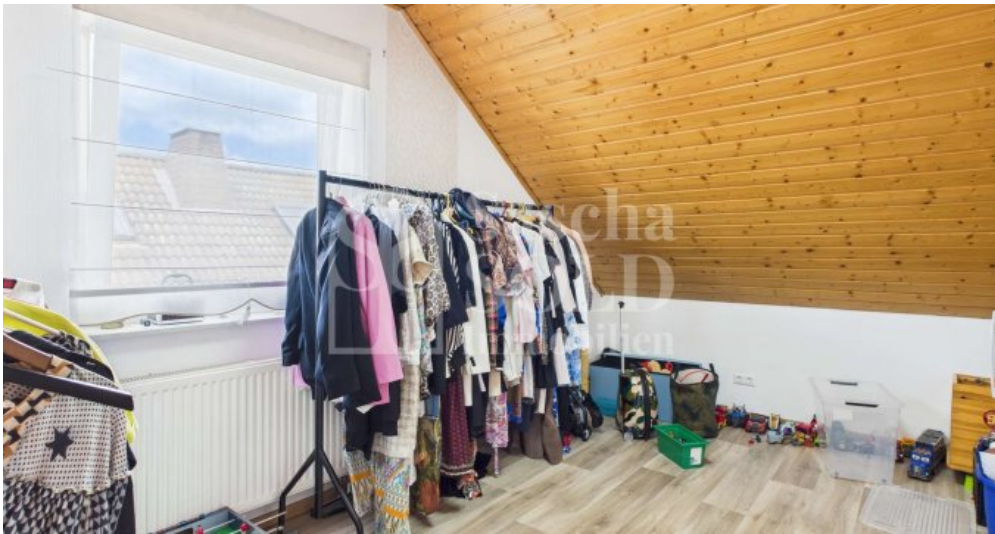
DG - Ankleide/Büro