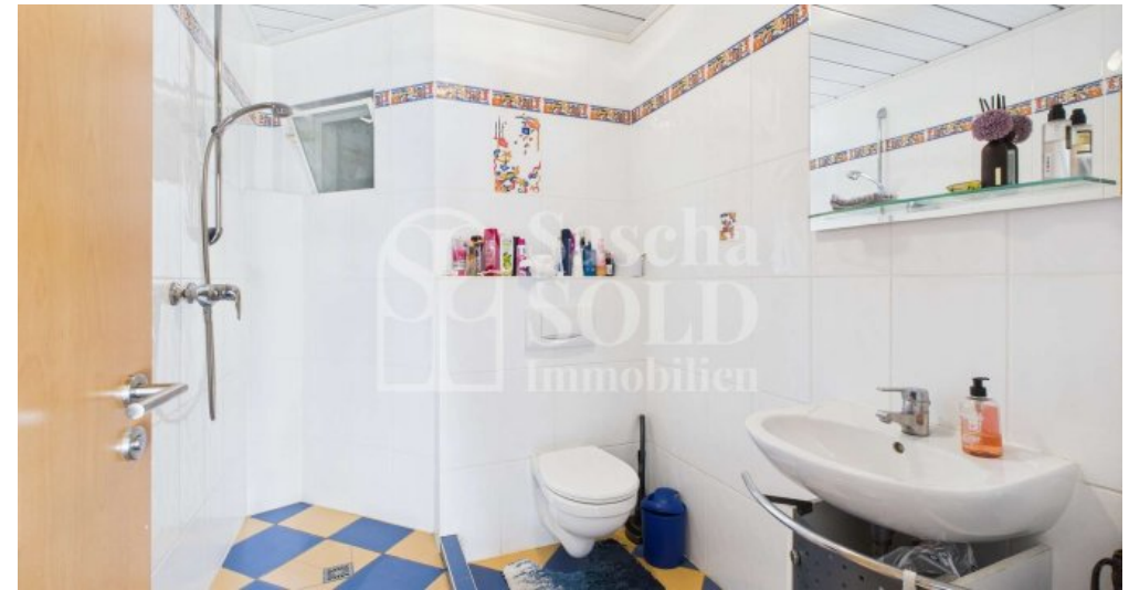
UG - Gäste-Bad