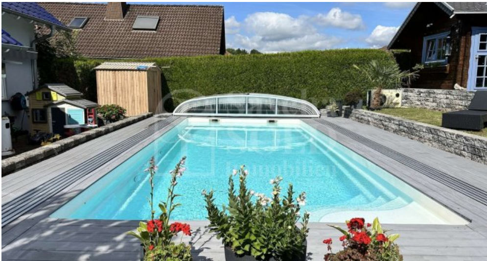
Außenanlagen - Pool