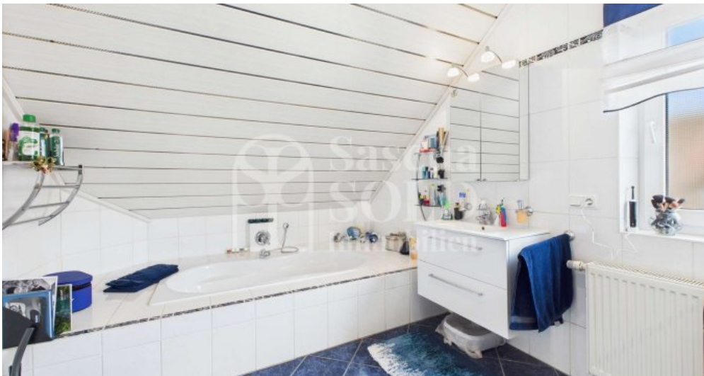
DG - Badezimmer