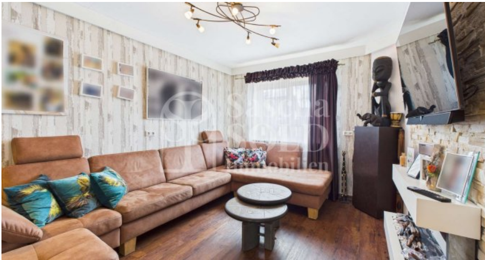
EG - Wohnzimmer