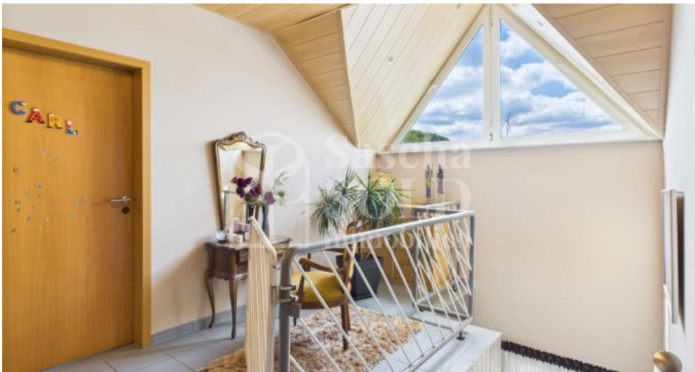
DG - Diele