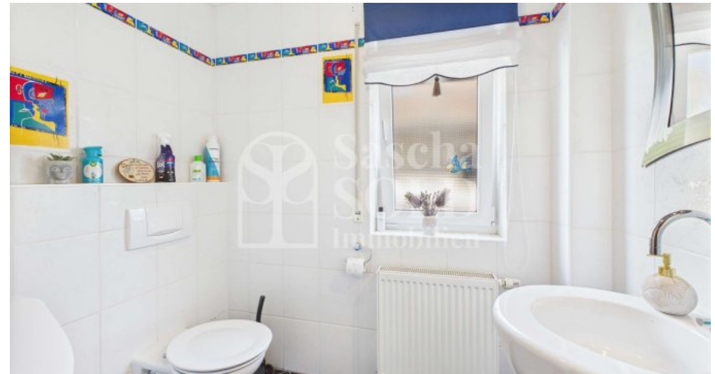
EG - Gäste-Bad