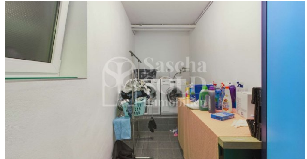
UG - Waschküche