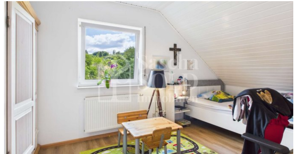
DG - Kinderzimmer