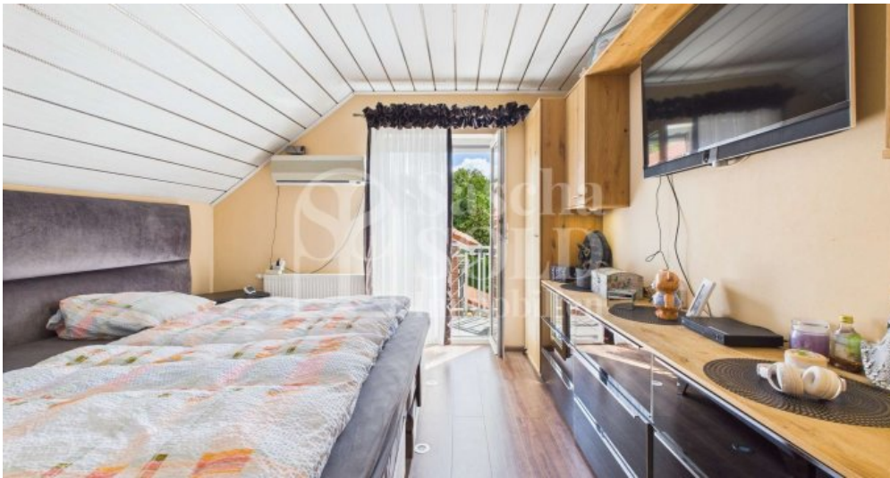
DG - Schlafzimmer