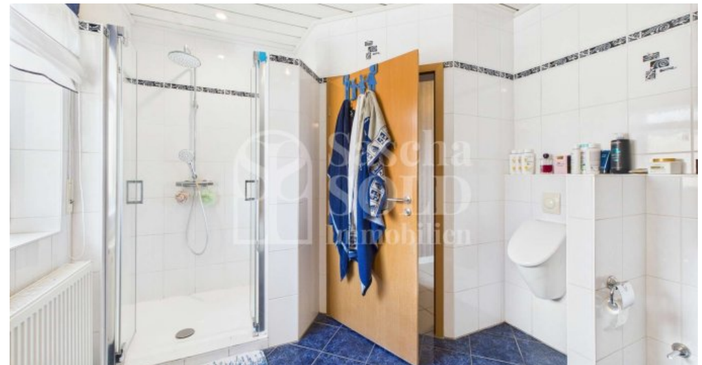
DG - Badezimmer