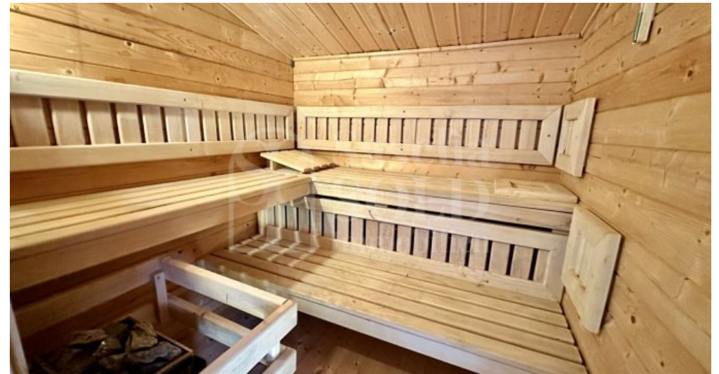
Außenanlagen - Sauna