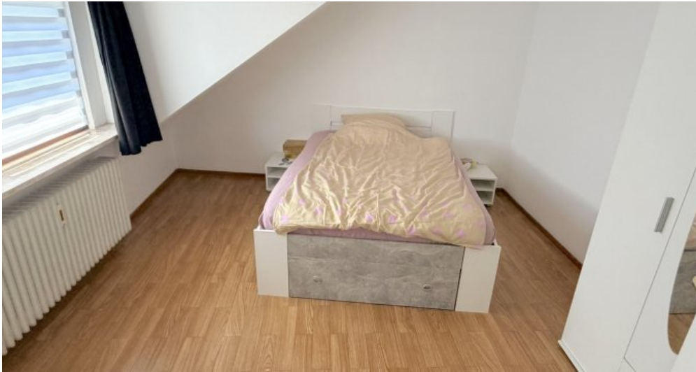
Schlafen 4 DG