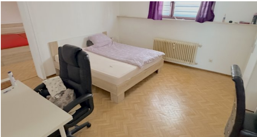
Schlafen 1 DG