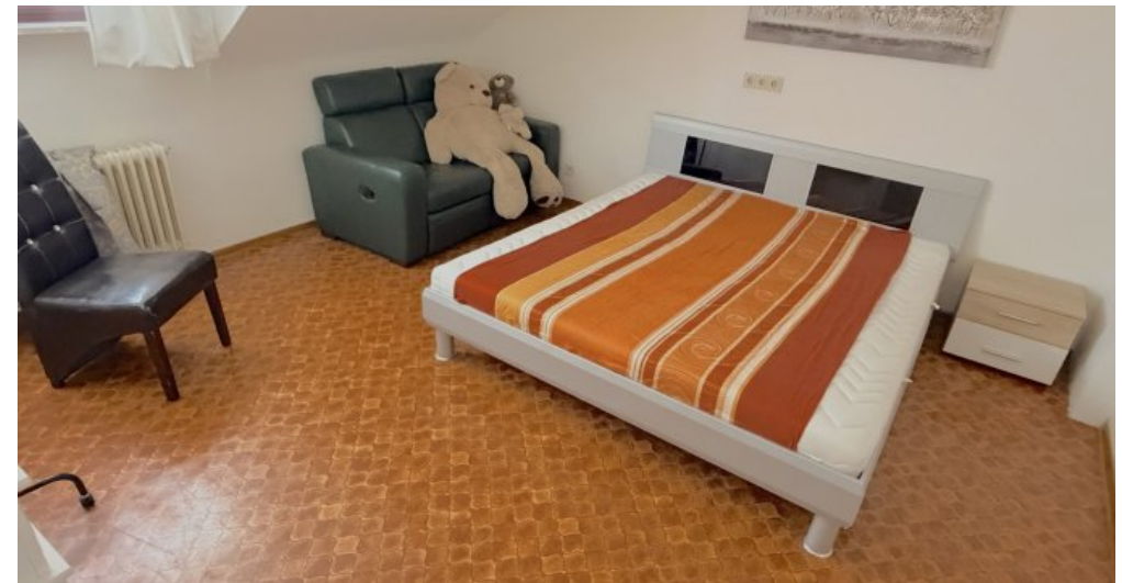
Schlafen 3 DG