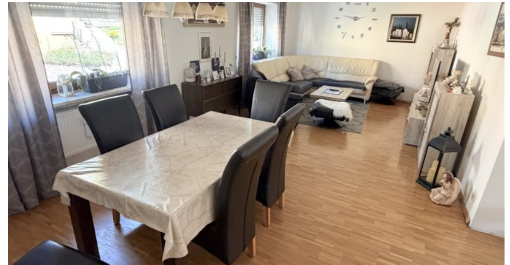
Wohn Esszimmer OG