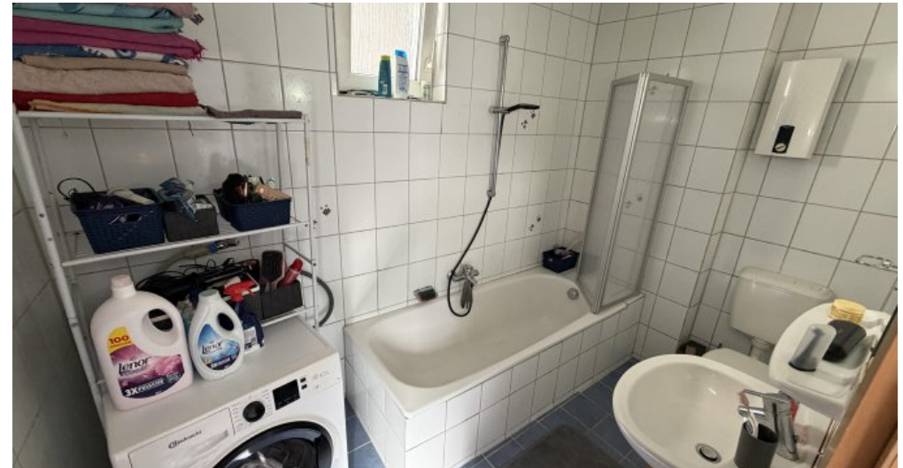
EG Rechts Bad WC