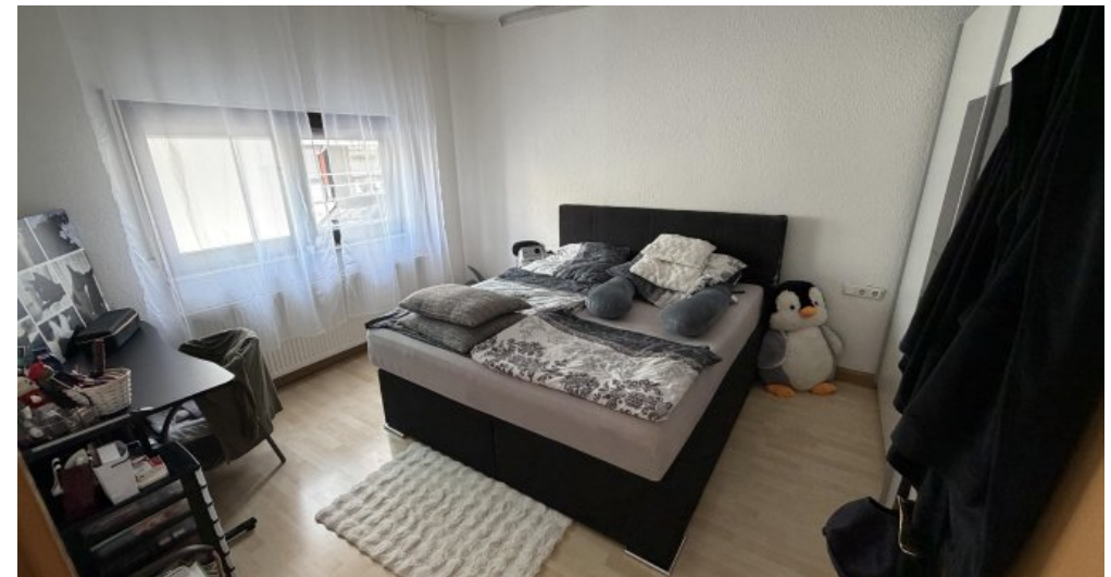
EG Rechts Schlafzimmer 1