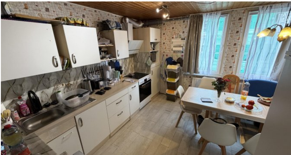
3. OG Küche