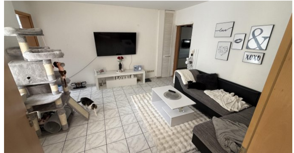
EG Rechts Wohnzimmer