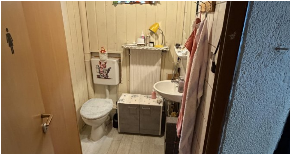
3. OG Toilette