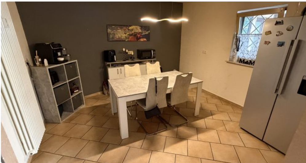
EG Rechts Eßzimmer