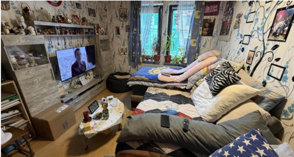
3. OG Wohnzimmer