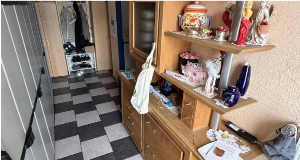
3. OG Flur 1