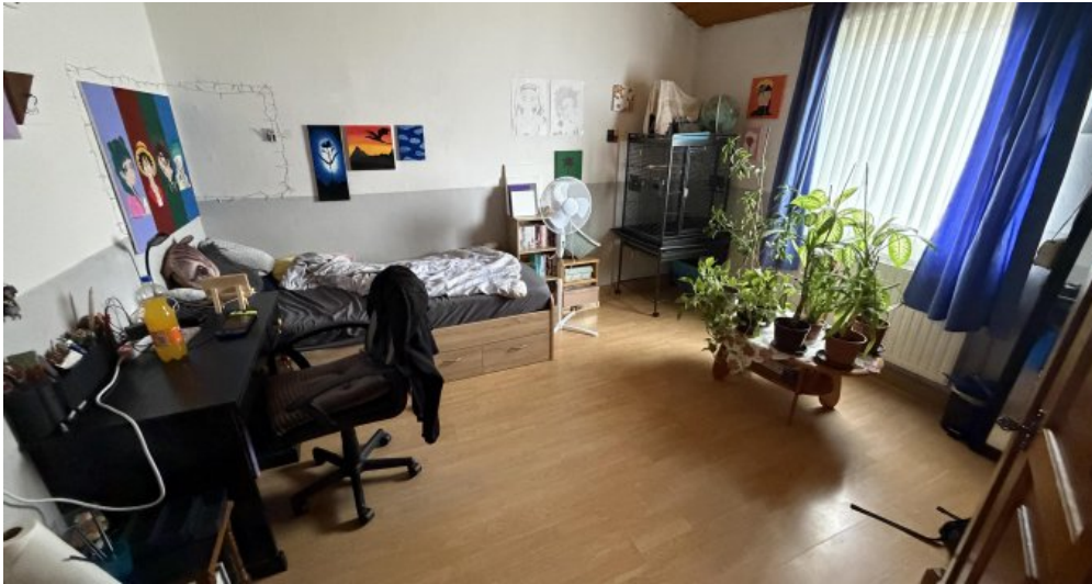
3. OG Kinderzimmer 1