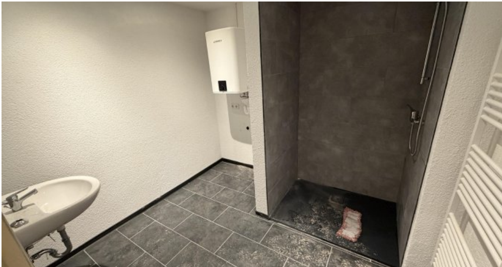
EG Links Bad Dusche