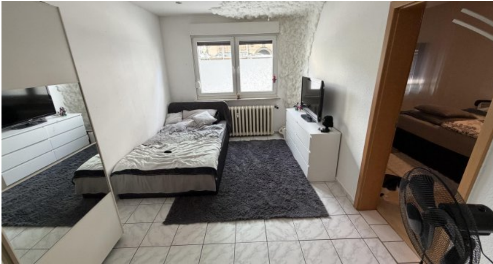
EG Rechts Schlafzimmer 2