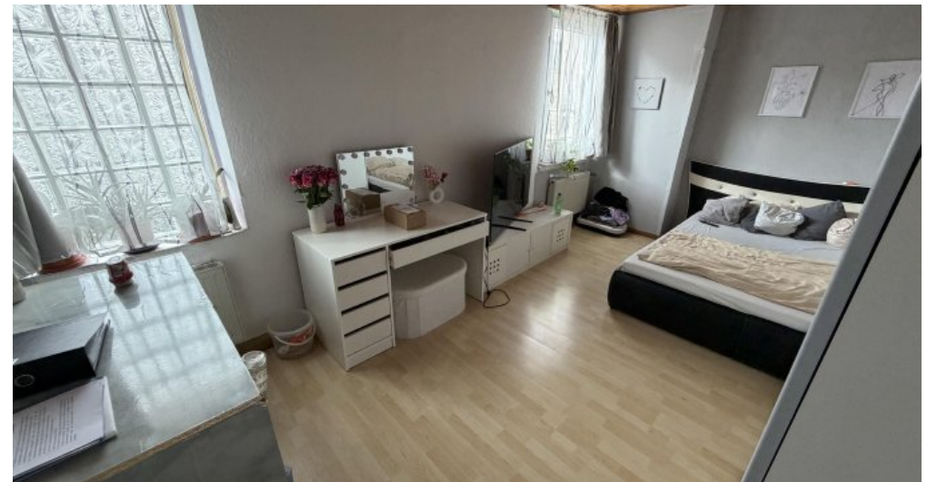
3. OG Schlafzimmer 2