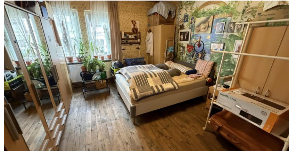
3. OG Elternzimmer