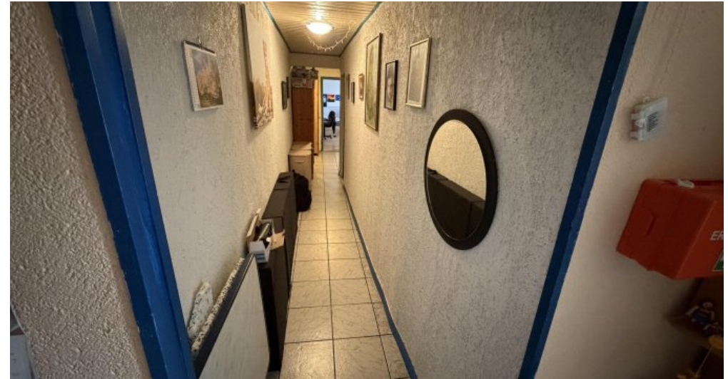
3. OG Flur 2