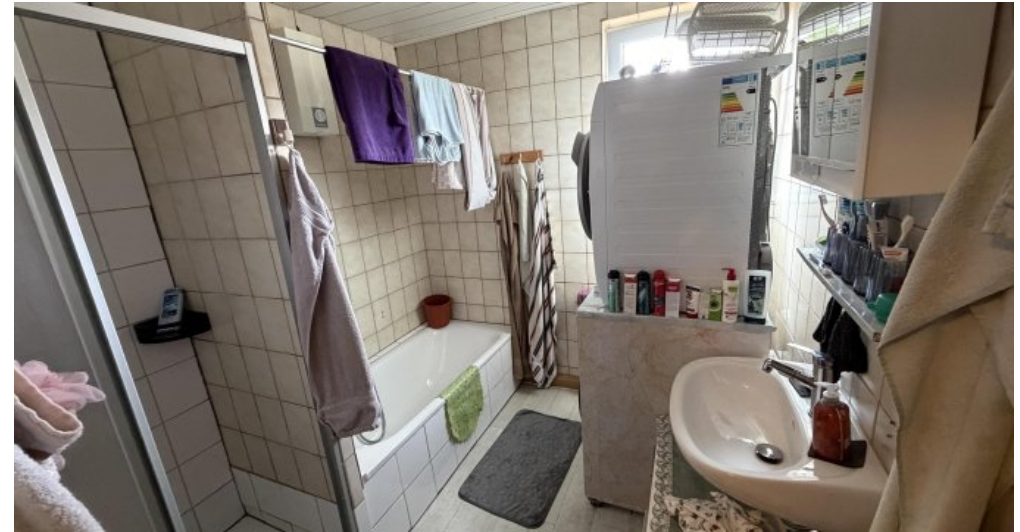
3. OG Bad Dusche