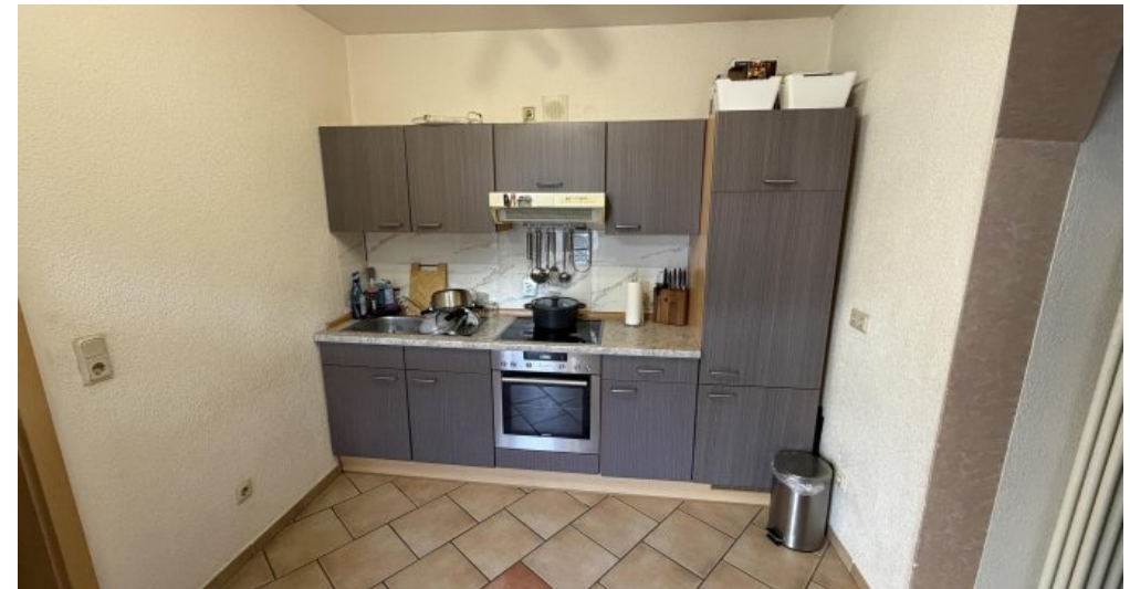
EG Rechts Küche