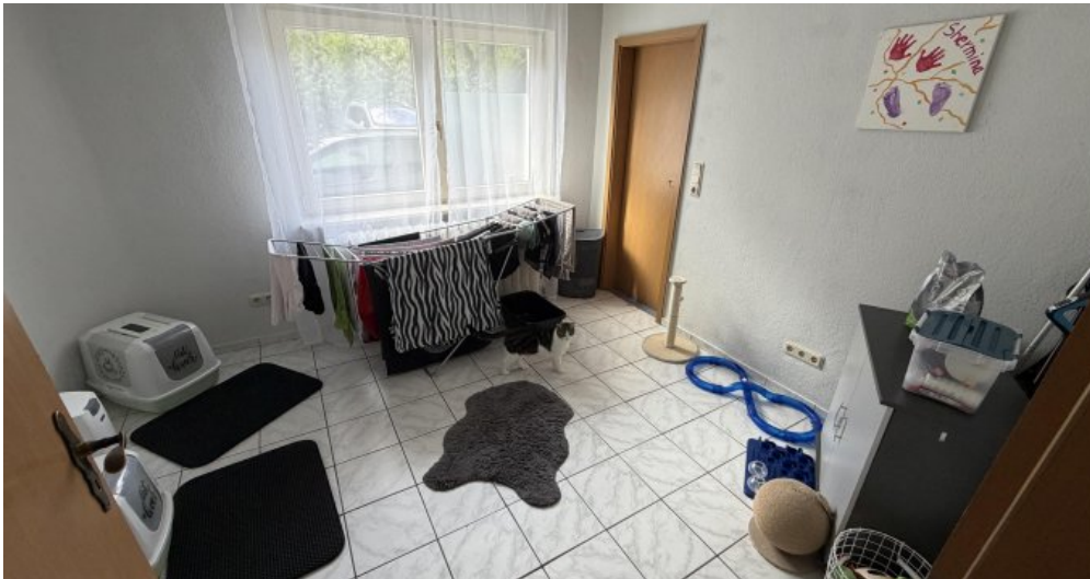
EG Rechts Büro