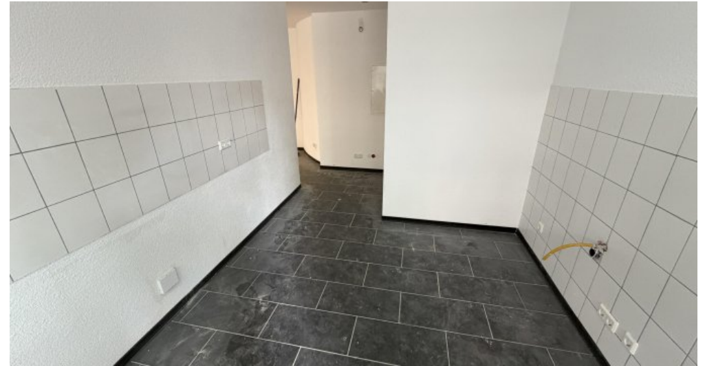
EG Links Küche