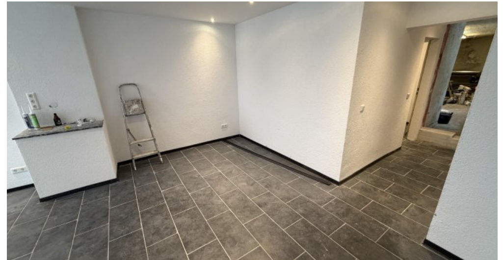
EG Links Schlafeccke