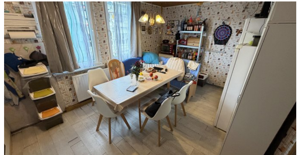
3. OG Eßecke