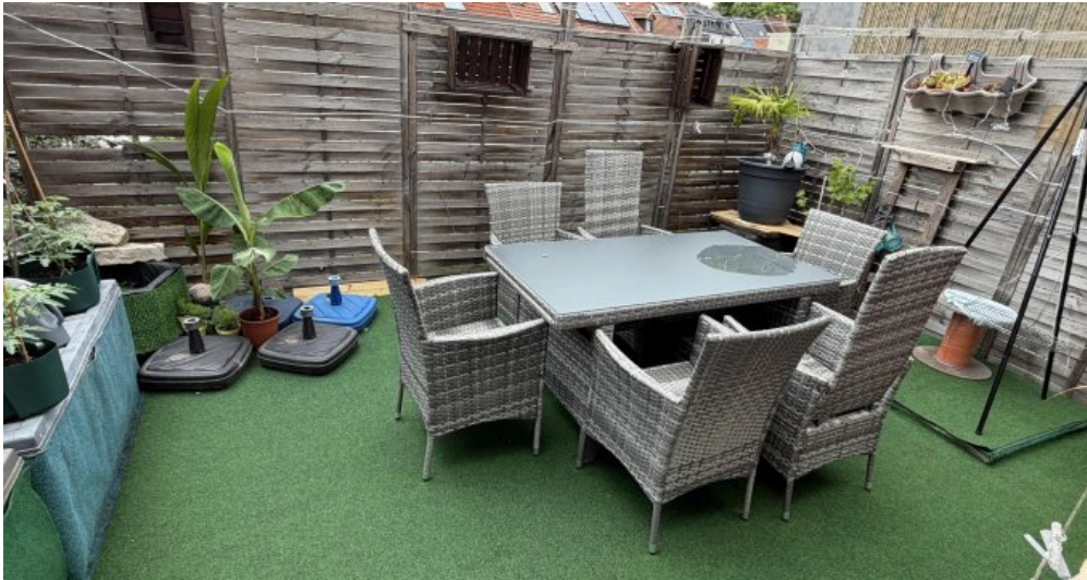
3. OG Terrasse