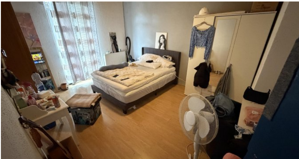
3. OG Schlafzimmer 1