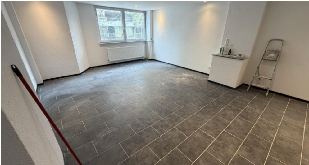
EG Links Wohn Eßzimmer