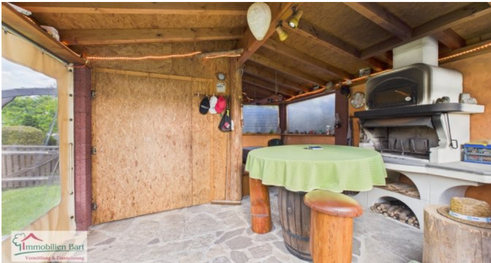
Gartenhaus mit Pizzaofen