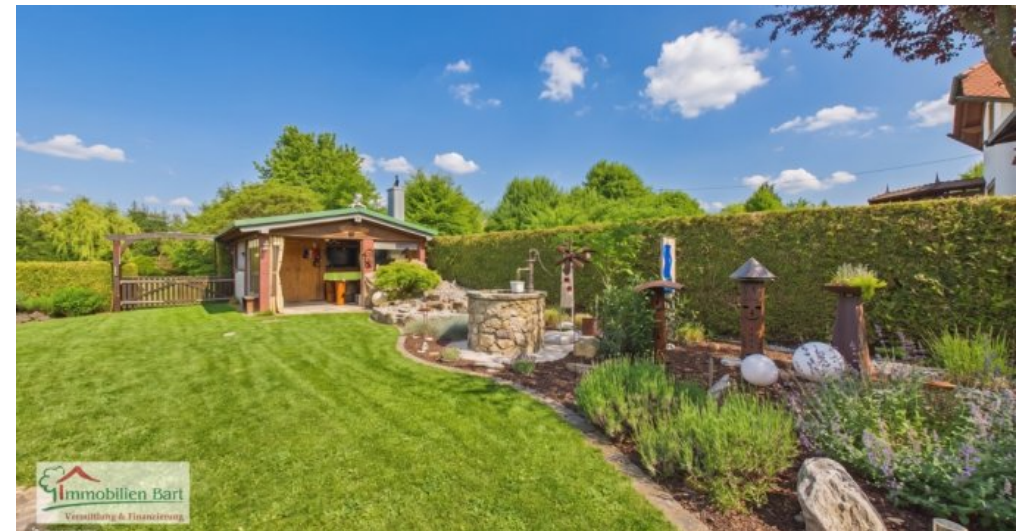
Garten mit Gartenhaus