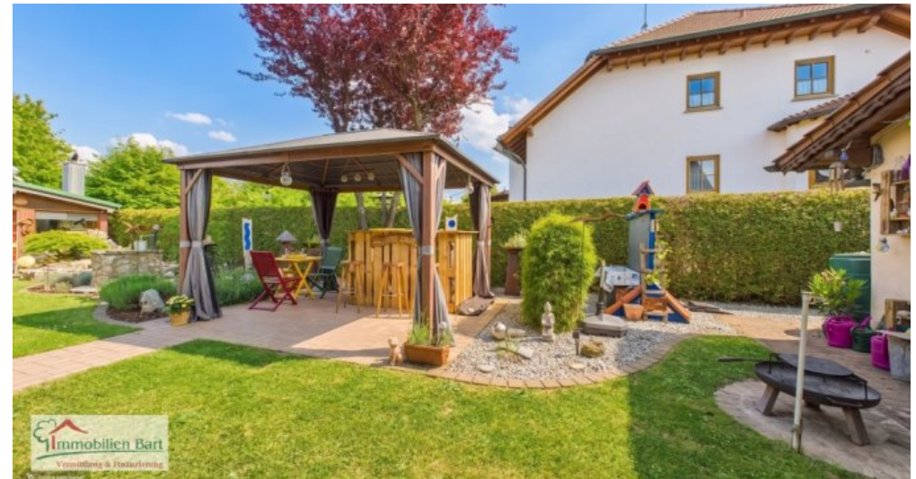
Garten mit Pavillon