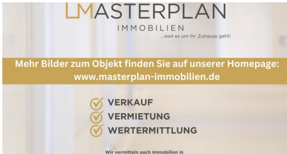
Kopie von Mehr Bilder auf Website