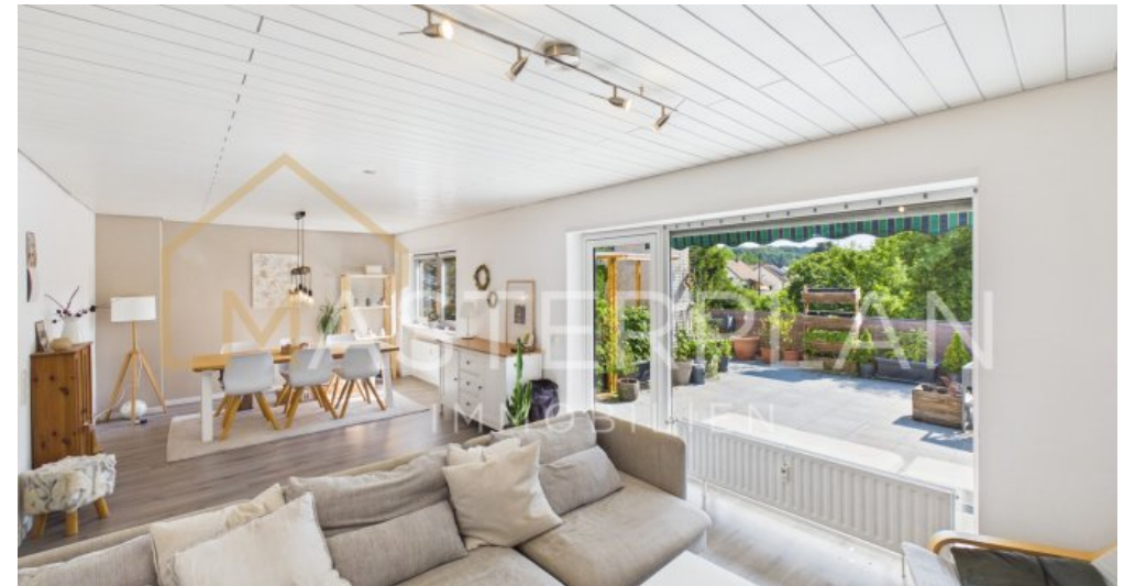
Wohn- und Esszimmer OG