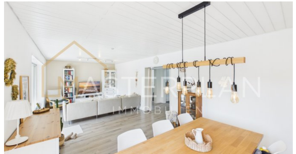
Wohn- und Esszimmer OG