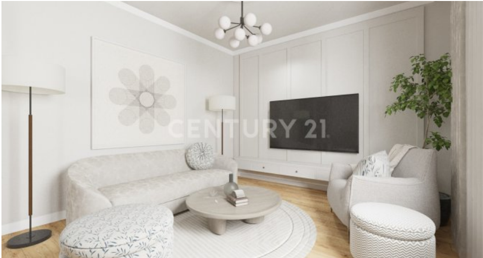
Wohnzimmer OG Visualisiert