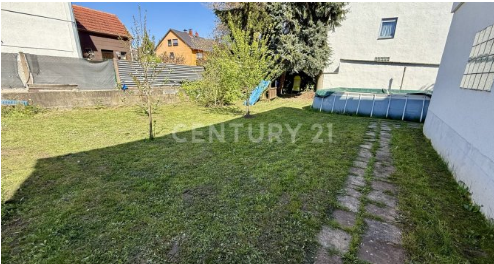
großer Garten mit Pool