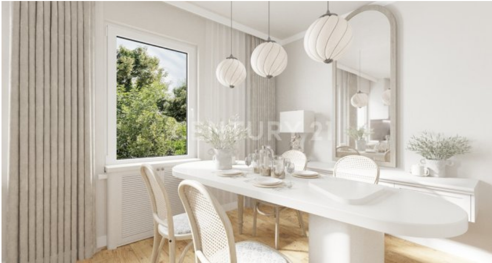
Ku?che OG visualisiert