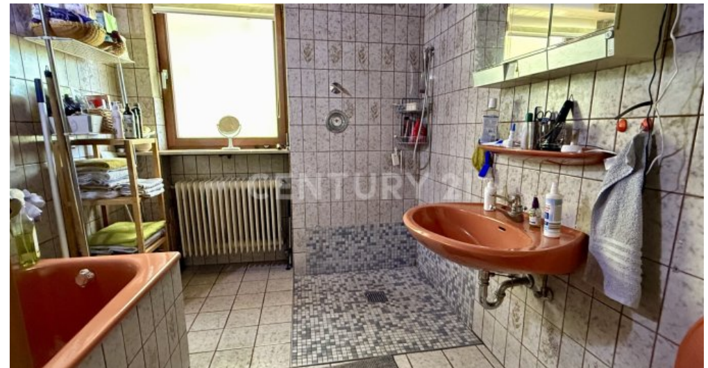
Badezimmer mit Wanne EG