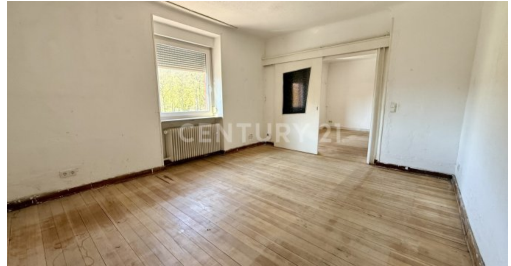
1. Schlafzimmer OG / Wohnzimmer