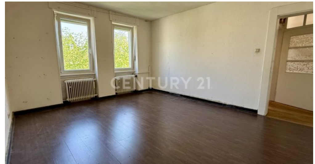
2. Schlafzimmer OG