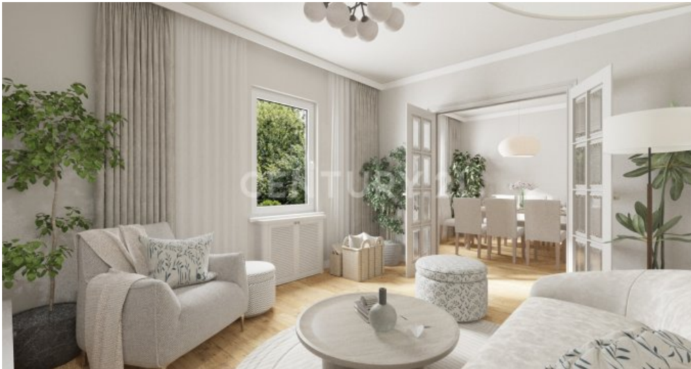
Wohnzimmer OG visualisiert