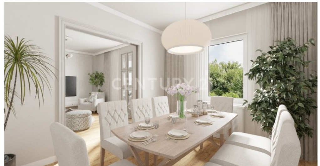
Esszimmer OG visualisiert