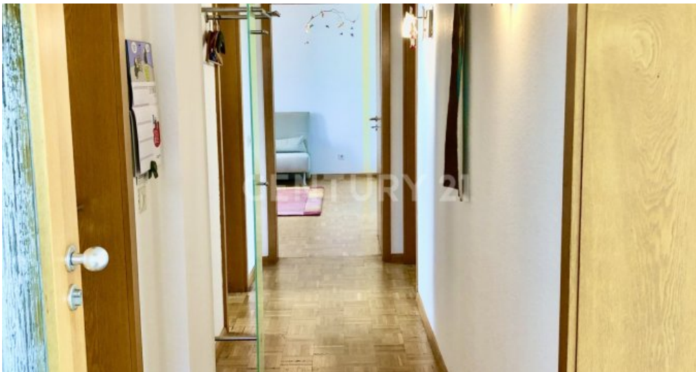
Flur - 1. OG