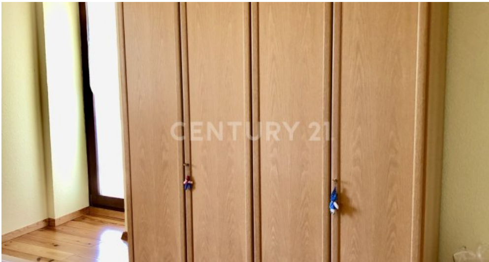
Zimmer - 1. OG mit Zugang zum Balkon