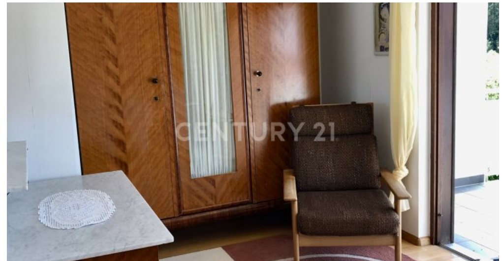
Zimmer - 2. OG mit Zugang zum Balkon