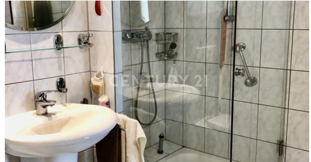
Bad - EG