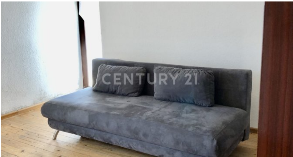
Zimmer - 2. OG mit Zugang zum Balkon