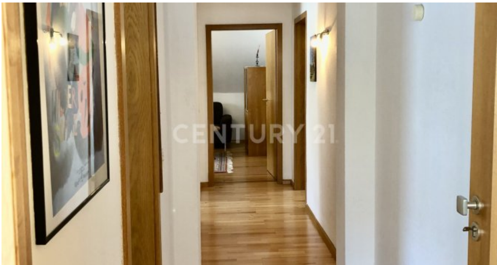
Flur - 2. OG