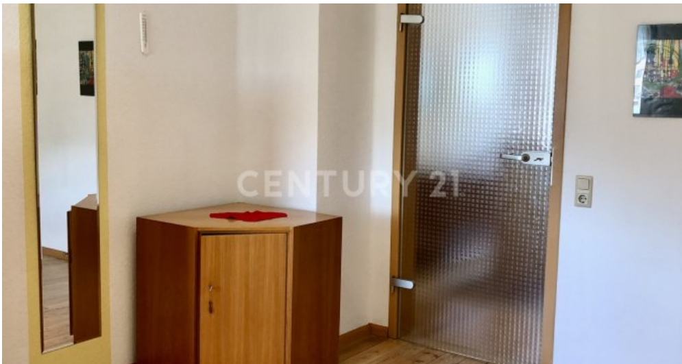
Zimmer - 2. OG