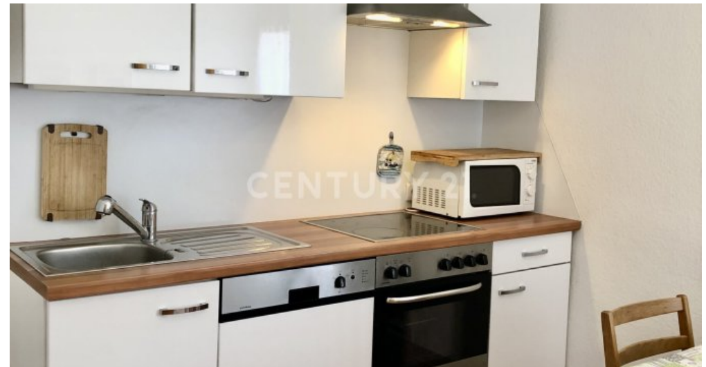
Küche mit Esszimmer - 2. OG