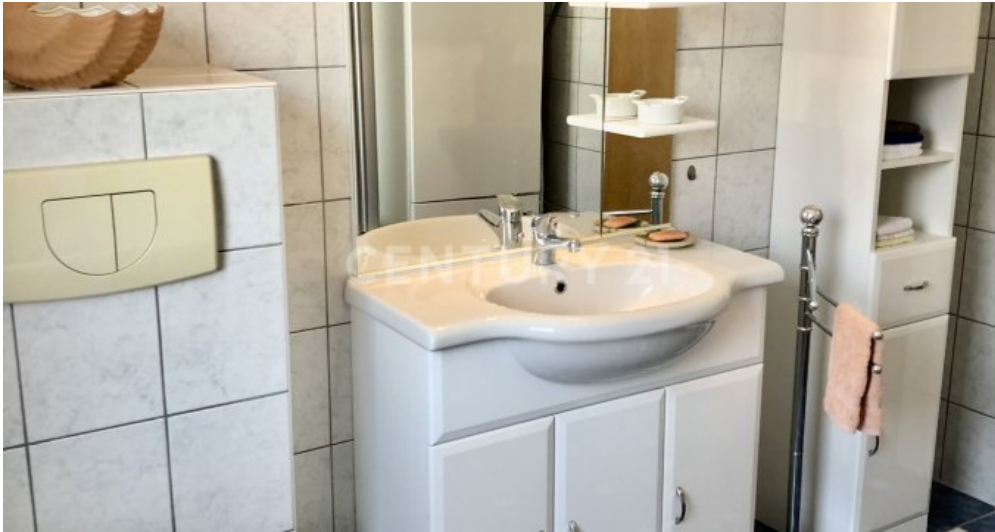
Bad - 2. OG