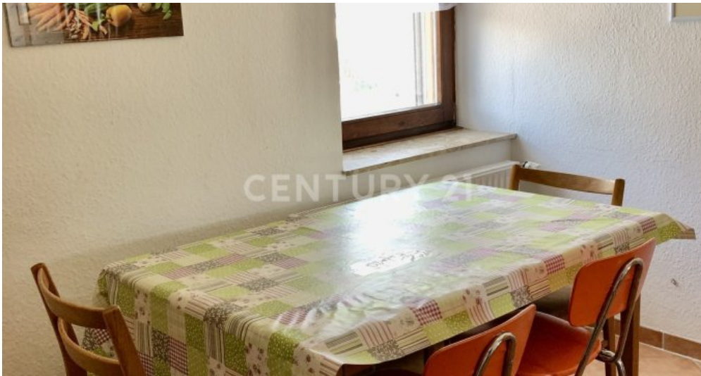
Küche mit Esszimmer - 2. OG