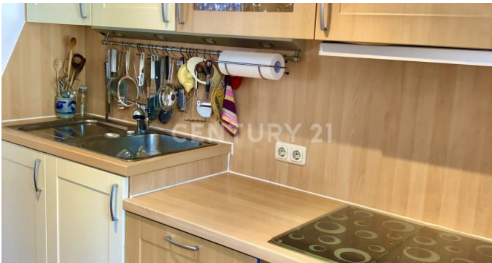
Küche - 1. OG