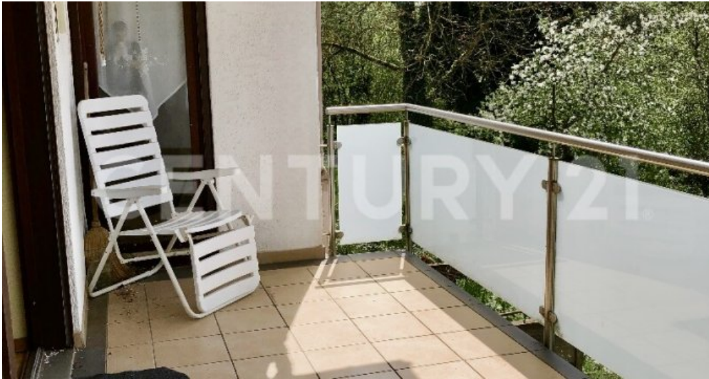
Balkon mit elek. Markise - 1. OG