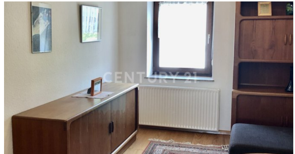
Wohnzimmer - 2. OG