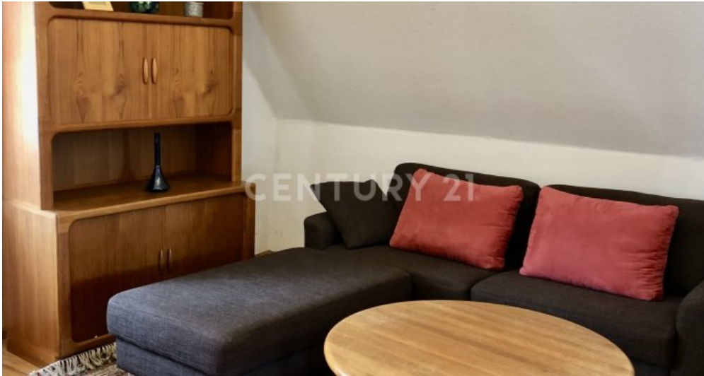
Wohnzimmer - 2. OG