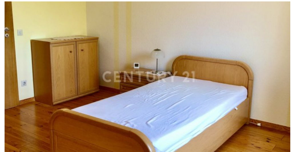
Zimmer - 1. OG mit Zugang zum Balkon