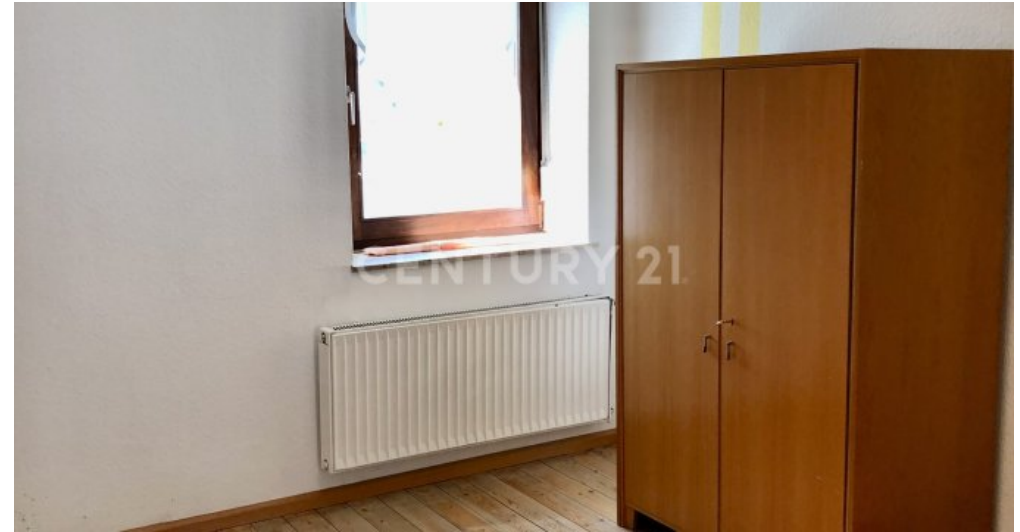
Zimmer - 2. OG