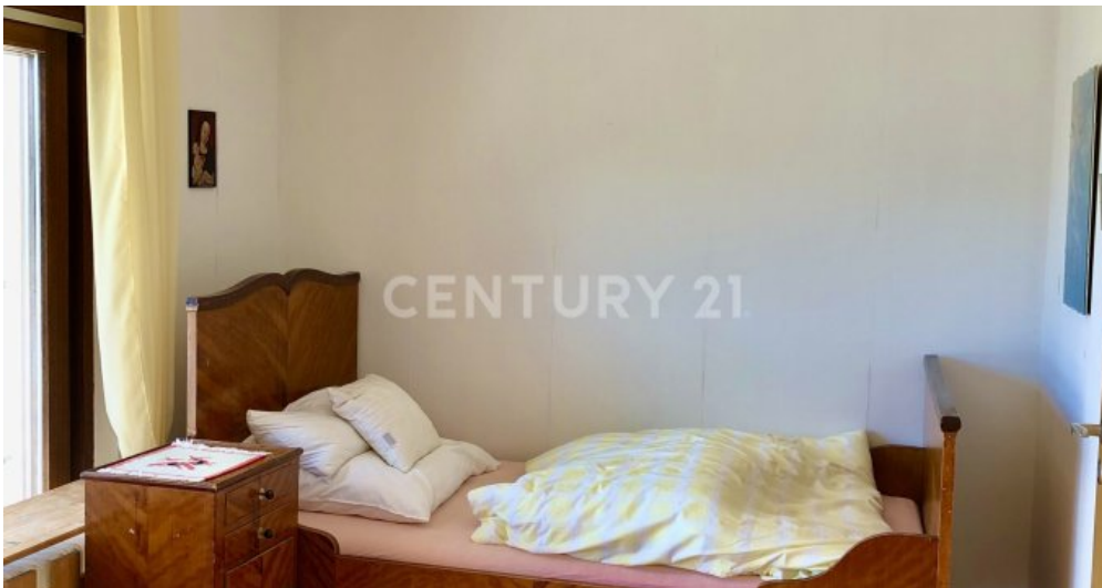
Zimmer - 2.OG mit Zugang zum Blakon