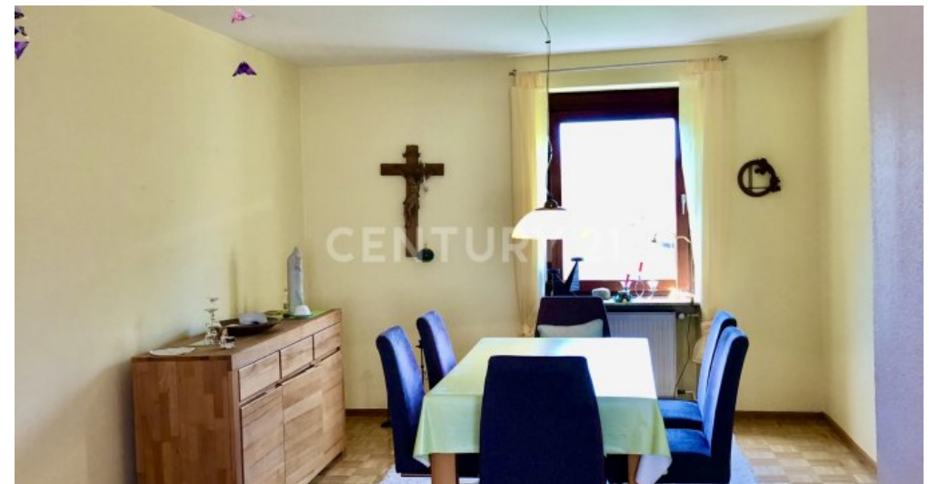
Esszimmer - 1. OG