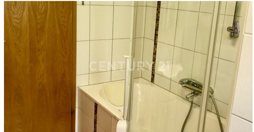
Bad - 1. OG