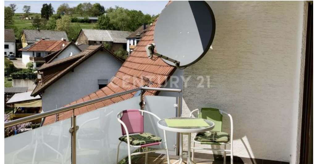
Balkon - 2. OG