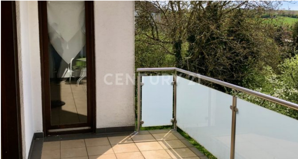
Balkon - 2. OG