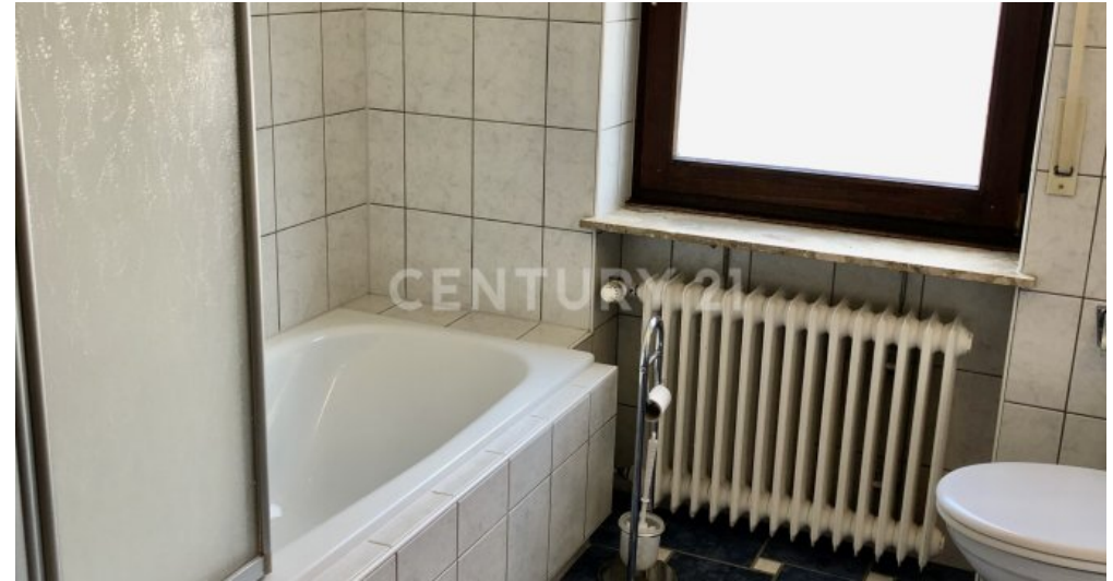
Bad - 2. OG