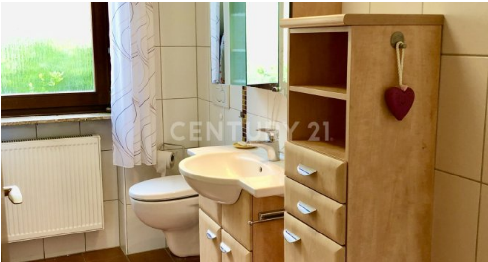
Bad - 1. OG