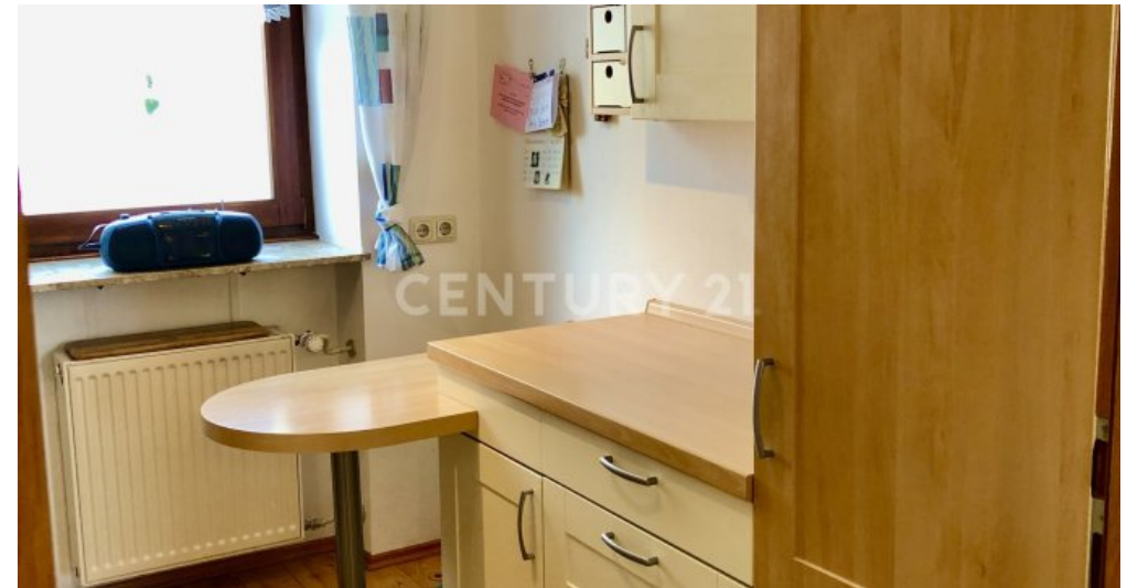
Küche - 1. OG