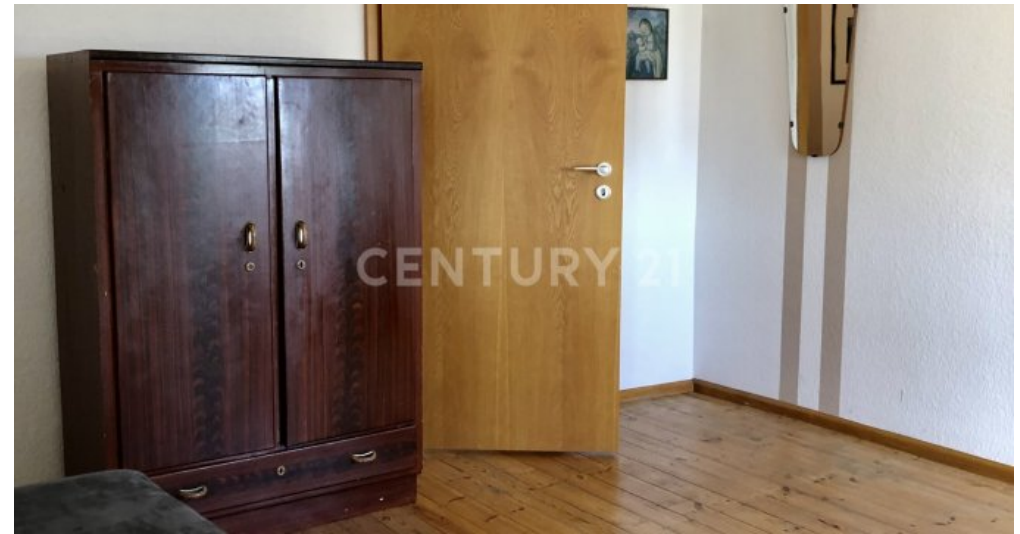
Zimmer - 2. OG mit Zugang zum Balkon