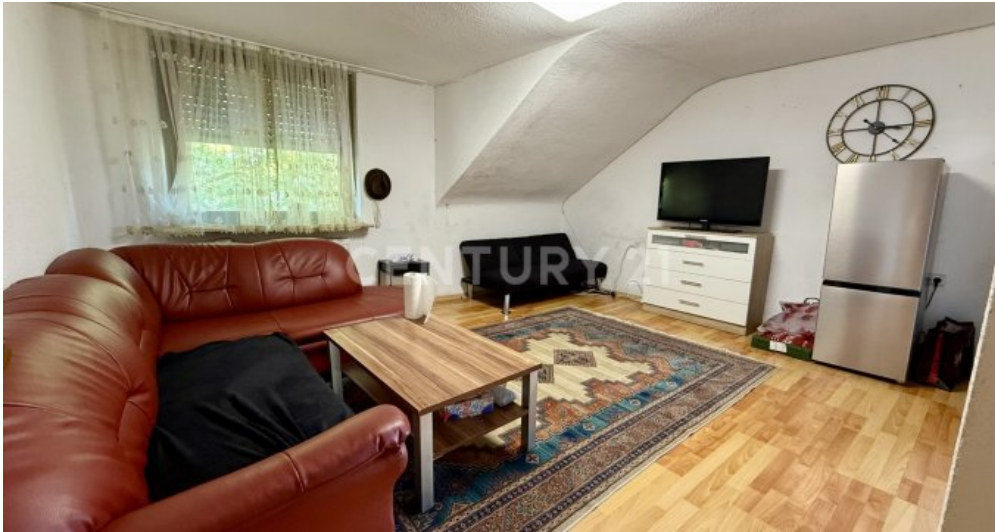
offenes Wohnzimmer zur Küche