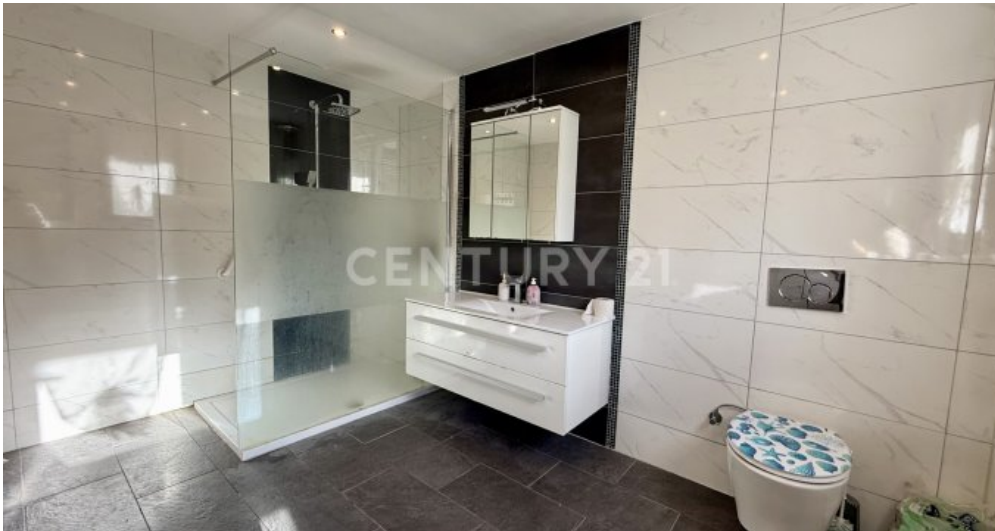
Tageslichtbad mit ebenerdiger Dusche