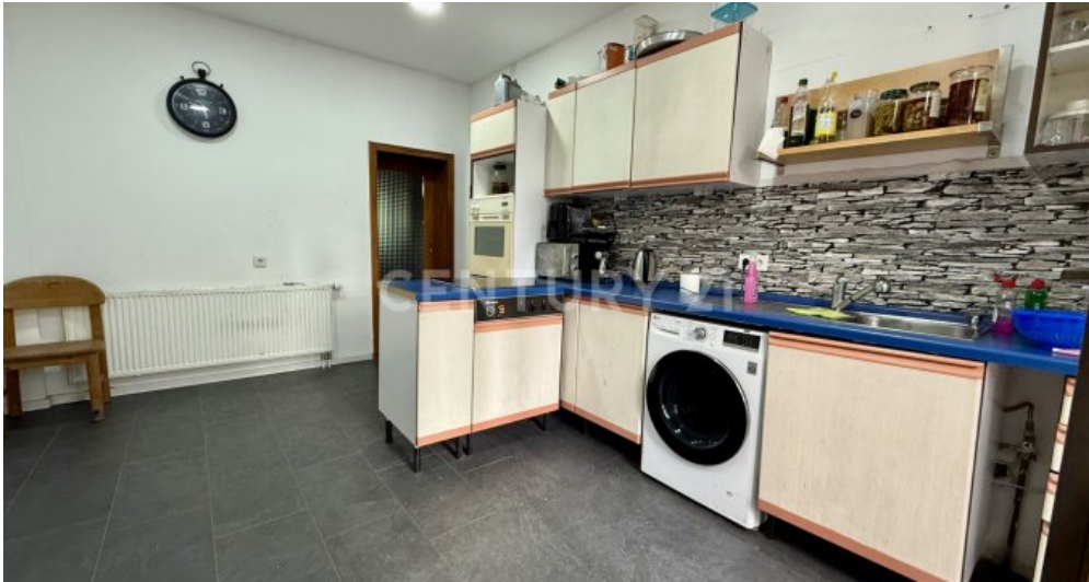
Küche mit Ausgang zur Terrasse