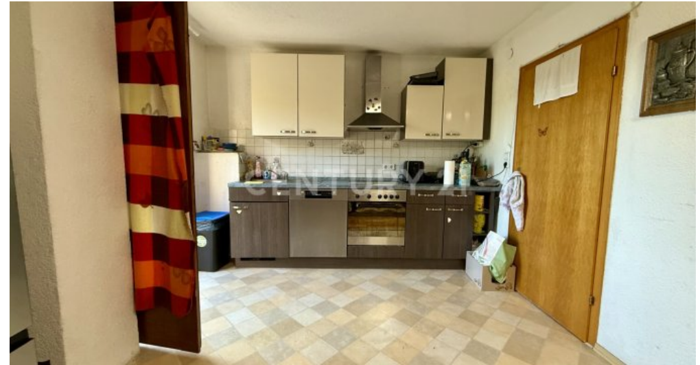
Küche mit Ausgang zum Balkon im OG