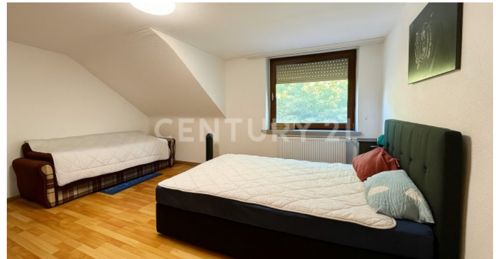
Schlafzimmer im OG