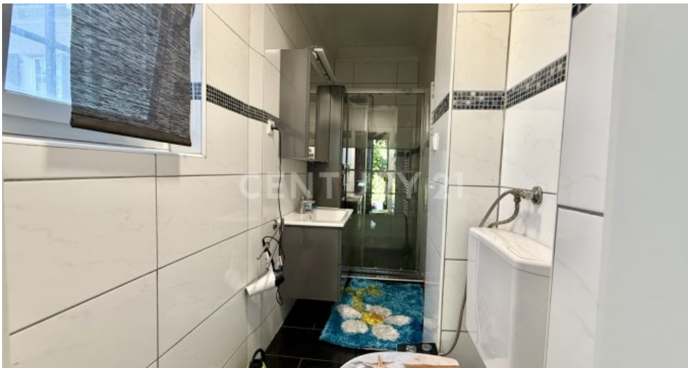
Tageslichtbad im EG