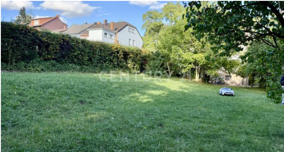
großer umzäunter Garten