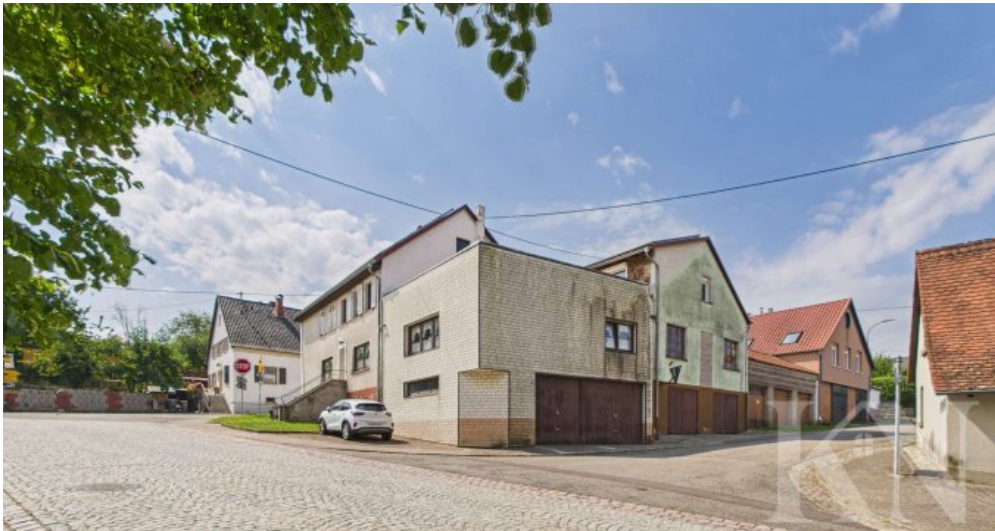
Seitenansicht / Garagen