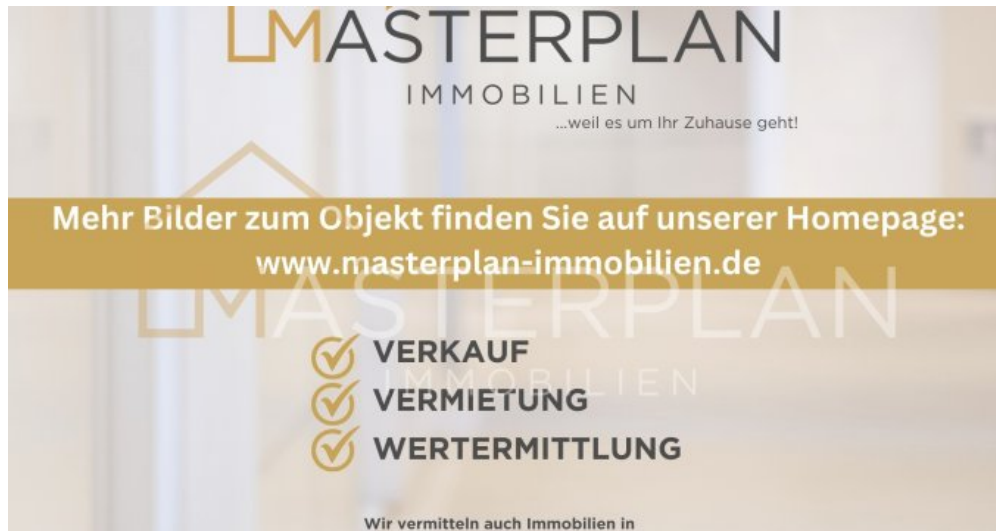
Mehr Bilder auf Website Kopie