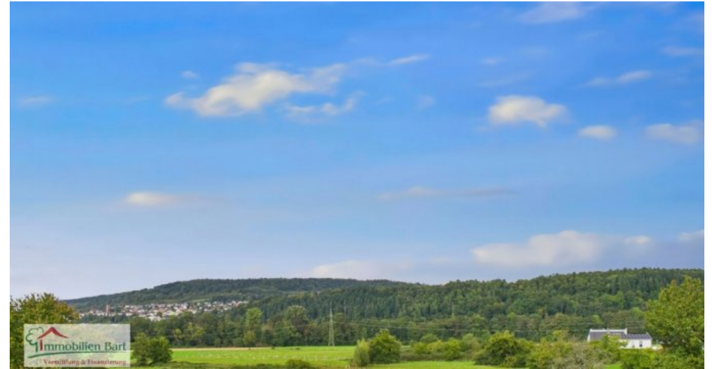
Weitblick ins Grüne