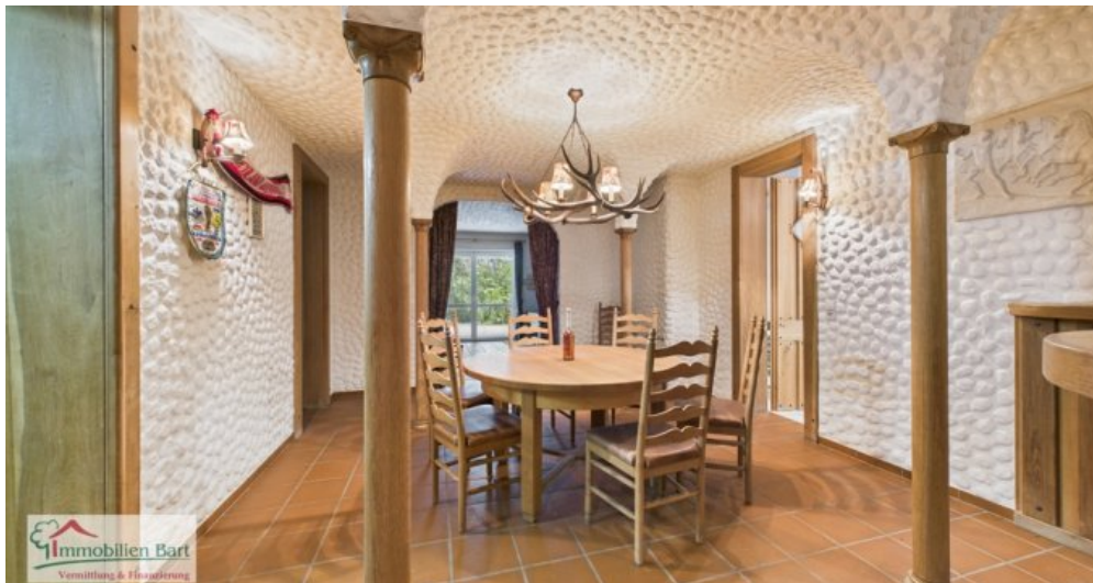
Lounge im 2. UG