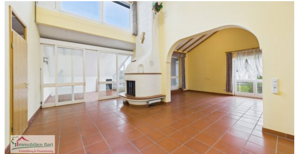
Wohnbereich Whg im DG