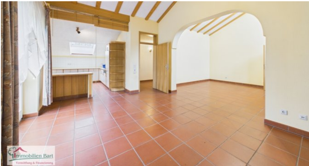
Essbereich Whg im DG