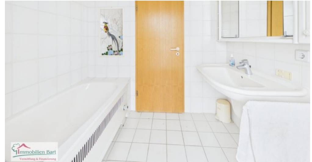
Badezimmer Whg im DG