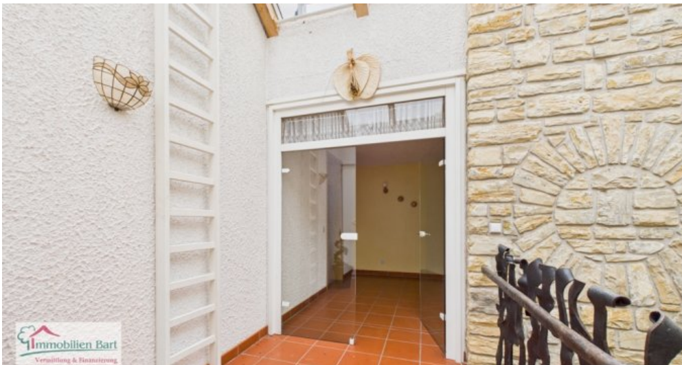
Treppenhaus Whg im DG