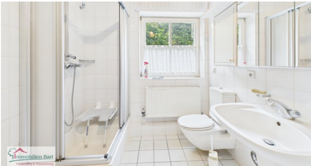
Badezimmer 1. Whg im 1. UG