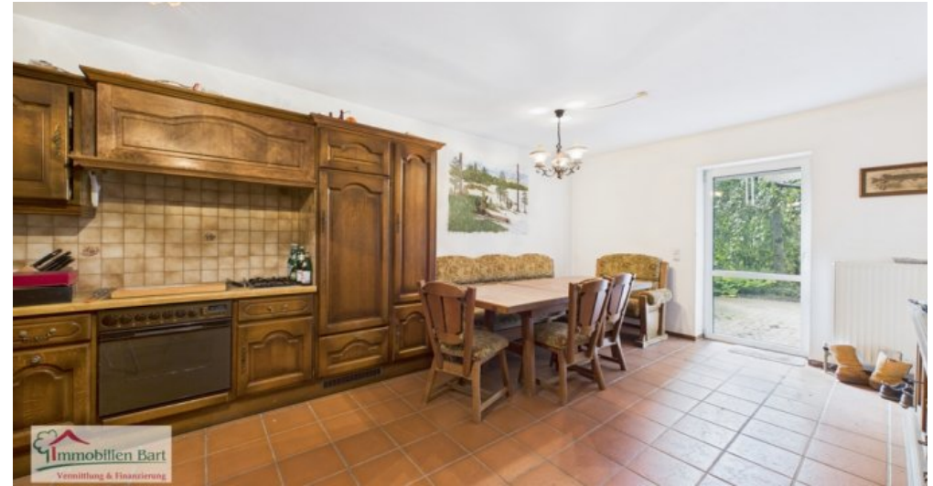
Küche im 2. UG