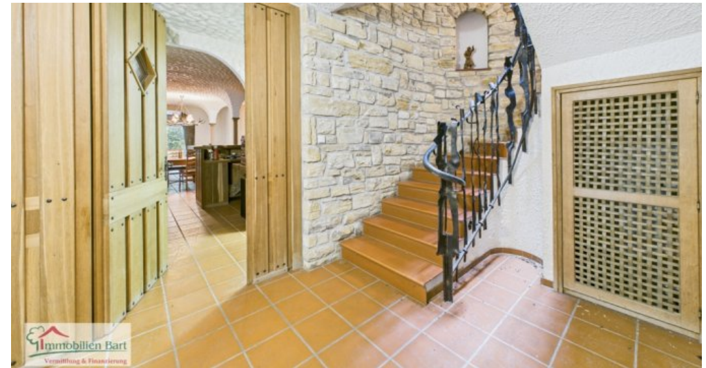
Treppenhaus im 2. UG