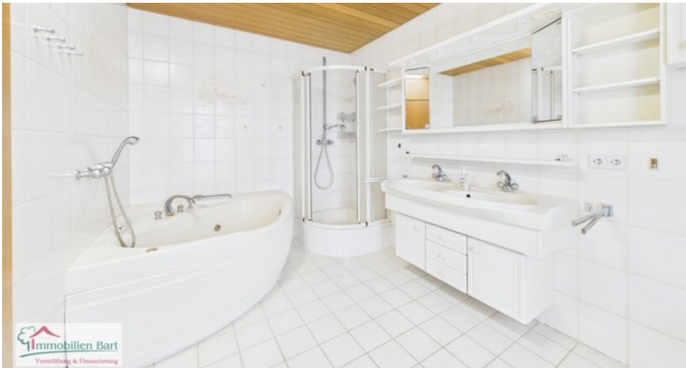
Badezimmer Whg im EG