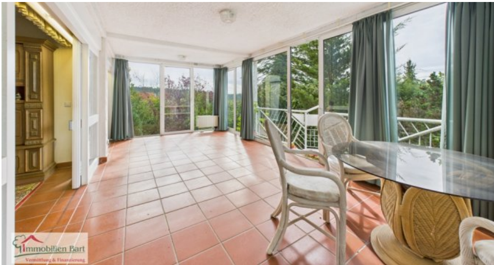
Wintergarten im 1. UG