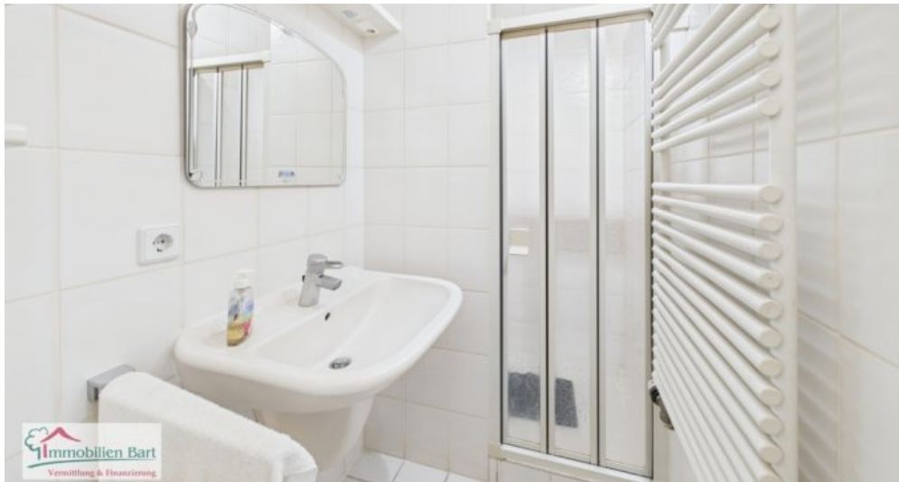
Badezimmer 2. Whg im 1. UG