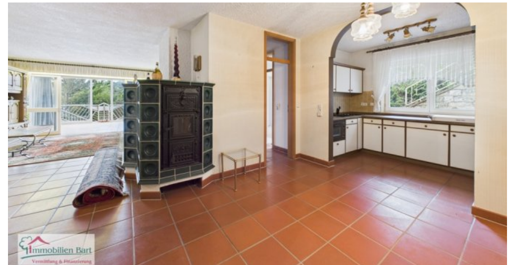
Essbereich 1. Whg im 1. UG