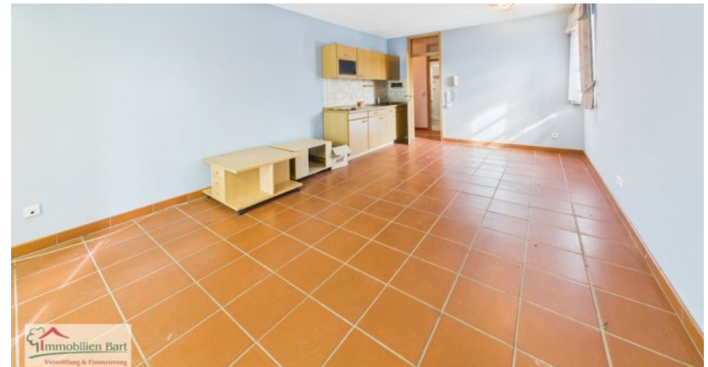
Wohnbereich 2. Whg im 1. UG