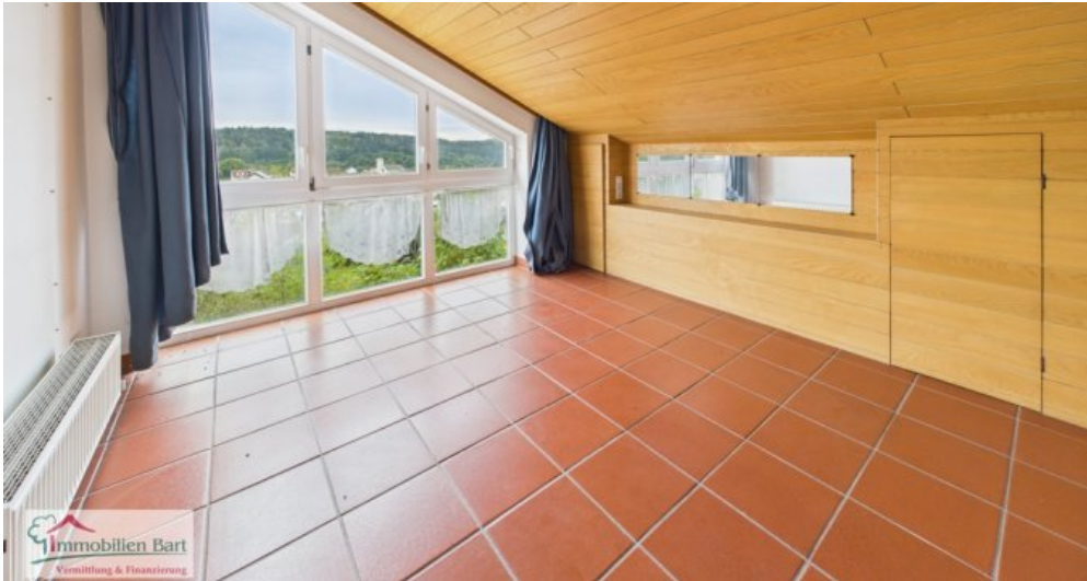
Schlafzimmer Whg im DG