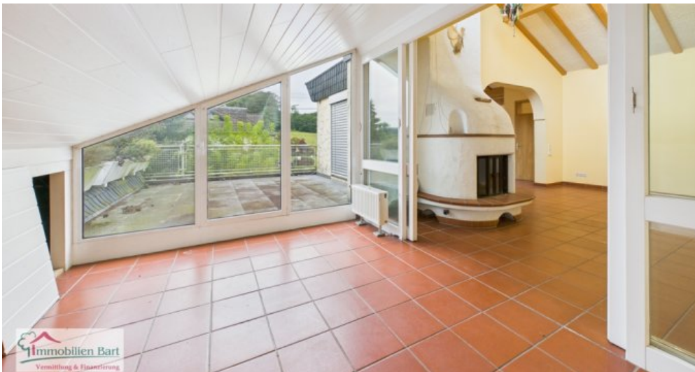
Wintergarten Whg im DG