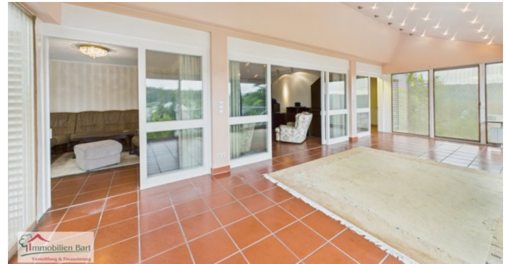
Wintergarten Whg im EG