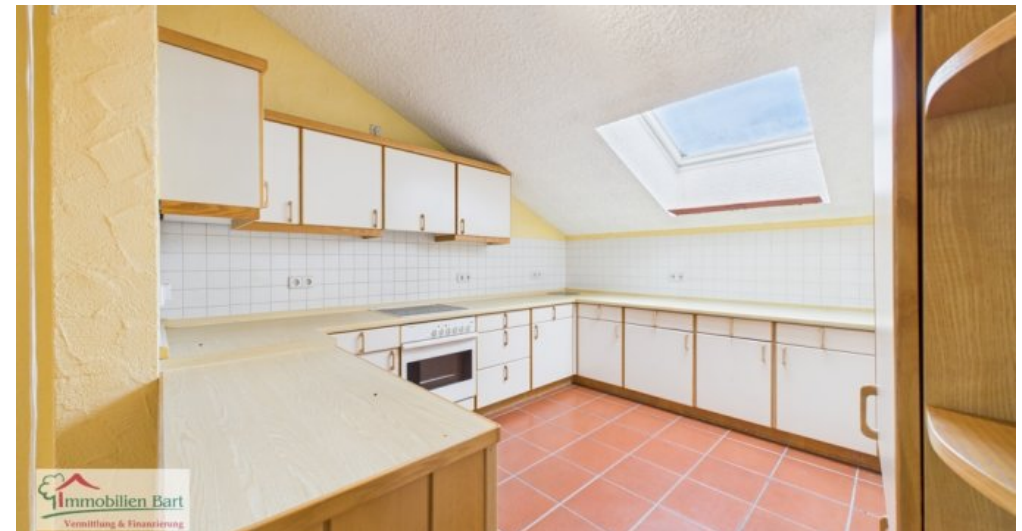
Küche Whg im DG