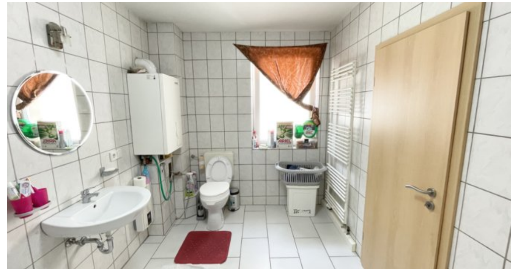
OG Whg 3