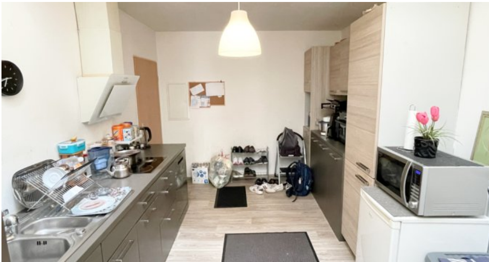
OG Whg 4