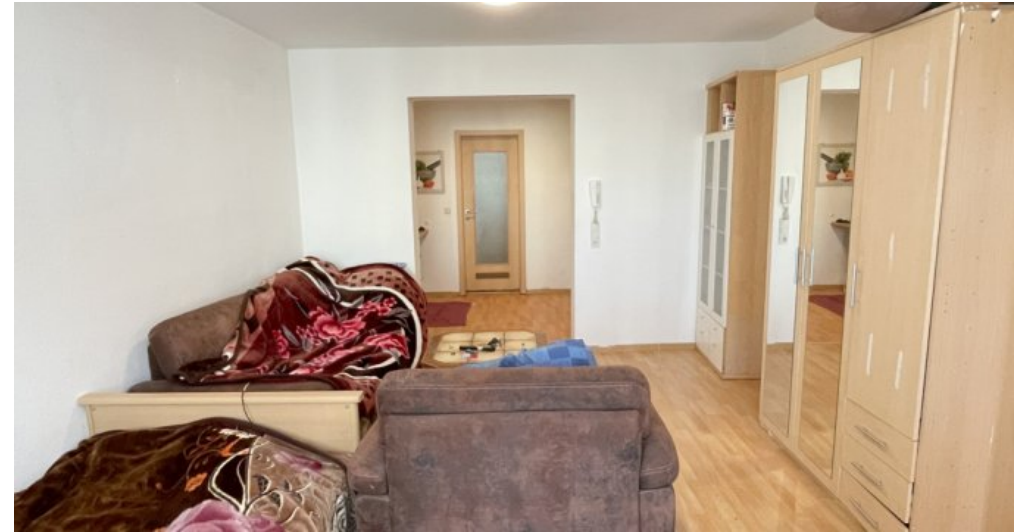
EG Whg 1