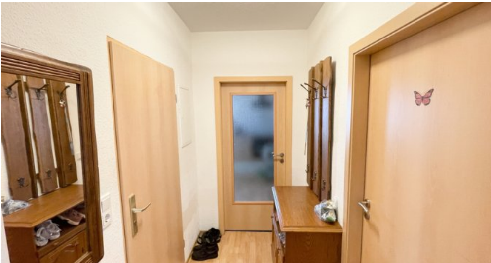
OG Whg 3