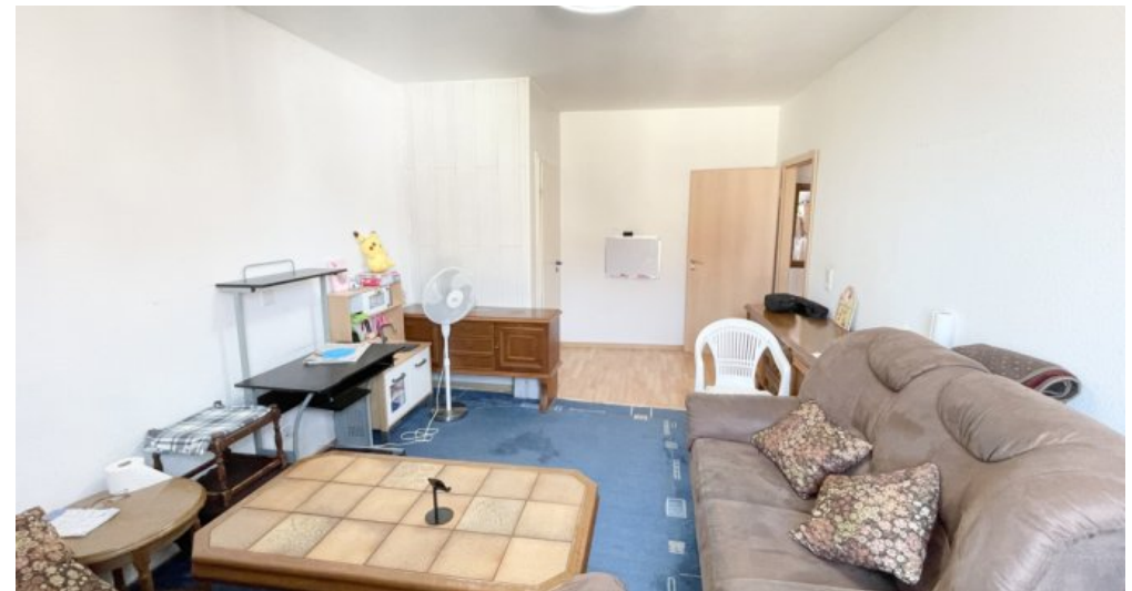
OG Whg 3