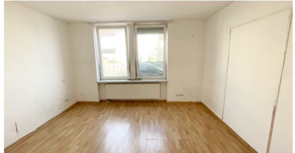
EG Whg 2