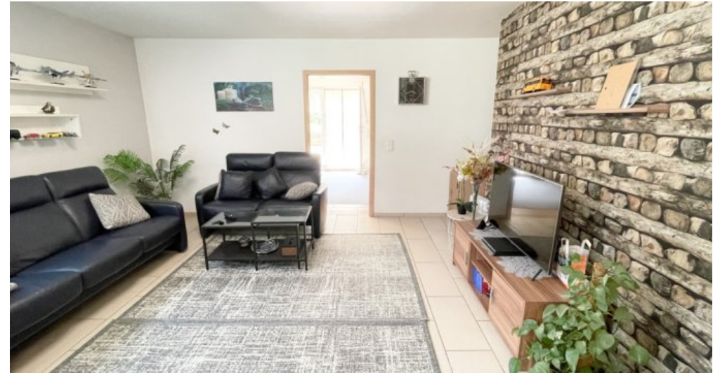
OG Whg 4