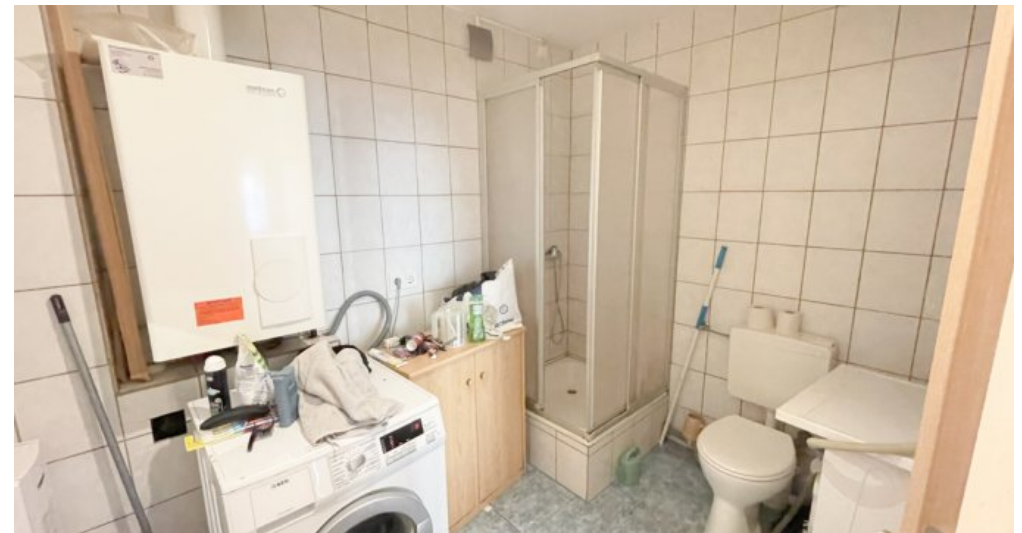
EG Whg 1