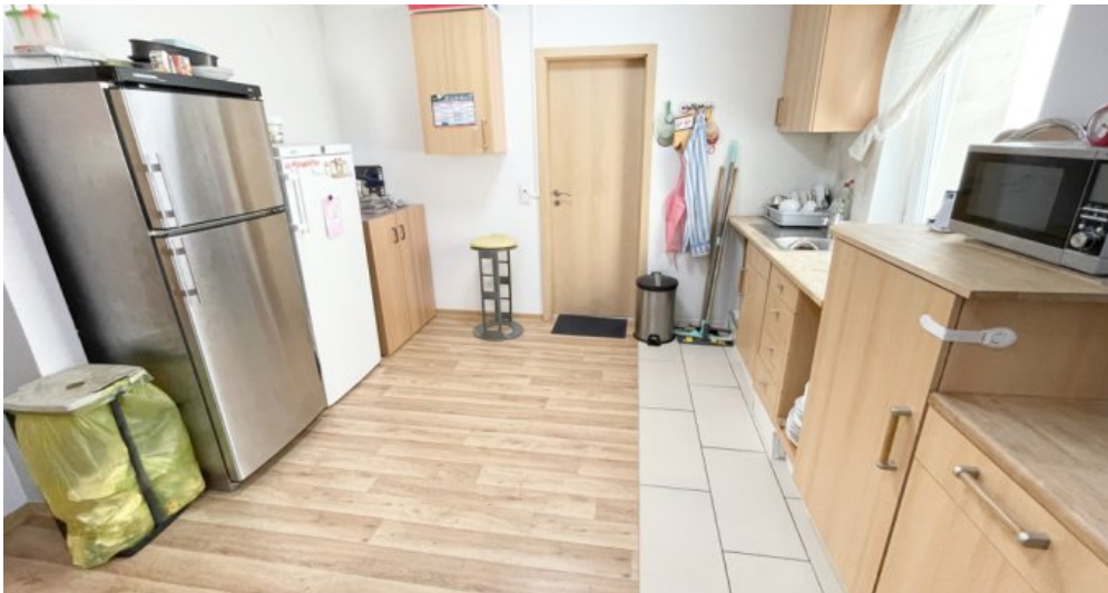
OG Whg 3