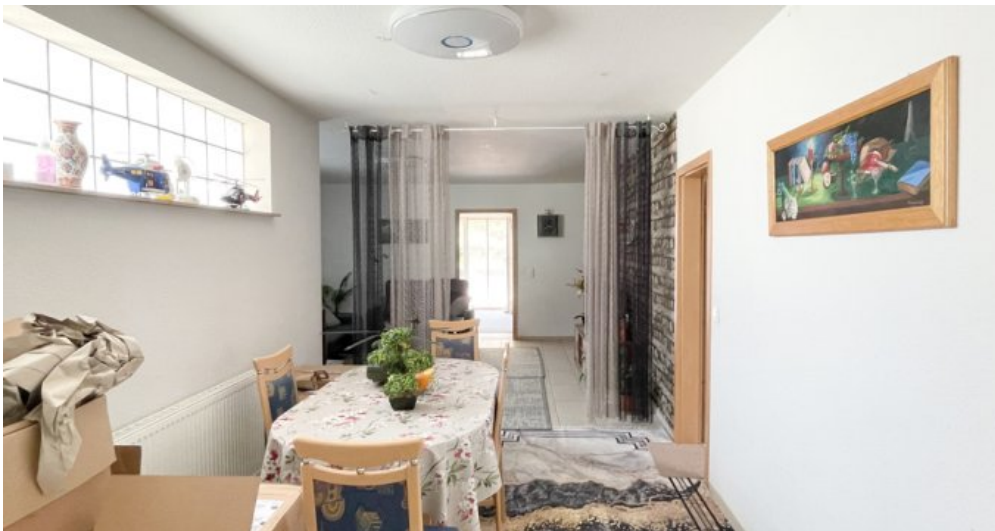
OG Whg 4