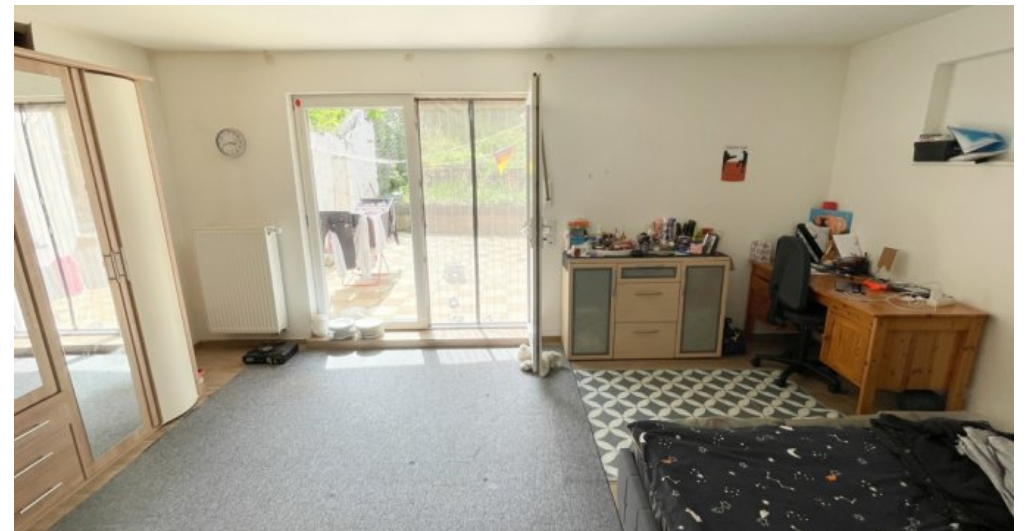
OG Whg 4