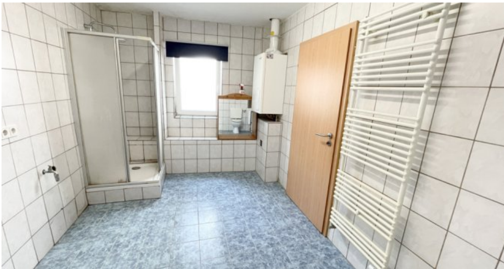
EG Whg 2