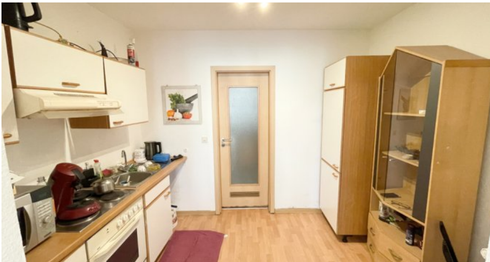
EG Whg 1