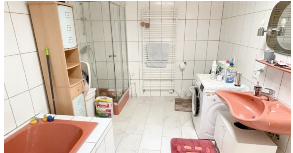
OG Whg 4