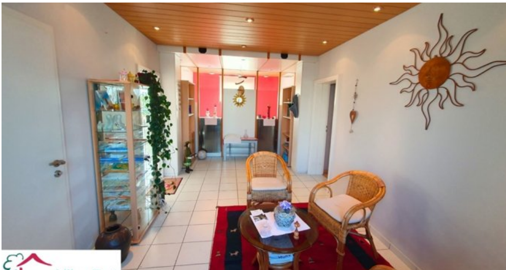
Wartezimmer Praxis EG