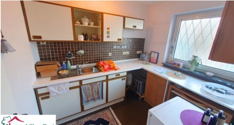
Küche Praxis EG