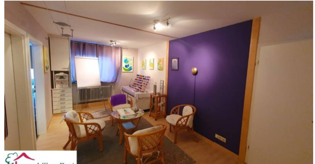
Wartezimmer Praxis EG