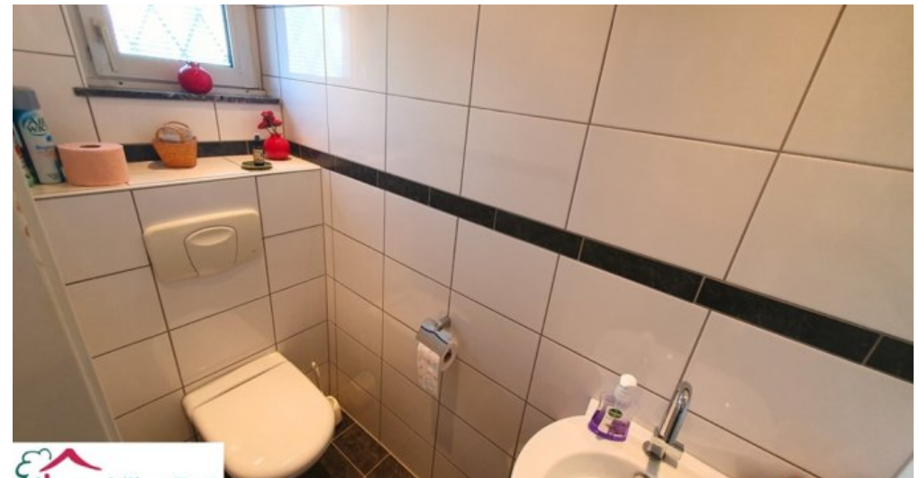
Gäste-WC Praxis EG