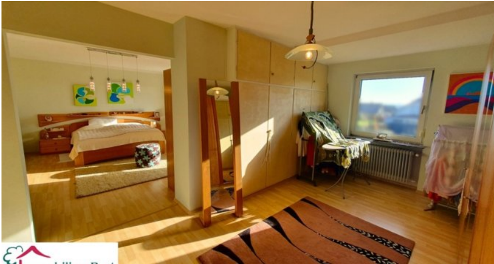
Schlafzimmer mit Ankleide OG