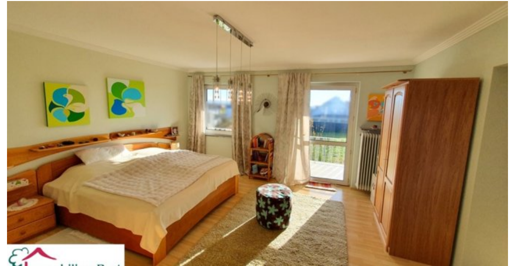
Schlafzimmer mit Ankleide OG