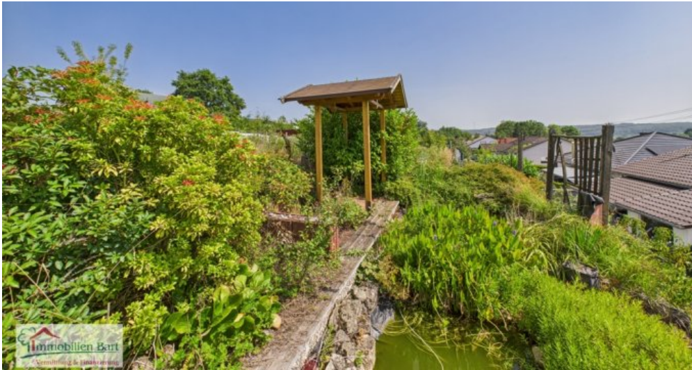
Garten mit Teich