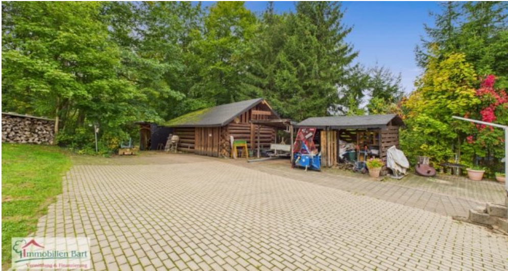
Gartenhaus mit Holzlager