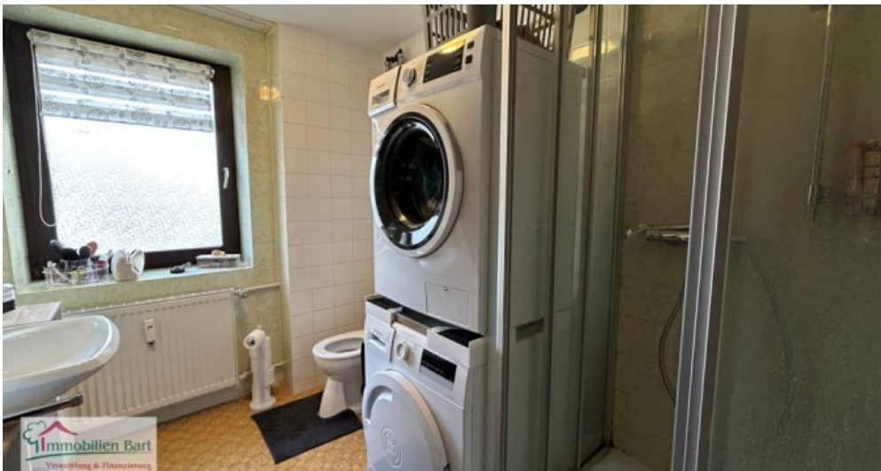
Badezimmer Whg 1 OG