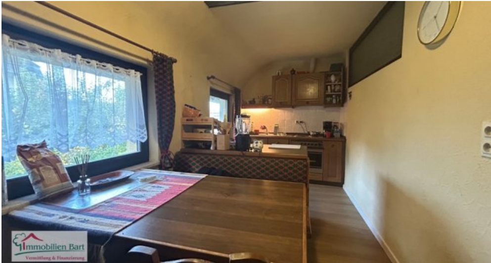
Küche Whg DG