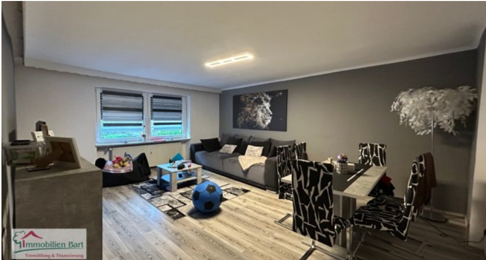
Wohnbereich Whg 1 OG