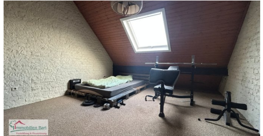
Hochparterre Whg DG