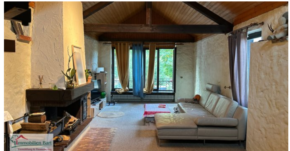
Wohnbereich Whg DG