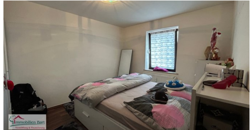
Schlafzimmer Whg 1 OG