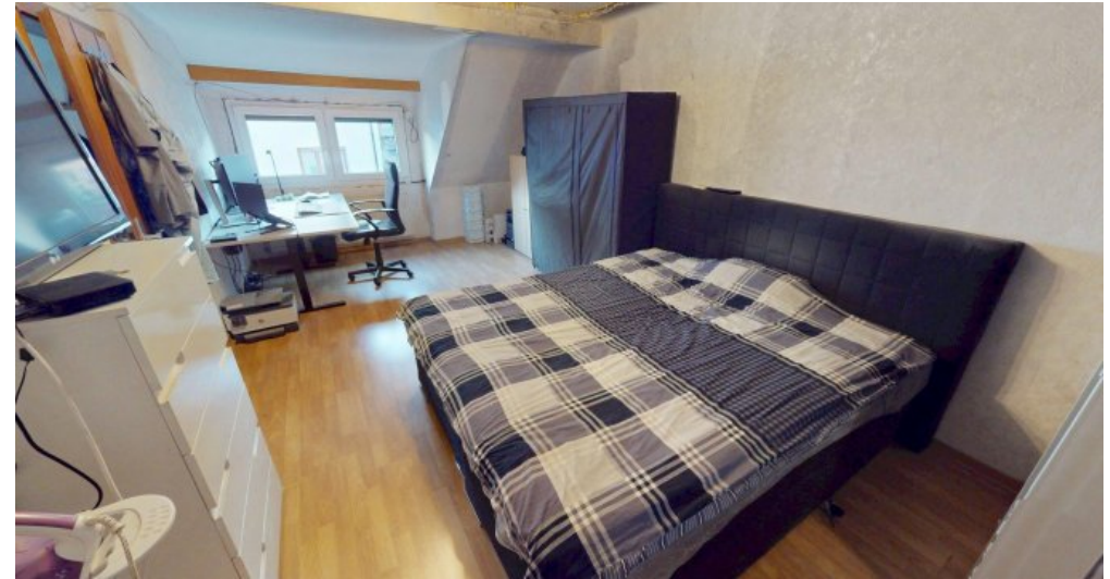
Schlafen DG alt