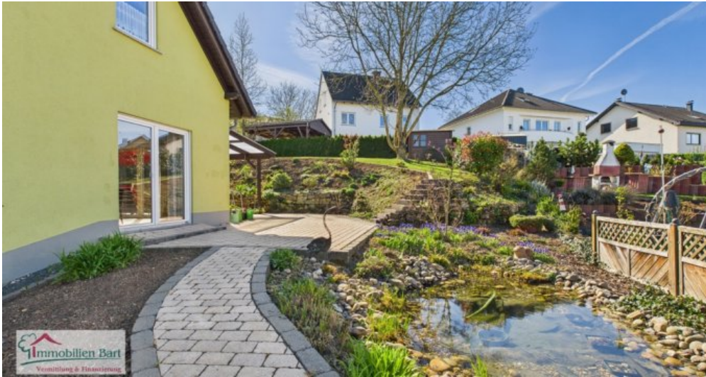
Terrasse mit Gartenteich