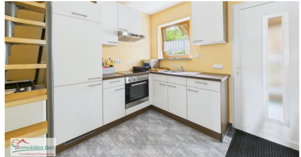
Küche (sep. Wohnung)