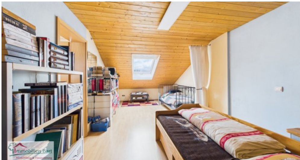
Schlafzimmer (sep. Wohnung)