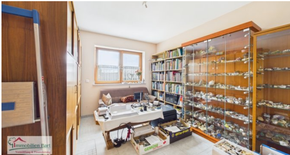
Wohnzimmer (sep. Wohnung)