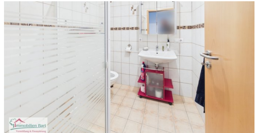
Badezimmer (sep. Wohnung)