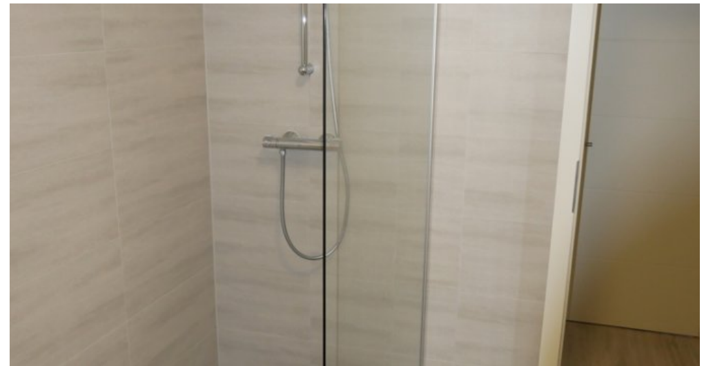
Bad OG re