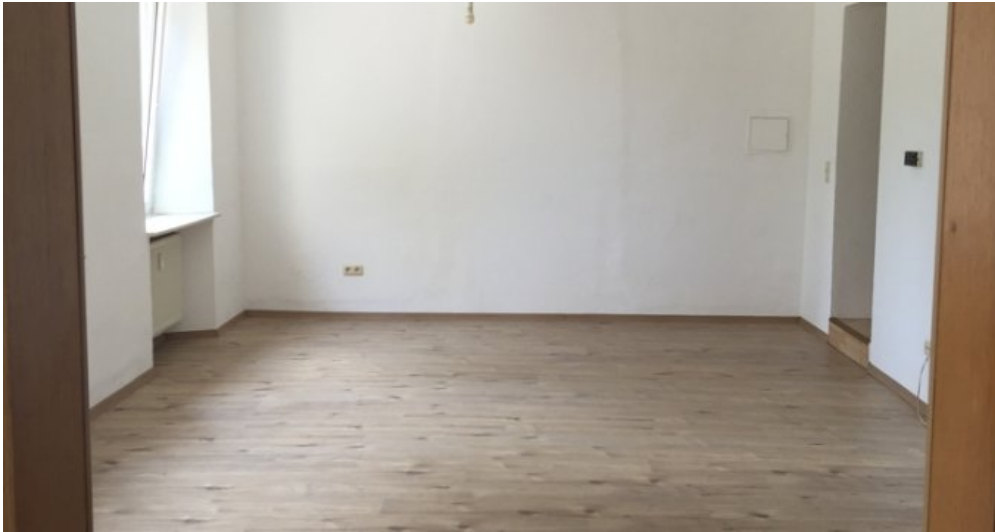
Neu renovierte Wohnung