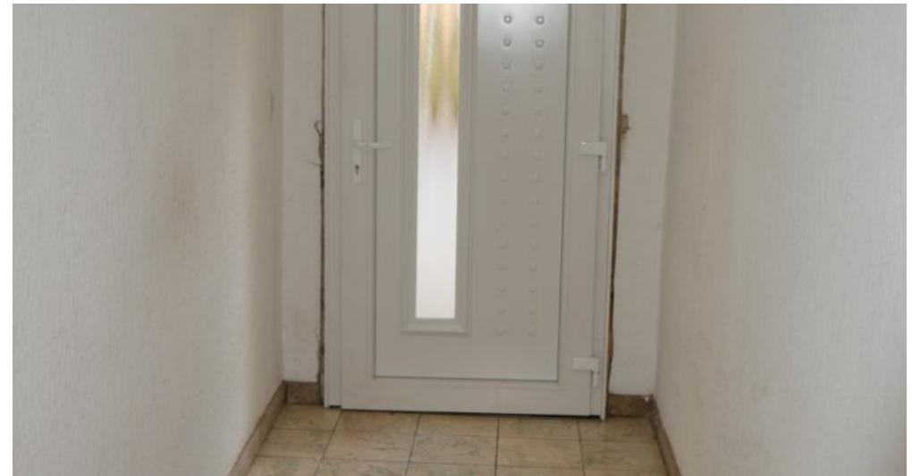
Die Bilder zeigen einen Ausschnitt von allen Wohnungen