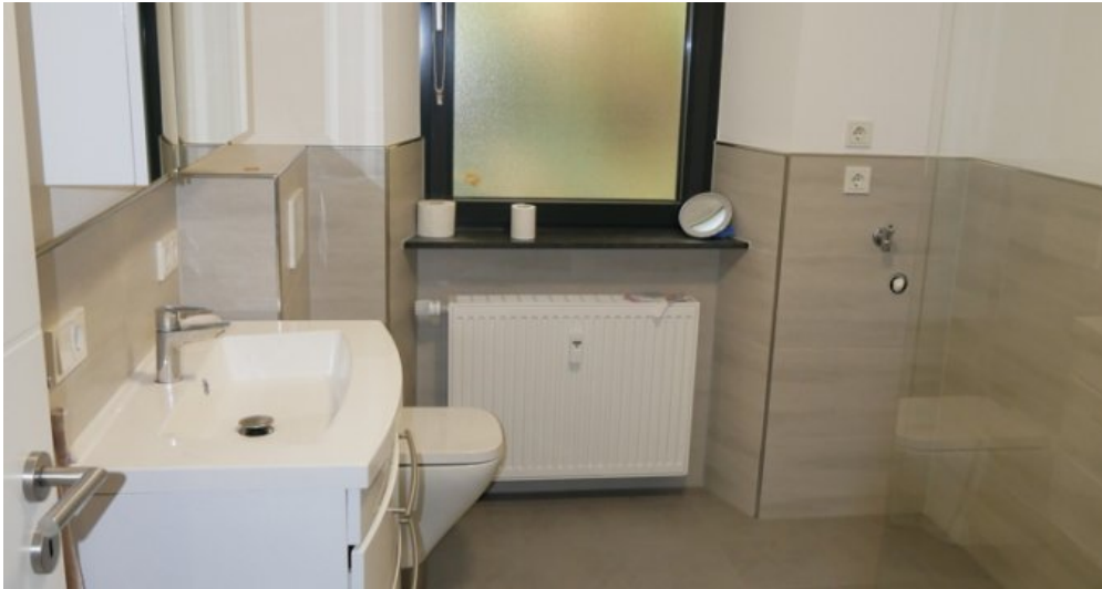
Bad OG re