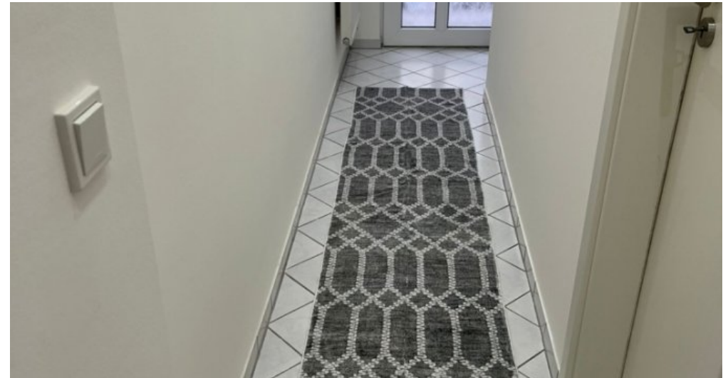
Flur - Eingang