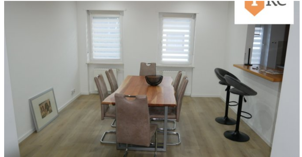
Esszimmer mit Durchreiche zur Küche