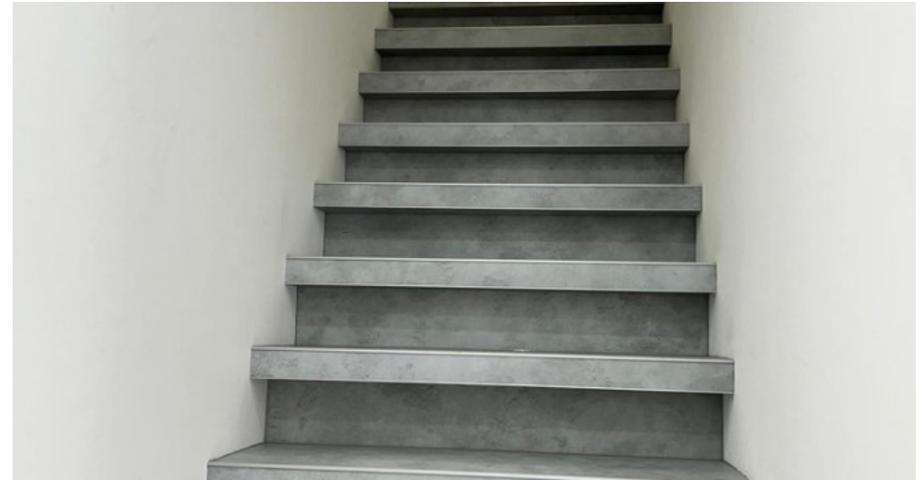
Treppe zum DG