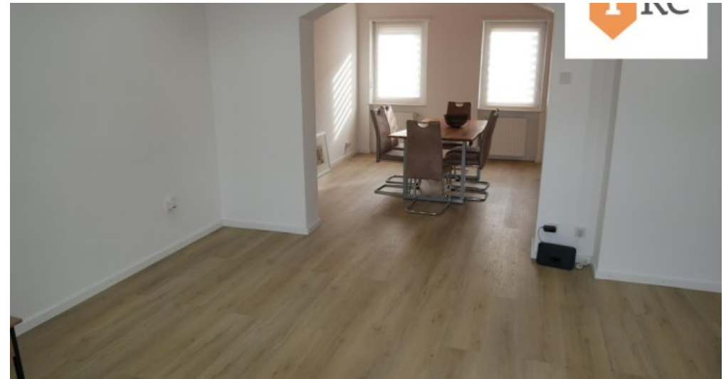
Blick vom Wohn-Esszimmer