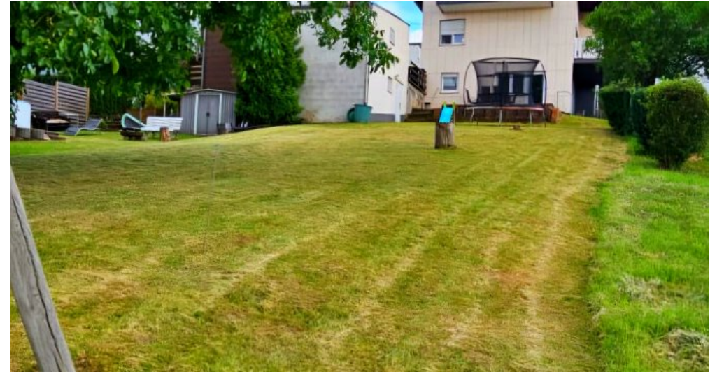
Rückansicht mit Garten