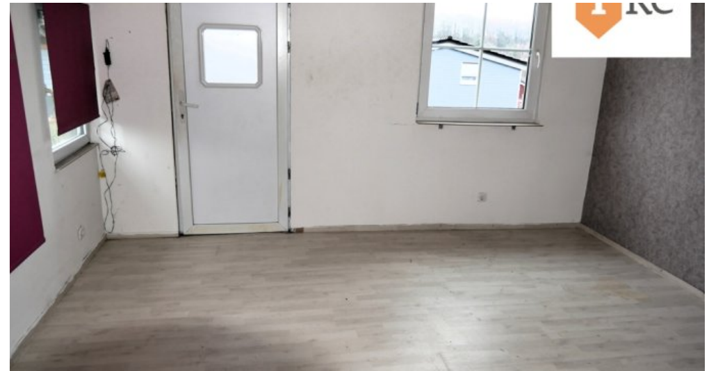
Schlafzimmer mit Tür zur einen späteren Terrasse