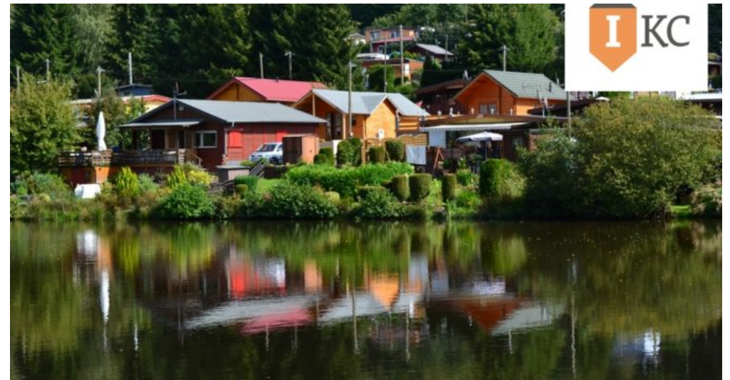
Bild 1 Schwarzrindersee