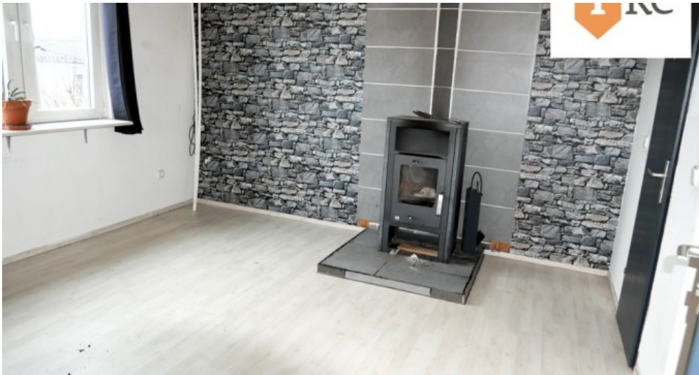
Wohnzimmer mit Kaminofen