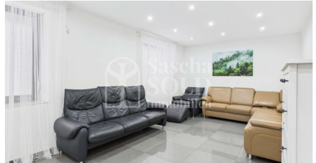
EG - Wohnzimmer