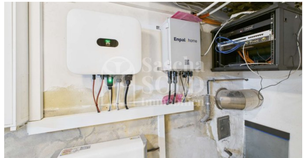
KG - Haustechnik