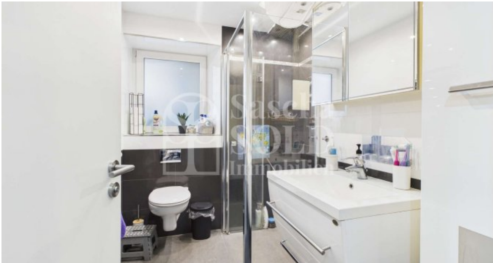
EG - Badezimmer