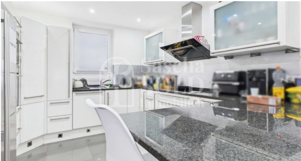
EG - Küche