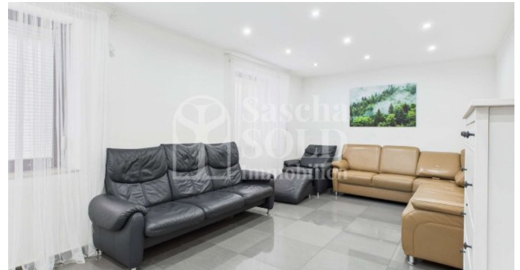
EG - Wohnzimmer