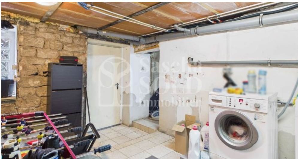
KG - Waschküche