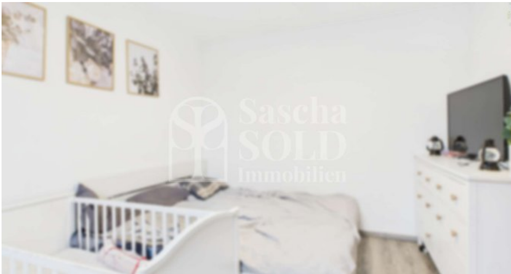
OG - Schlafzimmer