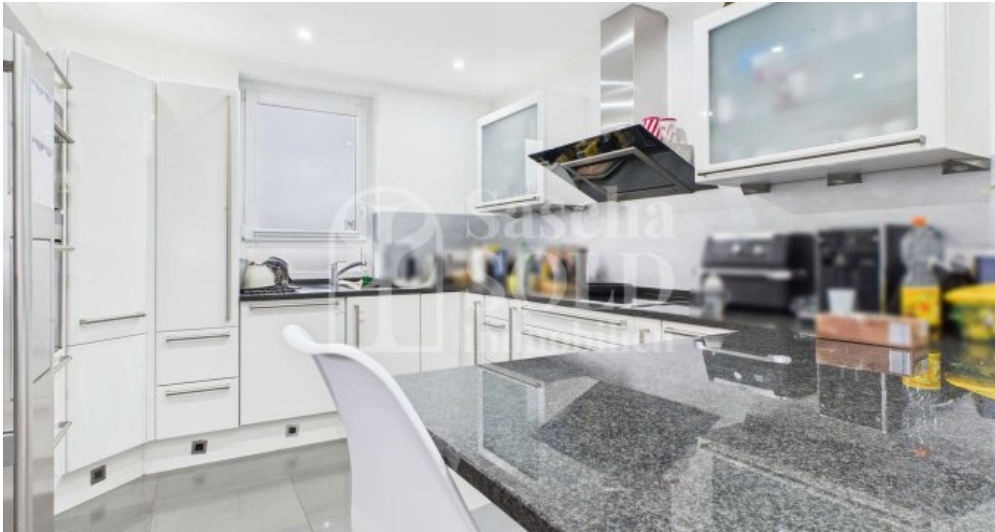
EG - Küche