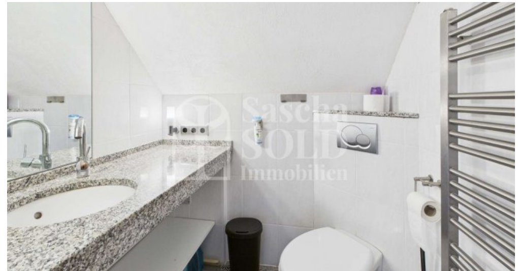
OG - WC