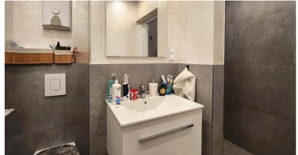
OG links modernes Duschbad mit luxuriöser Walk-In Dusche