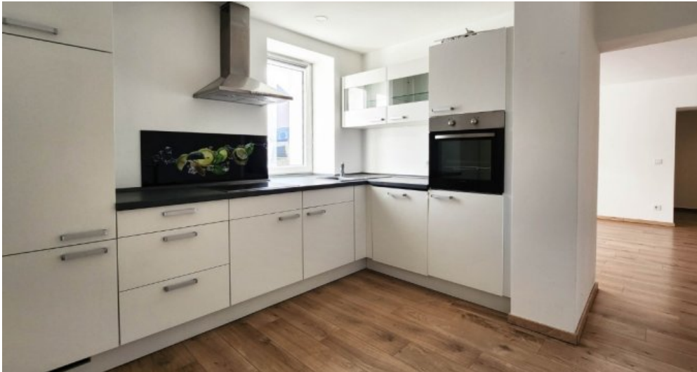
EG links moderne Einbauküche im Kaufpreis inbegriffen - Blick ins Wohnzimmer