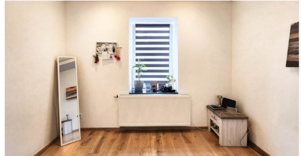
OG rechts ein weiteres von insgesamt drei Schlafzimmern