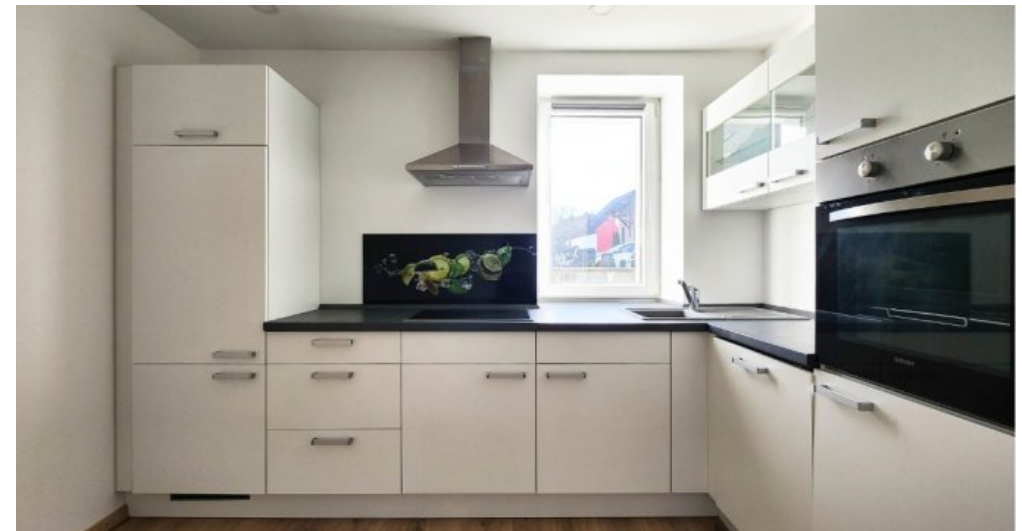
EG links moderne Einbauküche, im Kaufpreis inbegriffen