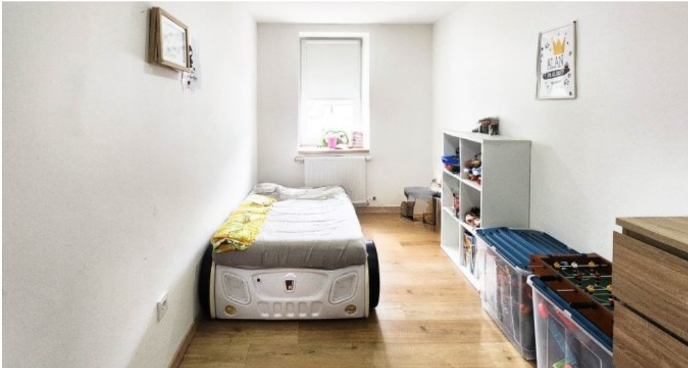
OG rechts Kinderzimmer (eins von insgesamt drei Schlafzimmern)