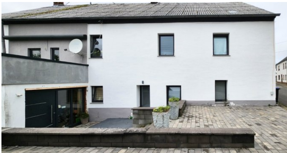
Rückansicht - Eingang zu den beiden Obergeschoss-Wohnungen und Parkplätze