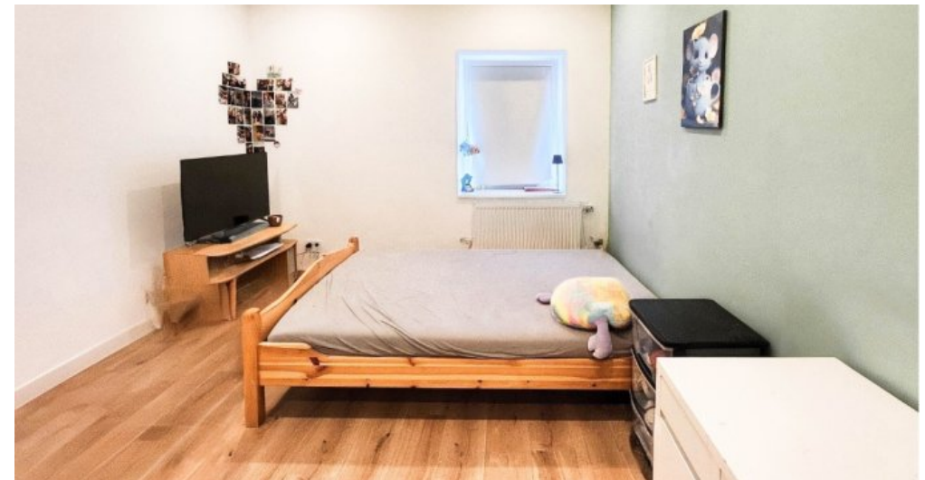
OG rechts das dritte von insgesamt drei Schlafzimmern