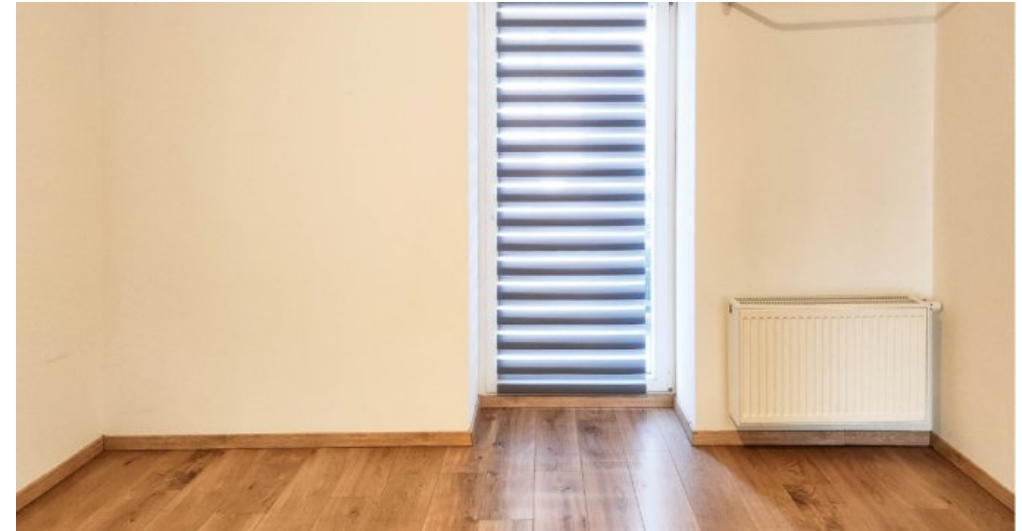
EG links ansprechendes Schlafzimmer zum Wohlfühlen