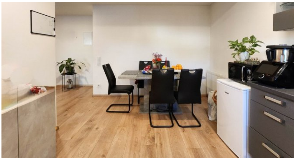
EG rechts Blick von der Küche zum Essbereich