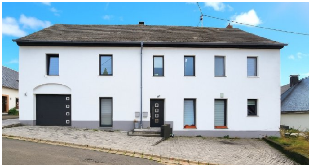
Frontansicht - Eingang zu den beiden Erdgeschoss-Wohnungen