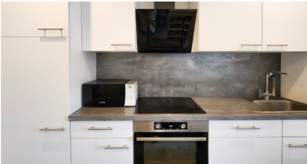
OG rechts Wohnküche mit Einbauküche, im Kaufpreis enthalten