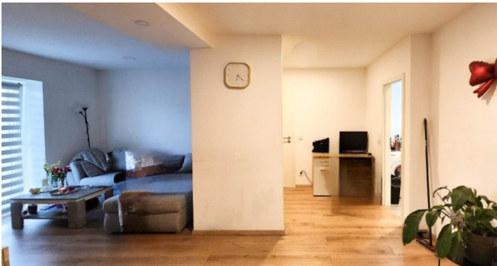
EG rechts Blick vom Essbereich auf Wohnzimmer und Eingangsbereich