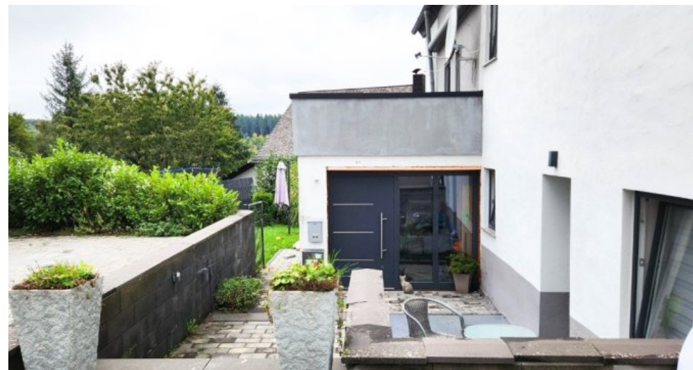
Rückansicht - Eingang zu den beiden Obergeschoss-Wohnungen