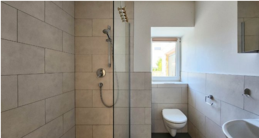
EG links helles, modern gestaltetes Tageslicht-Bad mit luxuriöser Walk-In Dusche