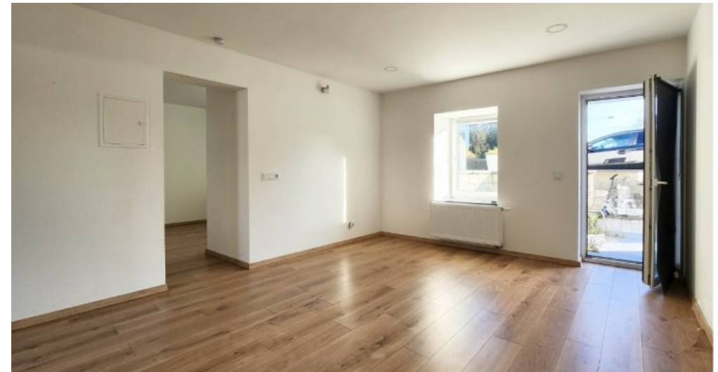
EG links großzügiges Wohnzimmer mit Zugang zur privaten Terrasse