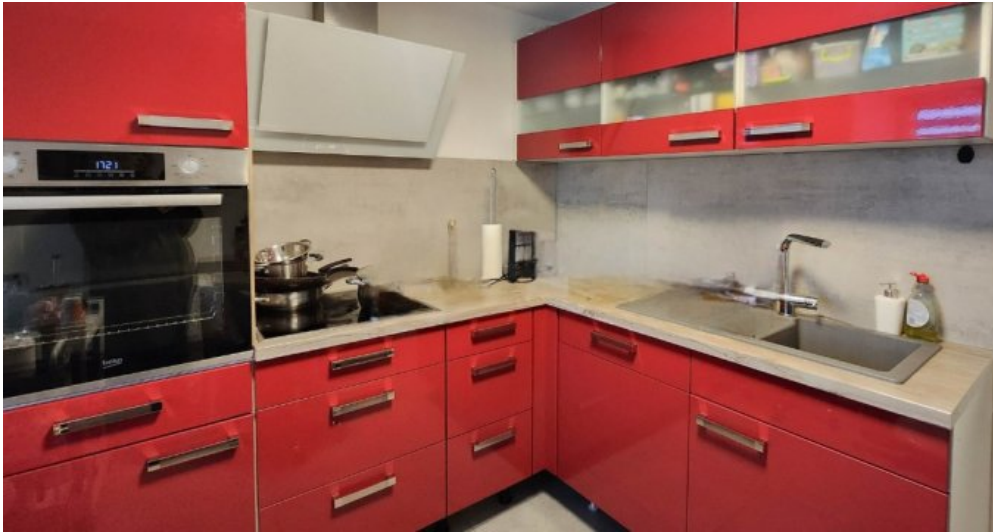
OG links Kücht mit moderner Einbauküche, im Kaufpreis inbegriffen