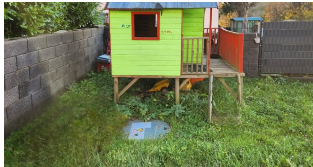
Für die Mieter nutzbarer, umzäunter Garten mit Spielgerät und unterirdischem Gastank