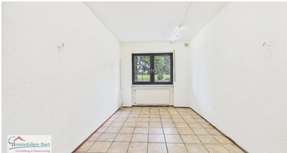
bisherige Nutzung Gaststätte