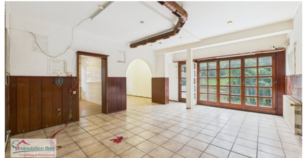
bisherige Nutzung Gaststätte