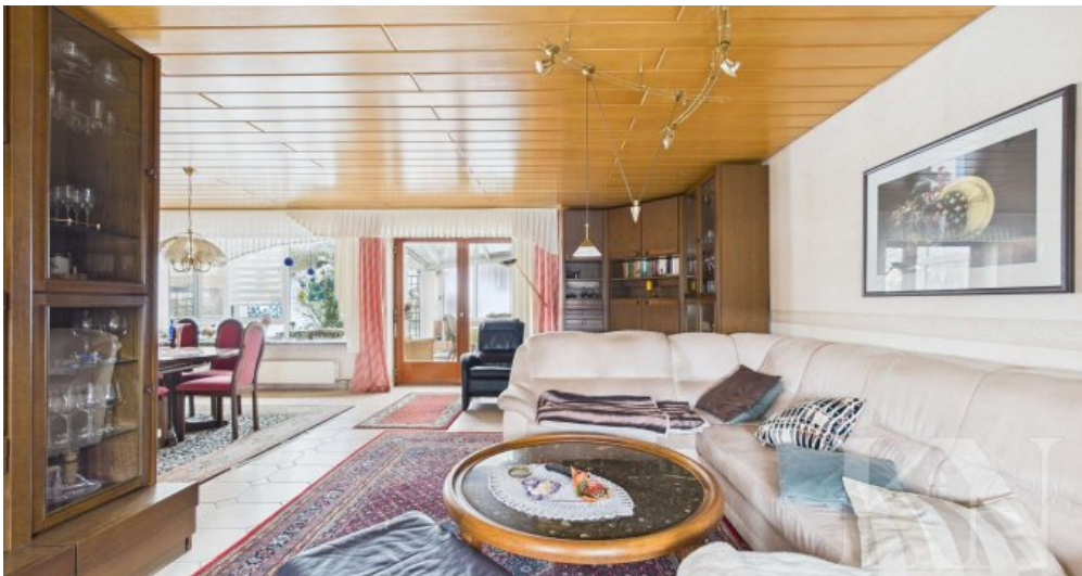
OG Wohn- und Esszimmer