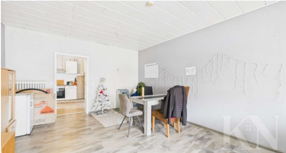
ELW Wohn- / Esszimmer