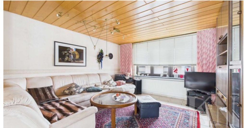
OG Wohn- und Esszimmer