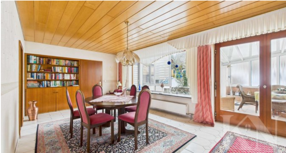
OG Wohn- und Esszimmer