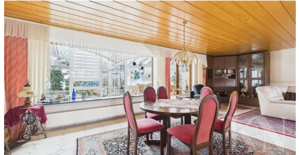
OG Wohn- und Esszimmer