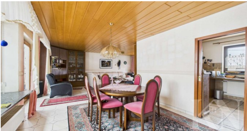
OG Wohn- und Esszimmer