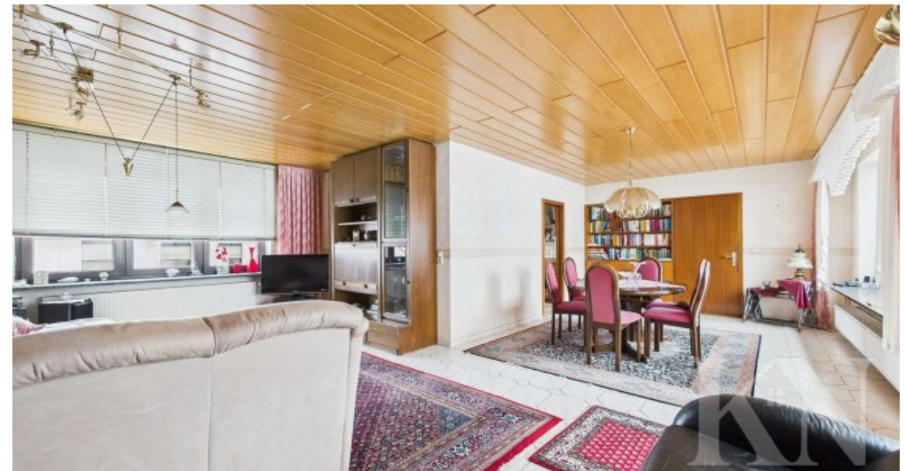
OG Wohn- und Esszimmer