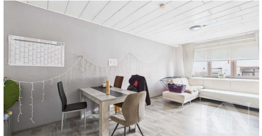
ELW Wohn- / Esszimmer