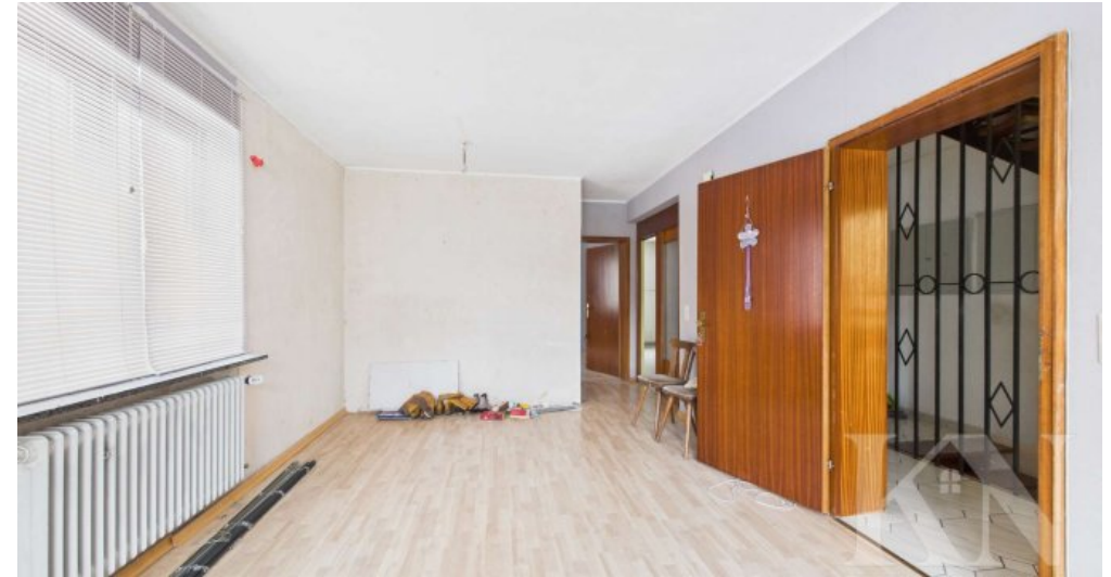
EG Wohn- / Esszimmer