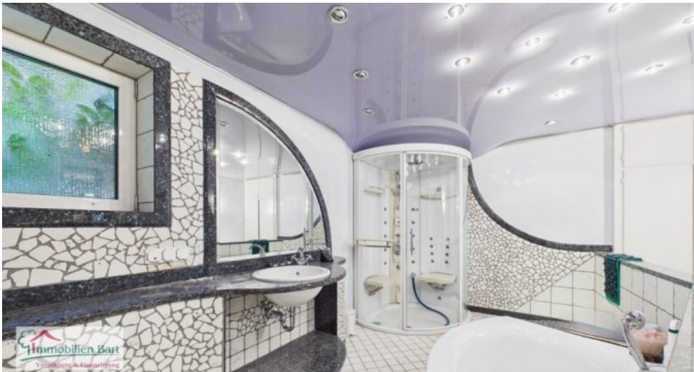
Wellnessbereich mit Dampfdusche