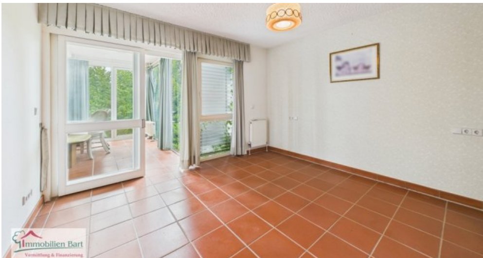
Schlafzimmer 1. Whg im 1. UG