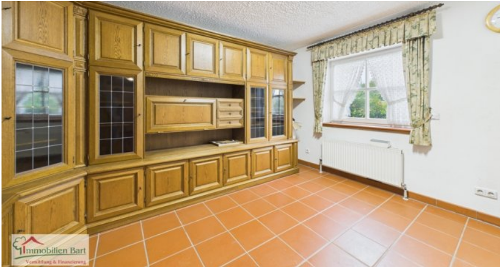
Büro/Schlafzimmer Whg im EG