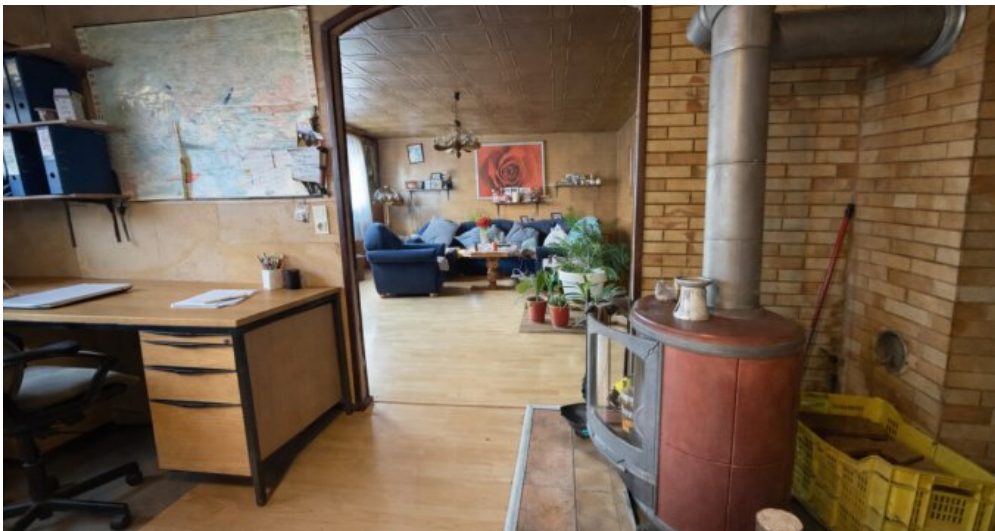
Wohnzimmer + Holzofen