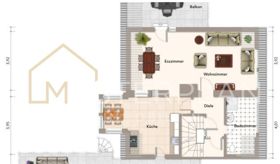
OG Wohnung 2