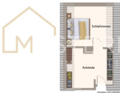
DG Wohnung 2