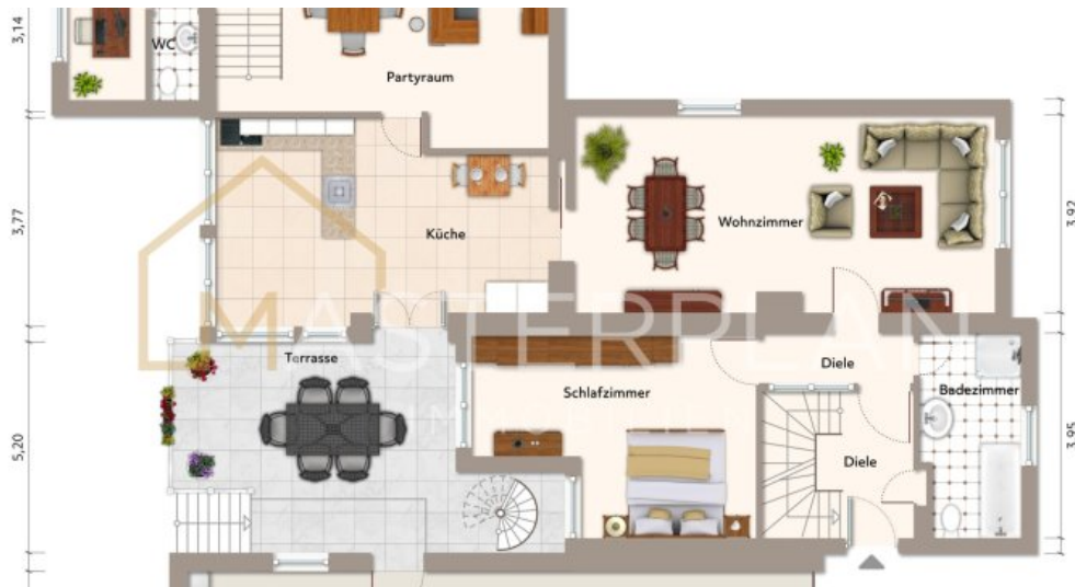
EG Wohnung 1