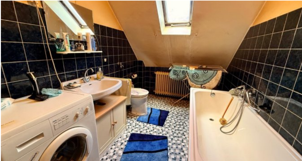
Tageslichtbad mit Wanne