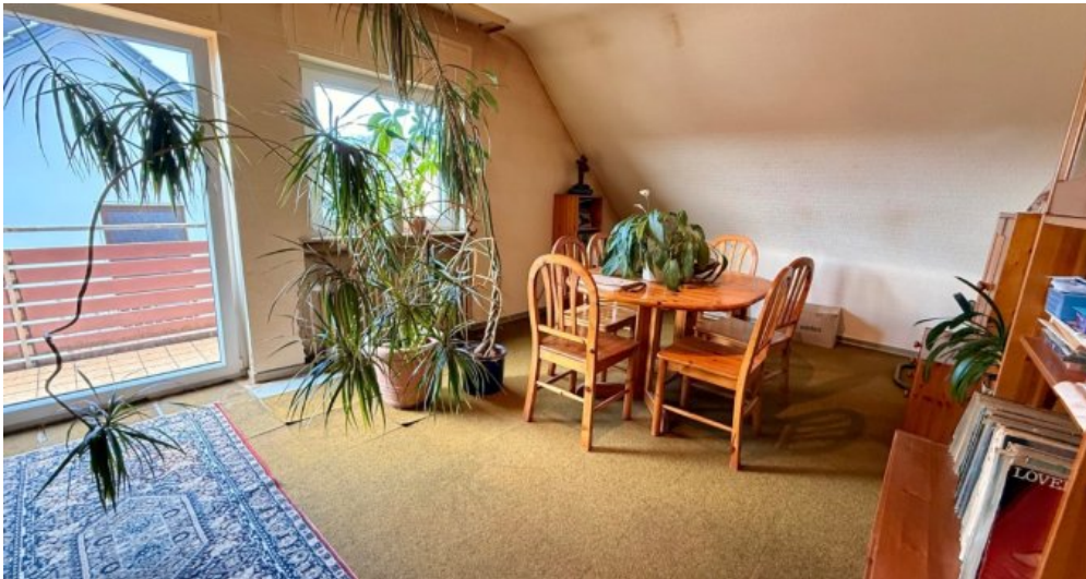
Wohn- Esszimmer mit Balkon