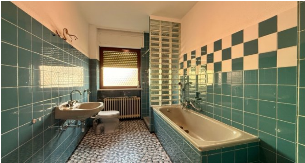
Tageslichtbad mit Wanne und Dusche