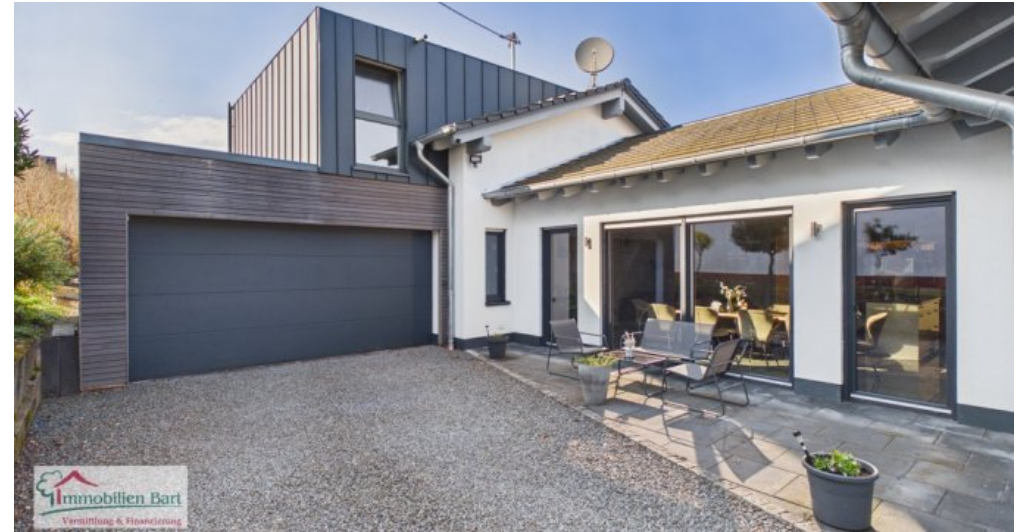
Terrasse neben dem Haus