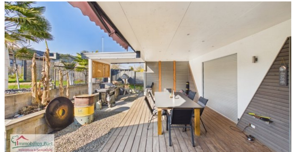
Terrasse hinterm Haus