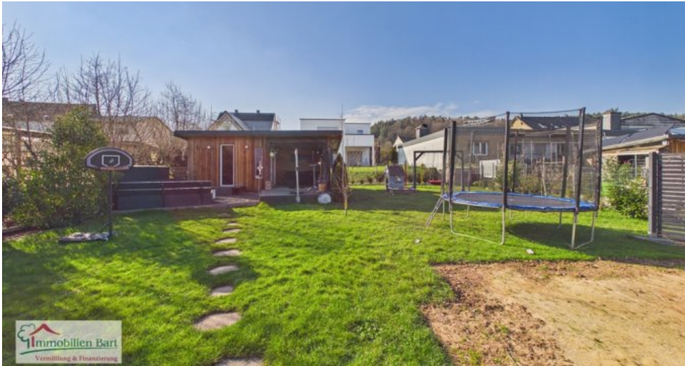
Garten mit Gartenhaus