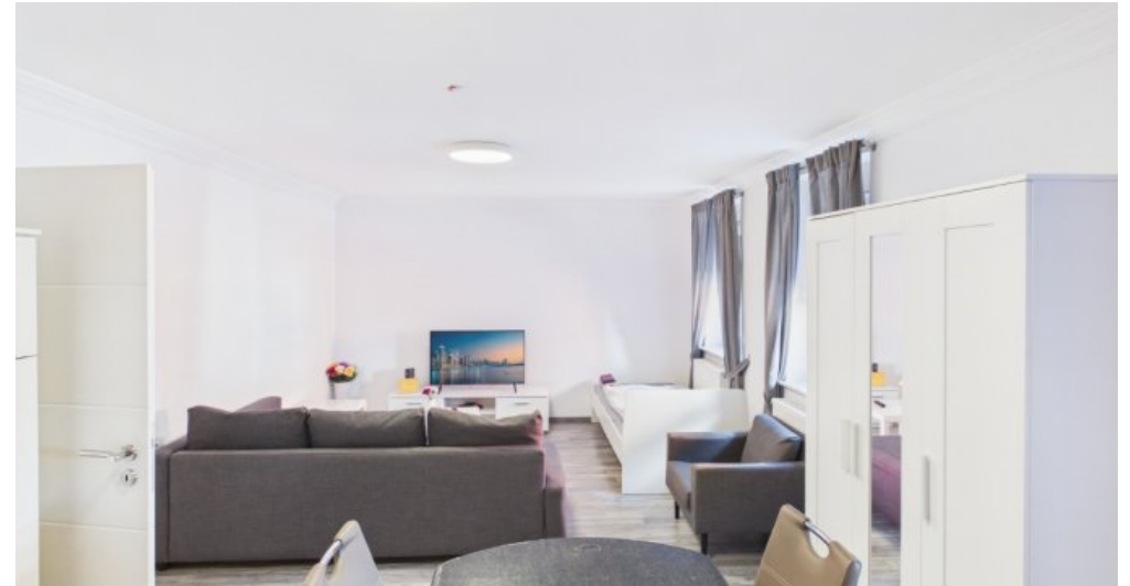
Wohn/Esszimmer 2 Etage