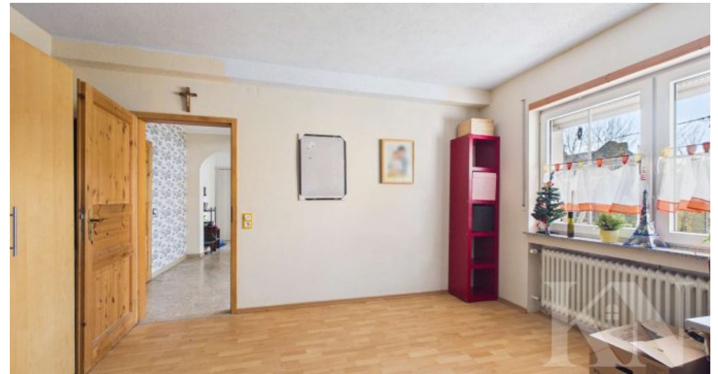
Schlafzimmer / Hobbyraum EG