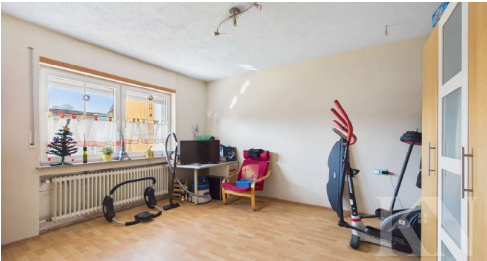
Schlafzimmer / Hobbyraum