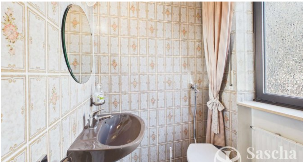
EG - Gäste-WC