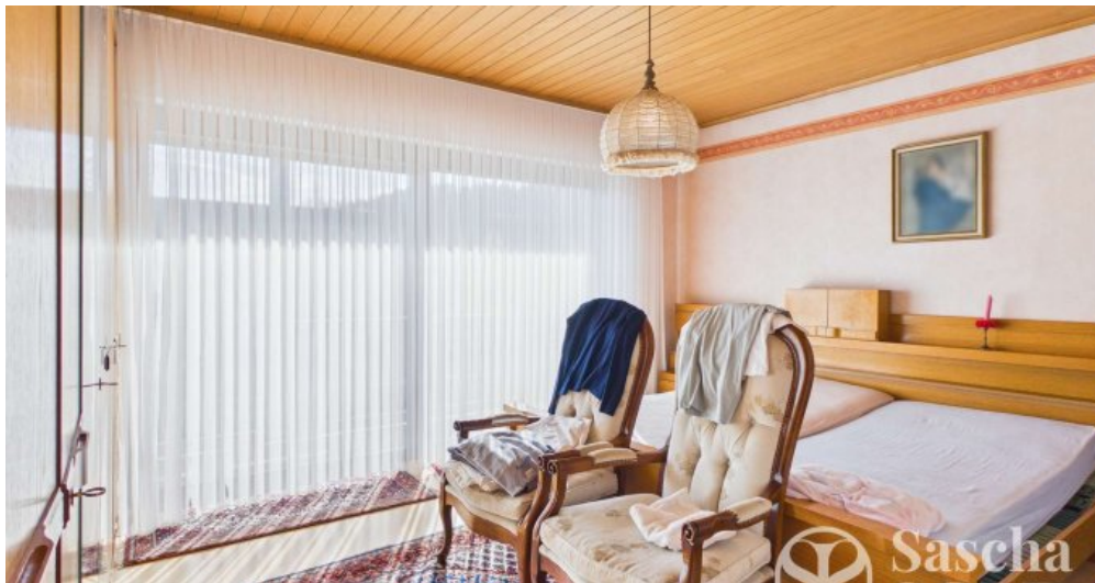
EG - Schlafzimmer