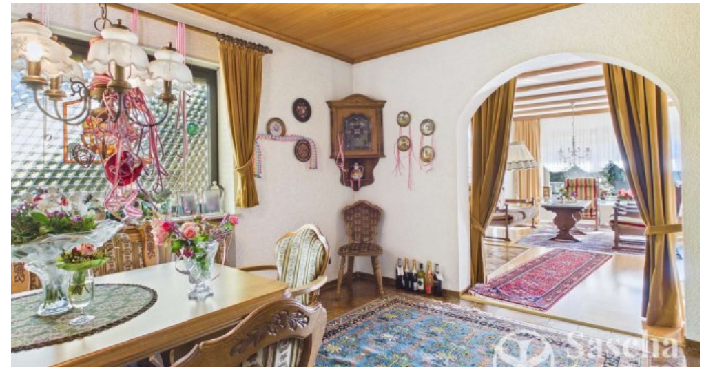
EG - Esszimmer