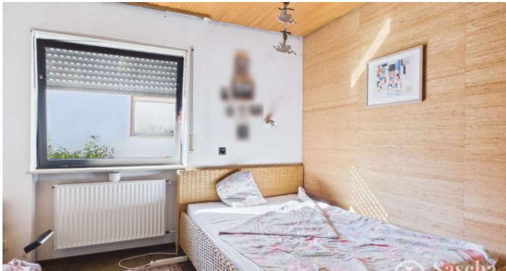
EG - Schlafzimmer