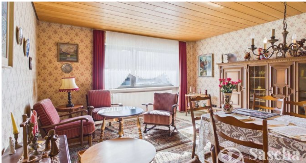
UG - Wohn- und Esszimmer