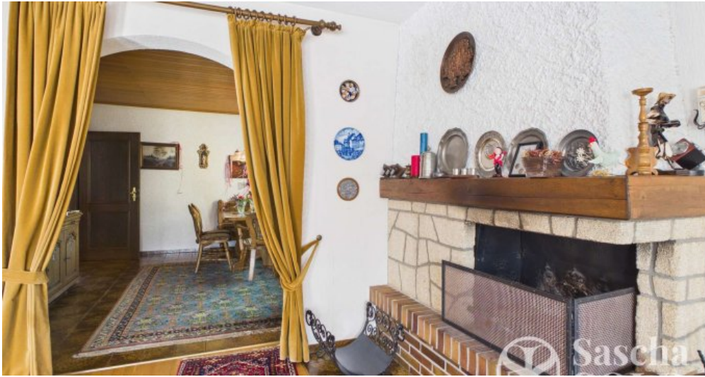
EG - Wohnzimmer