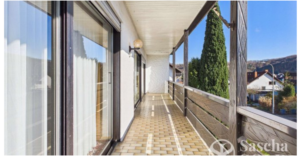
EG - Südbalkon