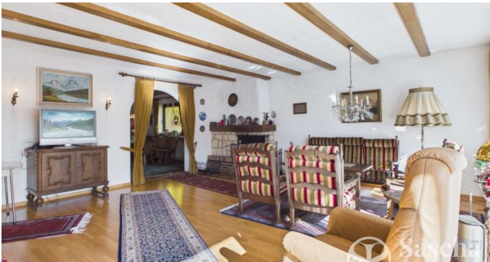
EG - Wohnzimmer