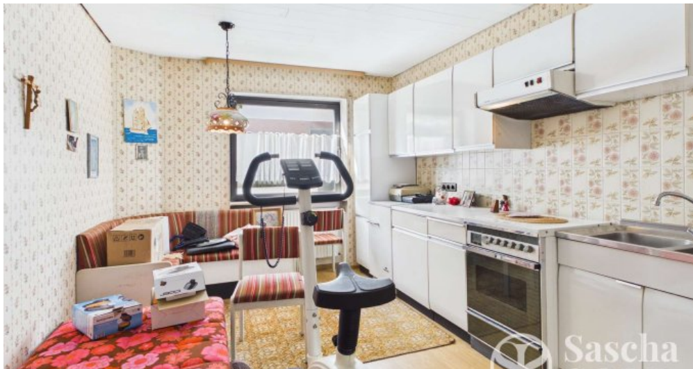
UG - Küche