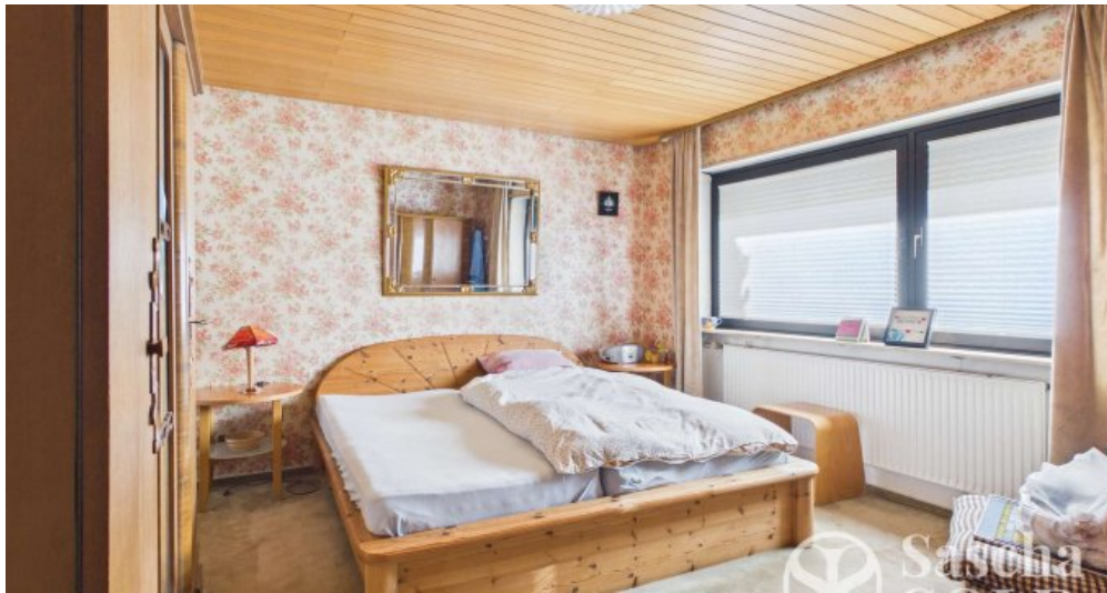
UG - Schlafzimmer