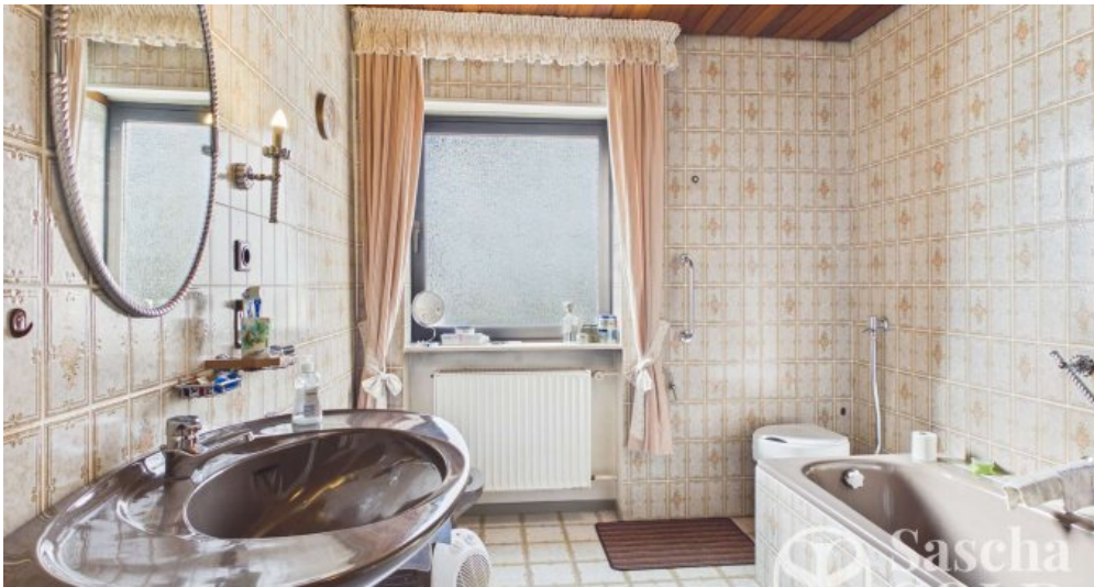
EG - Badezimmer