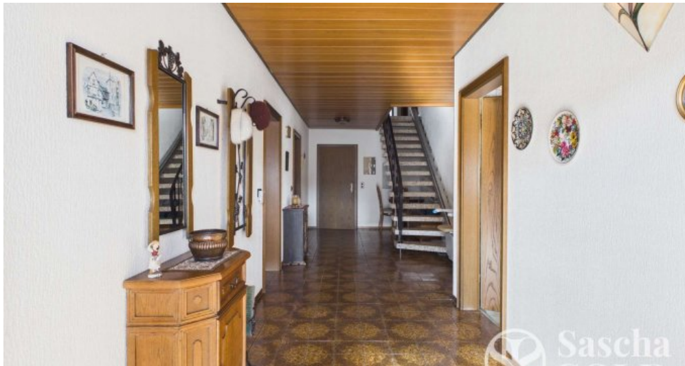
UG - Diele